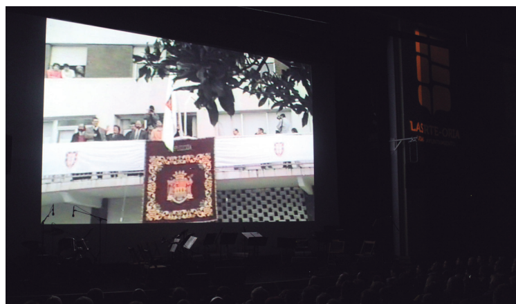
Oroitzapen ugari ekarri zizkien ikusleei larunbat arratsaldeko ekitaldiak.

Argazki-bilduma zabalaz gozatu zuten herritarrek; Zero Settek musikarekin girotu zuten. Gaur meza egingo dute Brigitarren komentuan goizeko hamaiketan; orain 30 urte bezala, udal ordezkariak bertara joango dira.