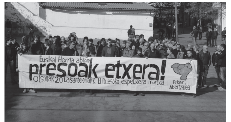
Hainbat herritarrek egin zuten bat egitasmoarekin, larunbatean.

Espetxeetara martxa antolatzearekin batera, ezker abertzaleak nahi du presoek