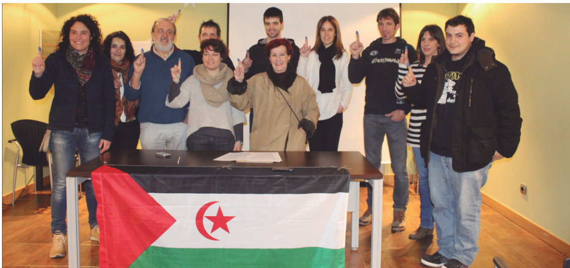
Behatz erakuslea urdinez margotu dute, erreferendumaren alde sinatzearen ikur gisa.

Aipatu bezala, otsailaren 27an kontzentrazioa egingo dute