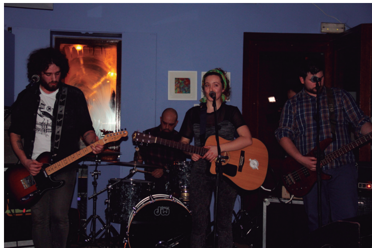
Emanaldi indartsua eskaini zuen Liherrak ostiral gauean.

Ostiral gaueko bi ekitaldiek harrera oso ona izan zuten; hainbat ikusle bertaratu ziren kafe antzokira, eta ez soilik lasarteoriatarak. Inguruko herrietako jendea ere etorri zen umorea, dantza eta musika osagai izan zituen koktelaz gozatzera.