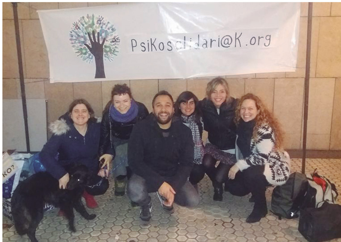
Psikosolidarioak taldeko kideen talde argazkia, webgunea finantzatzeko egindako jardunaldian.

rioren proiektuan parte hartu nahiko balu, dokumentu batzuk aurkeztu beharko lituzke. "Sistema ez kolapsatzeko arrazoiarekin" egiten dute, izan ere, baliabide mugatuak dituzte.