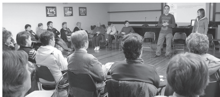
Lagundutako elkarte bateko kideak, AGIFESekoak, iraganean egindako hitzaldi batean.

ATECE Burmuineko kalte hartua duten pertsonen laguntzeko programa, ADEMG esklerosi anitza lantzen duena, ADSIS Fundazioaren Gazteak eta Kulturartekotasun programa, ADAHIGI Arreta Faltaren Nahasmendua eta Hiperaktibitatea duten umeen hautemate proiektua, AGIFES Burmuineko gaixotasunak