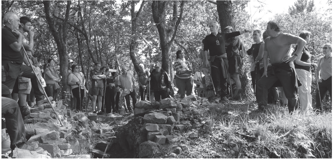
Ekainean egin bezala, Txaldataxur mendira bisita gidatua antolatu du Islada Ezkutatuak taldeak; oraingo honetan, gaztelaniaz.

Igande honetan beste bat egiteko asmoa dute; azalpenak gaztelaniaz emango dituzte. Okendon jarri dute hitzordua, 9:00etan. Ordu eta erdi inguruko ibilaldia izango dela jakinarazi dute antolatzaileek; gomendatu dute oinetako erosoak eramateko, ahal izanez gero. Deskuidoen eguraldi txarra egingo balu, atzeratu egingo lukete bisita.