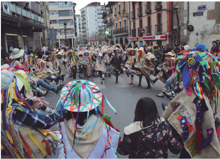
Lasarteoriarrek eta zubietarrek zenbait dantza egin zituzten batera.