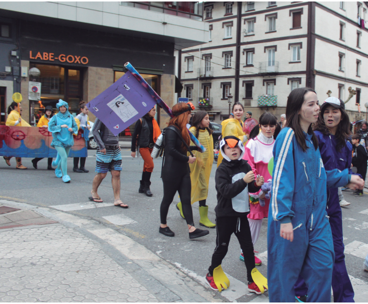
Ttakuneko Kuadrillategi eta Gazte Klubeko gazteak ere desfilean izan ziren.