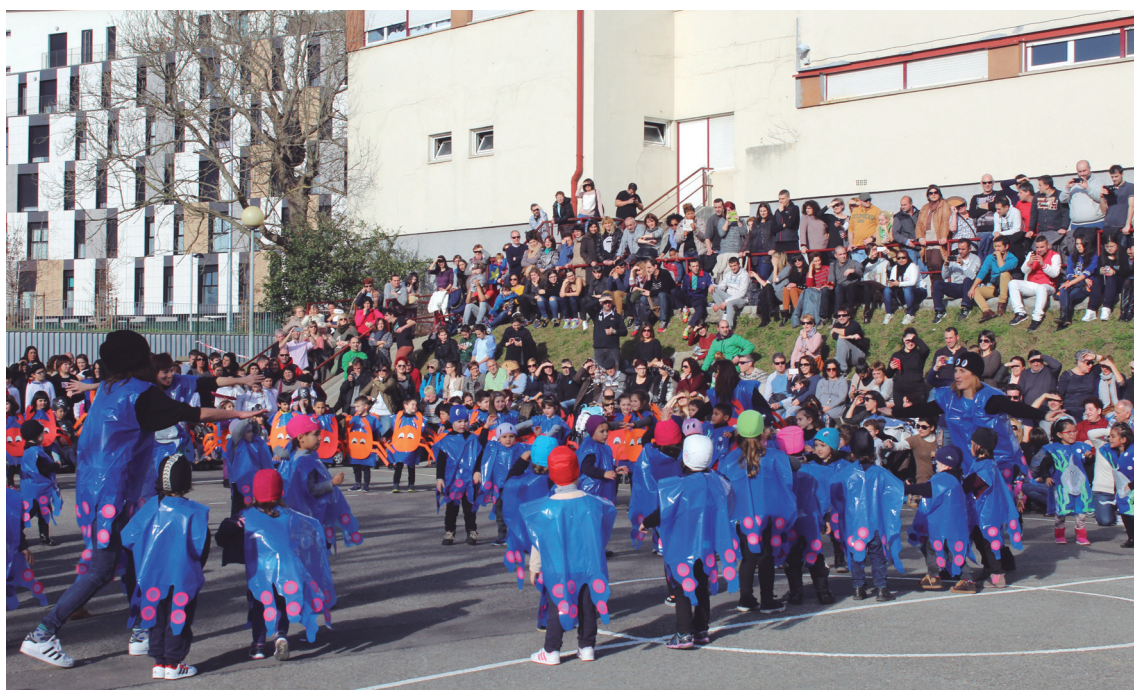
'Under the sea' doinuaren erritmoak itsaspeko animali andana ekarri zuen Saota-Zumaburu ikastetxeko patioa.