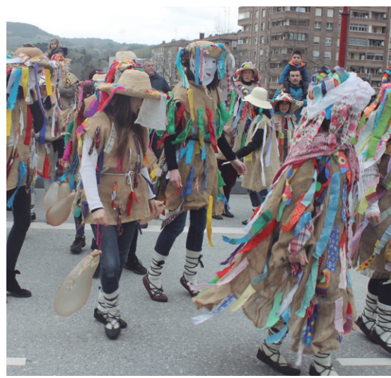
Txantxoak, hartza eta honen zaintzaileak izan ziren protagonistak Euskal Inauterietan.