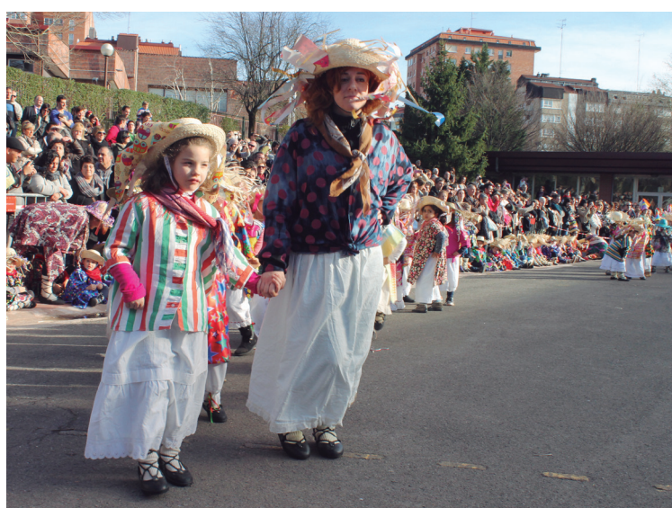
Euskal Dantzetan trebe zirela erakutsi zuten Landaberriko txikiek.