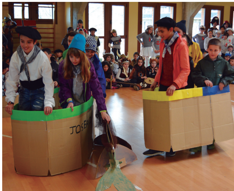
Landaberi LH-ko gazteek Euskal arrantzaleen istorioa antzeztu zuten.