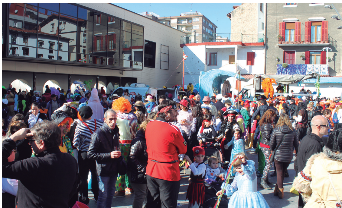
Eguraldia lagun, herritar ugari bildu zen konpartsen aurkezpena ikustera.