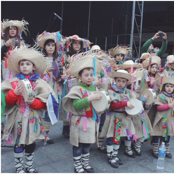
Okendo plazan Ttiriki Ttarrakako txikiek ederki astindu zituzten panderoak; beste batzuk berriz, ederki astindu zituzten,