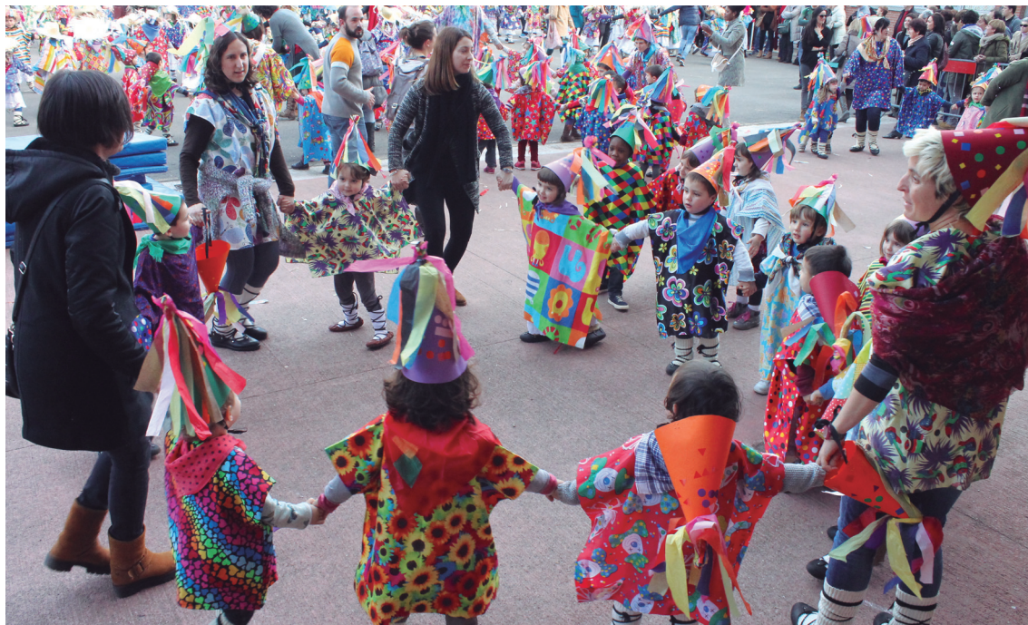
Haur eta gurasoek kolorez bete zuten Landaberi Garaikoetxea ikastolako patioa kalejira handia eginez.