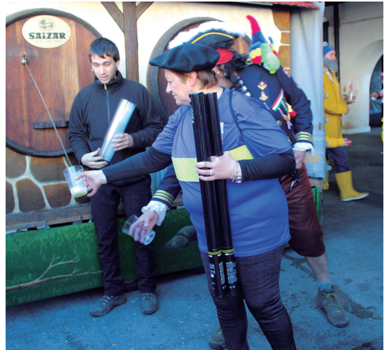
Txotx egiteko aukera ere izan zen Okendo plazan.