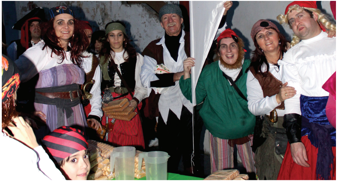
Zabaleta auzoko eta Barrenetxe okindegiaren eskutik txokolate jana goxoa izan zen desfilea amaitzean.