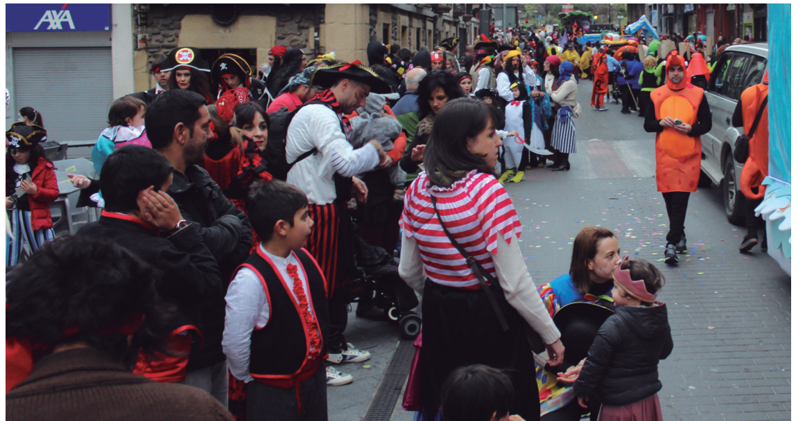
Herritar ugari hurbildu zen erdialdeko kaleetara desfilea ikustera. Gehienak mozorrotuta atera ziren kalera.