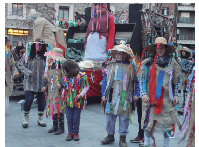
Lasarteoriarrek zubian itxaron zuten zubietarren etorrera. Herriko kaleetan zehar desfilatu ondoren, Okendo plazan bukatu zuten ekitaldia, hartza erreaz.