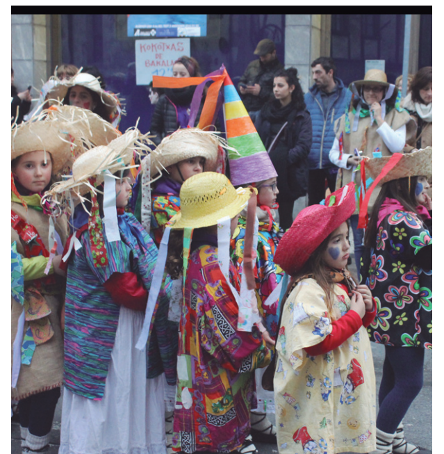
Hartza barrabaskerietan aritu zen desfilean eta zaintzaileak arazoak izan zituen kontrolatzeko. Bestalde, Zubietako lagunei txokolatada beroarekin egin zitzaizen harrera.