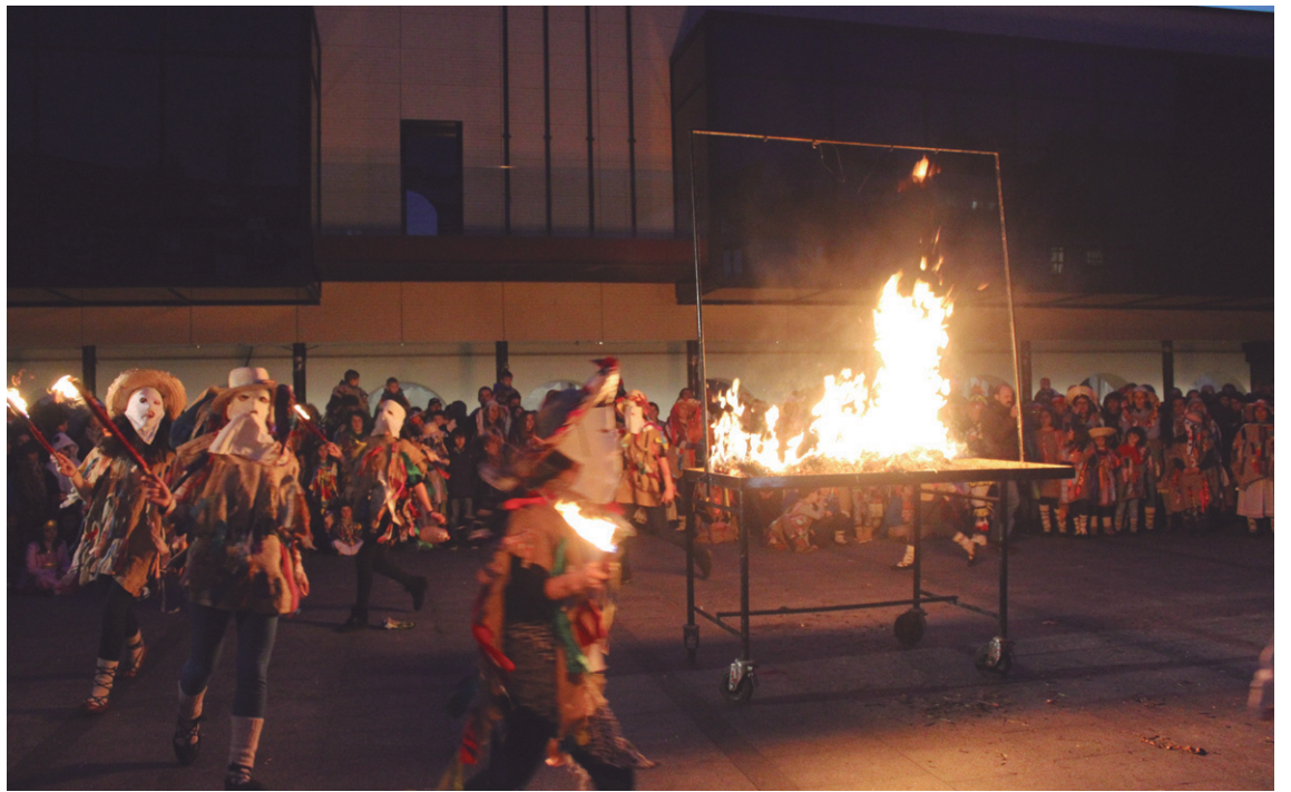
Hartzari su emanez bukatu zen jaia.