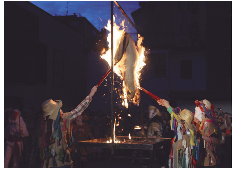
Hartza harrapatu ostean, erre egin zuten suaren ekitaldian.