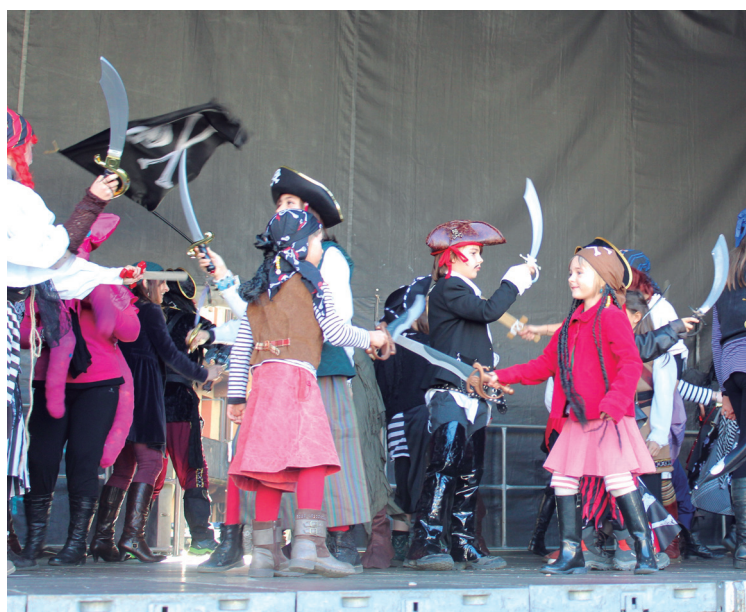
Zabaleta auzoko euskal piratak izan ziren lehenak oholtzara igotzen.