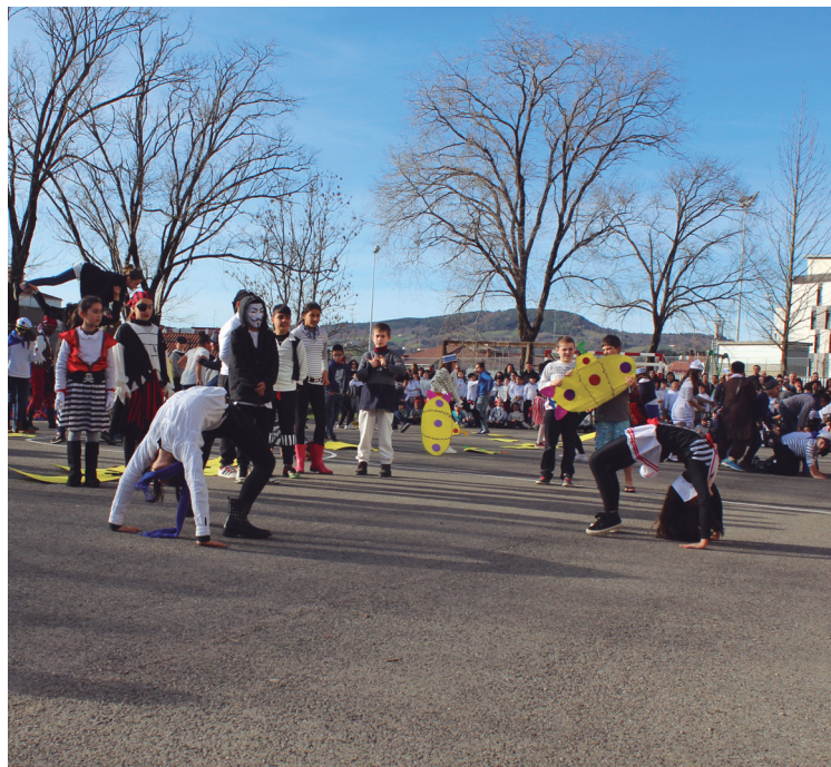
Urpeko bereziak iritsi ziren Sasoeta-Zumaburu ikastetxera.