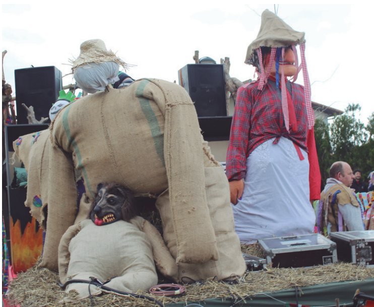
Karroza matxuratu egin zen eta Ttiriki Ttarraka-ko trikiritxa eta panderoek girotu zuten desfilea