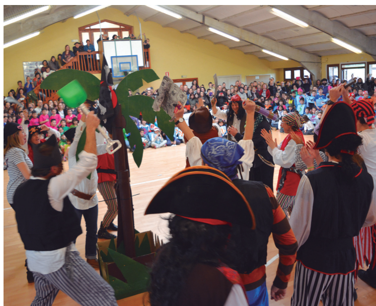
Landaberri LH-ko pirata bereziak altxorraren bila ibili ziren.