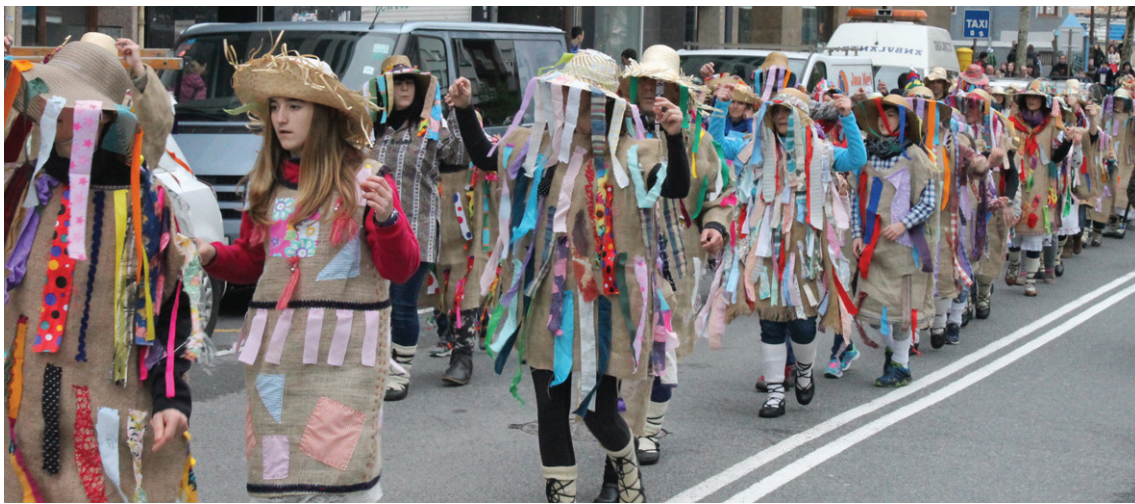
Lasarteoriarrek eta zubietarrek batera herriko kaleen dantza egin zuten.