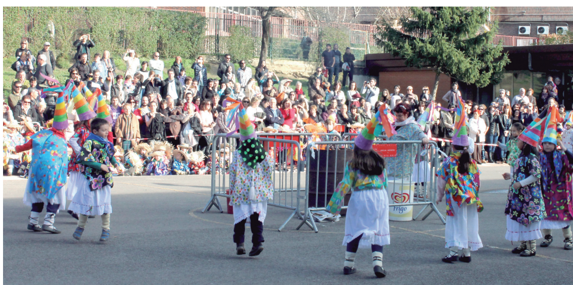
Egtuzkia eta ilargiaren jarraitzaileen borroka antzestu eta Miel Otxin erre zuten Landaberri Garaikoetxean.