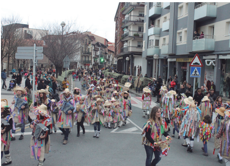
Kale Nagusia eta Ola Kaleko biribilgunean buelta eman zuen desfileak.