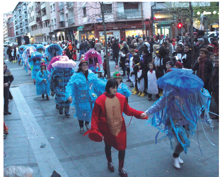
Erket EDT-ko lagunek euskal dantzak eta egungoak nahastu zituzten desfilean.