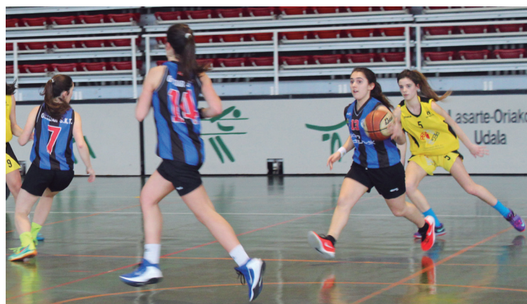
Ederki borrokatu beahr izan zuten junior neskek garaipena lortzeko.