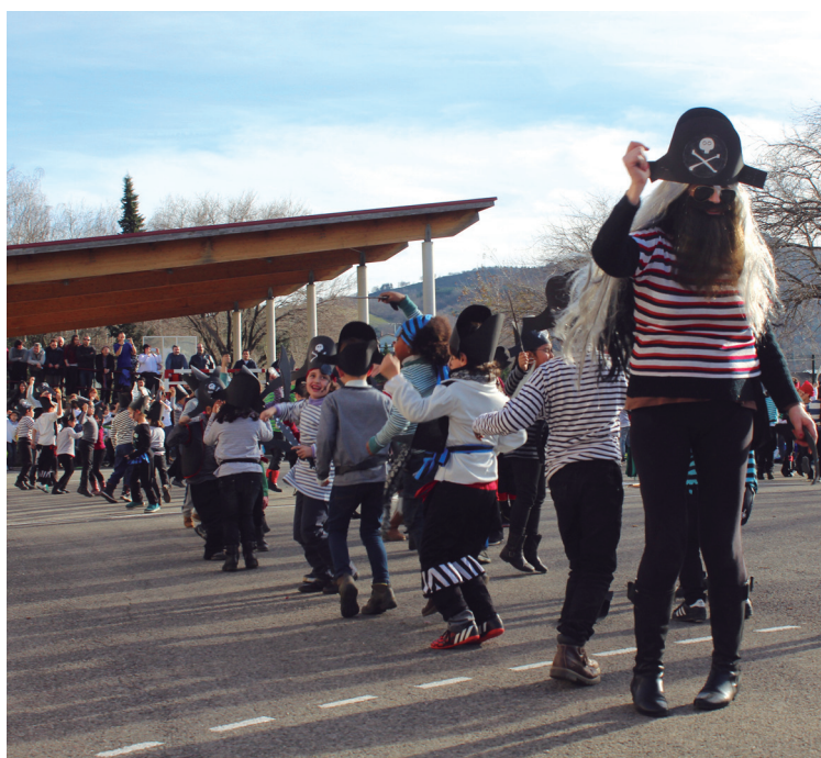
Saota-Zumaburu ikastetxean piratak izan ziren dantzan.