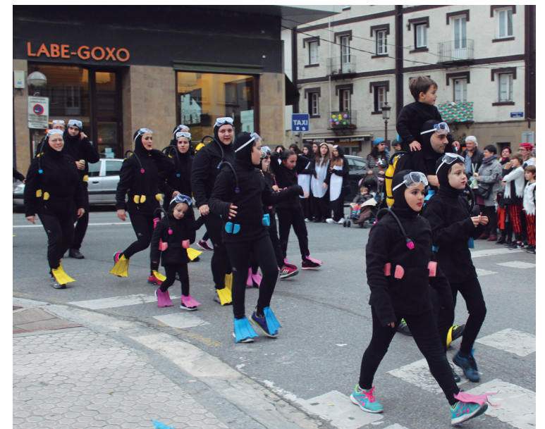
Nahaste Borrasteko usrpekari martxosoek ez zuten erritmoa galdu.