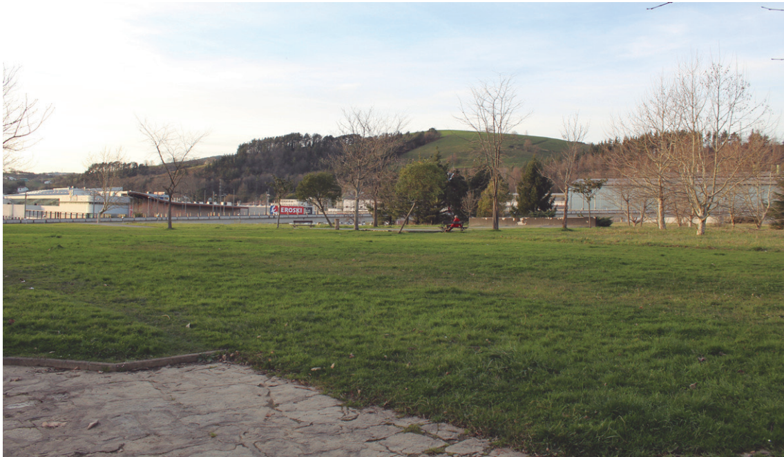
Kirolgune berria egiteko proiektuan hautatutako lursaila.

Atsotakarren gune berria eraiki nahian bilduko dira Usurbilgo eta Lasarte-Oriako Udalak