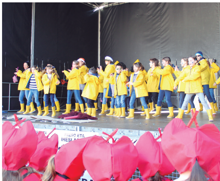
Larramezndizaleak taldeak antzerkia eta dantza nahastu zituzten.