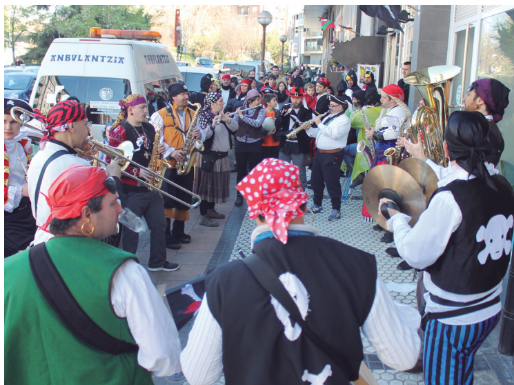
Oaitxe in deu!! txarangak girotuta pintxo potea egin zuten askok.