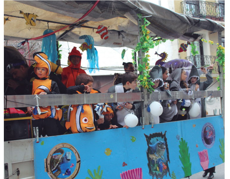
Tekila konpartsako Nemo eta bere lagunak desfilean goxokiak botatzen egon ziren.