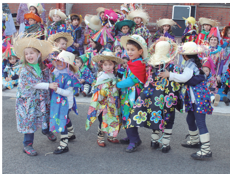
Euskal Inauterietako doinuak ederki dantzatu zituzten Landaberriko txikiek.