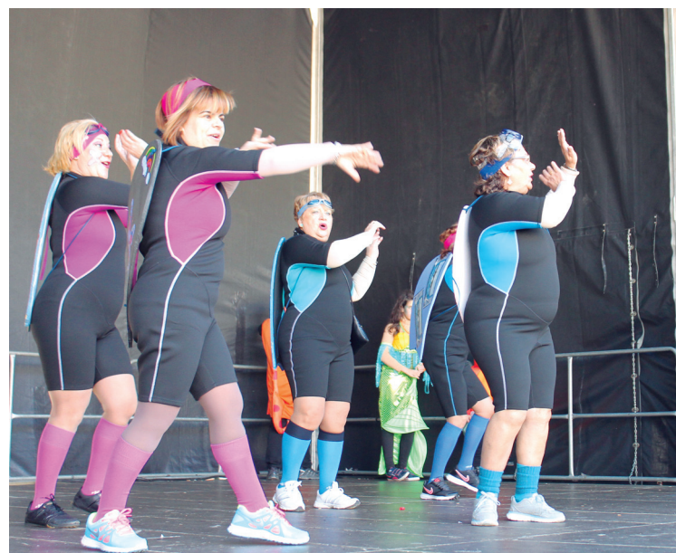
Zentro zibikoko surflariak ederki egin zuten dantza.