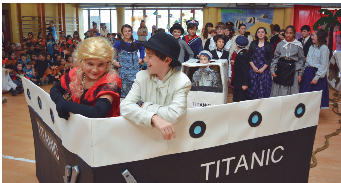
Titanic ontzia eta bere protagonistak ere izan ziren Landaberri LH-ko jaialdian.