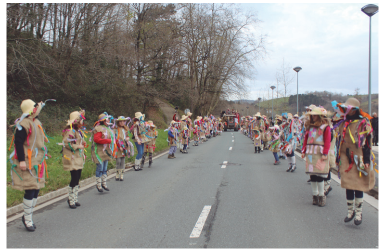
Zubieta eta Lasarte-Oria arteko bidean dantza etorri ziren zubietarrak.