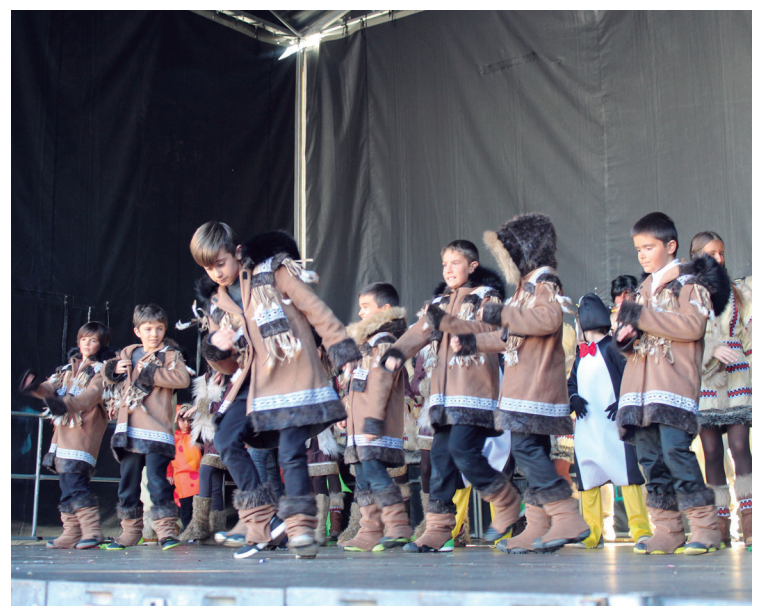
Elkar taldeko gaztetxoek gorputzean erritmoa dutela erakutsi zuten.