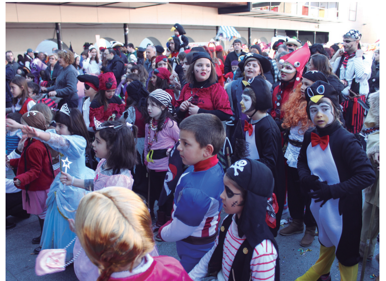
Haurrek ederki gozatu zuten goizeko ekitaldiarekin. Amaieran, goxokiak izan zituzten.