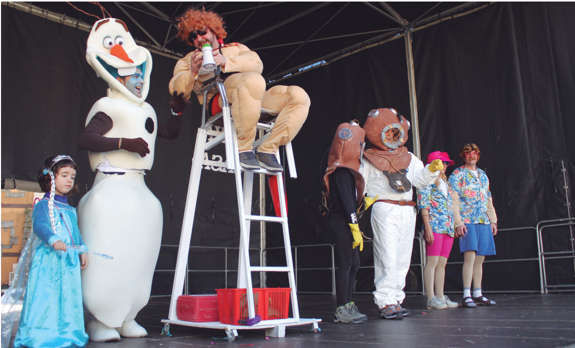
Mozorro lehiaketara aurkeztu ziren herritarrak. Irabazlea lehengo mendeko urpekari bikotea izan zen.