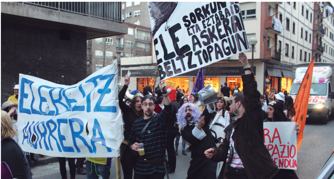
Elebeltz Topagunearen aldeko batukada bat ere izan zen herriko kaleetan eta desfilearekin bat egin zuen momentu batean.