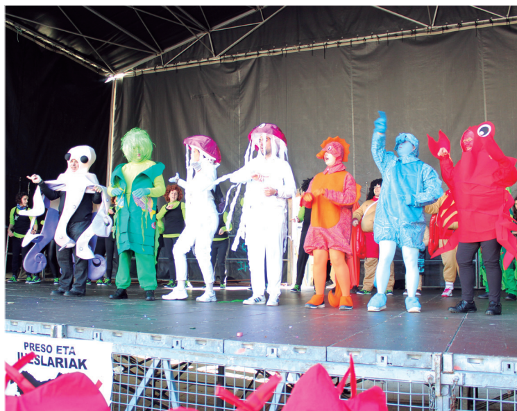
Jalguneko lagunek Donostia 2016 emanaldia eskaini zuen.