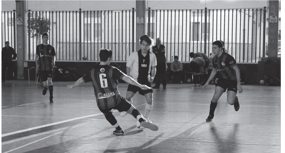
Garesti saldu zuen atzoko porrota Lasarte Kafe Bar Ostadar taldeak.

Lehenengo sasoi izanagatik, ederki ari da Lasarte Kafe Bar Ostadar, eta jokatutako hamaika partiduetan hamar puntu zakuratu ditu.