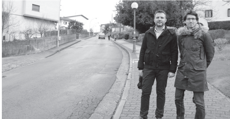
Buenos Aires aldapan egokitze-lanak egingo ditu Udalak.

Udalak Zabaleta auzoko irisgarritasuna hobetzeko plana aurkeztu du. Buenos Aires aldapan espaloien zabalera handituko dute, eta puntu batetik aurrera norabide bakarreko errepidea ezarri. Eusko Legebiltzarrean lortutako akordioari esker lortu du Lasarte-Oriako Udalak hirigintzara bideratzeko miloi bat euroko aurrekontua.