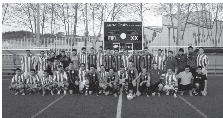
Bi taldeek batera atera zuten argazkia jokatzen hasi aurretik.