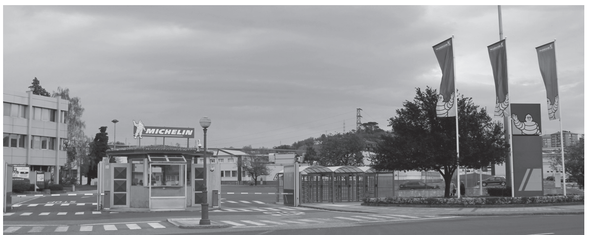
Michelin enpresako makinetako batek egin zuen eztanda eta ez da zauriturik izan.

Tailer honetan egindako mintzak beste Michelingo beste fabriketara edo kanpora