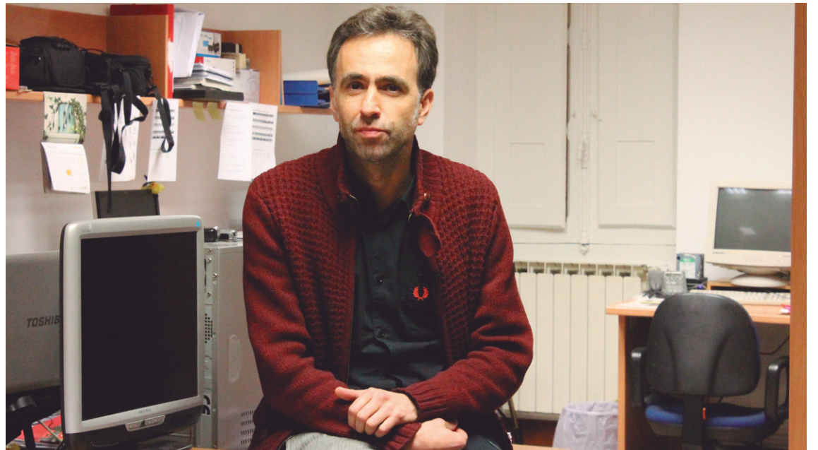
2005ean argitaratu zuen aurreko ipuin bilduma: ‘Neguko zirku’.

Azken batean bakoitzak gure estiloa dugu eta neurri batean haren gatibu ere bagara. Ez dut uste txarra denik. Eta ofizioak hori dauka. Narratiboki planteatutako zaigun arazoari