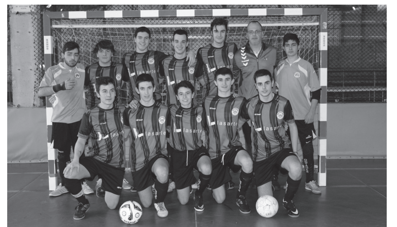
Aurten eratu da Gipuzkoako jubenil mailako Lasarte Kafe Bar Ostadar.

3. Nazionaleko Ostadar Antonio Ostadarrek berriz, 3-1 galdu zuen Presion Break liderraren aurka. Beheko postuetatik ihes egiteko lehian ari dira.