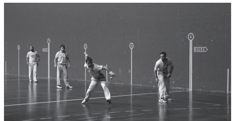
Igo mailako seniorrak ederki aritu ziren Orioren aurka larunbatean.