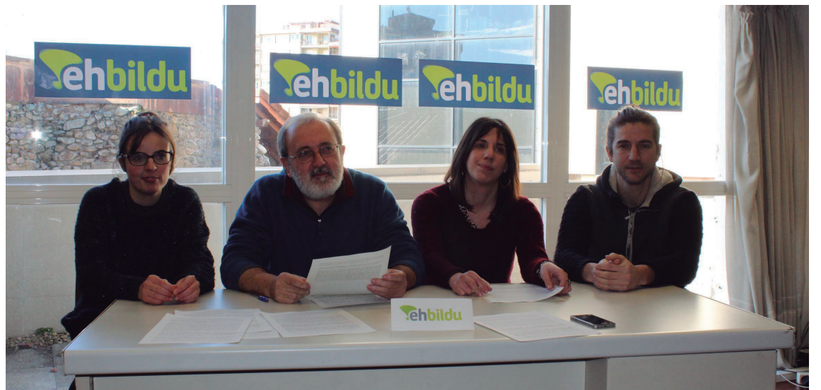
Agerraldia egin zuen EH Bilduko zinegotziek ostegunean, azkeneko udal erabakiak baloratzeko.

"Pribatizazio hori bertan behera uztea izan zen pasaden legealdian hartu genuen lehen erabakietako bat. Konstruktoreak epaitegietara jo zuen konpentsazio baten eske eta, galdu arren, prozedura asko luzatu zen. Ez genuen asmatu arrazoia herritarrei ongi azaltzen beharbada, baina pozik gaude erabakiarekin, garaje horiek herritarren ondasun izaten jarraituko dutelako", aipatu zuen.