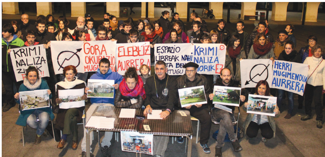
Elebeltz topagunearen kontrako "eraso" salatzeko prentsurrekoa eman zuten Okendo plazan.

Hemendik aurrera eman beharreko urratsak eta hartu-