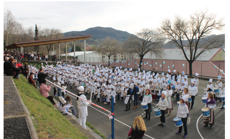
Herriko ikastetxeetako ikasle zein irakasleek, eguraldia lagun zutela, gogotik astindu zituzten danborrak San Sebastian egunaren bezperan.