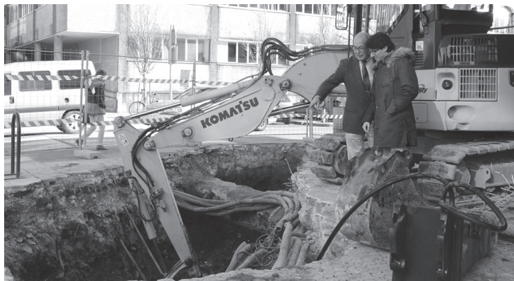
Añarbeko urak enpresako lehendakaria alkateari lanen azalpenak eskaintzen.

Añarbeko Urak-ek Zubietako ponpaleku berriaren eta kiroldegia-aren arteko kolektorea eraikitzen hasi da. Lanek Bekokale, Ola kalean eta Erribera kalean izango dute eragina. Hodi berriak Zubietako HUPera bidaliko ditu herriko urak eta bertatik Loiolako araztegiara. Lan honekin herriaren saneamendu-sistema amaitutzat emango da.