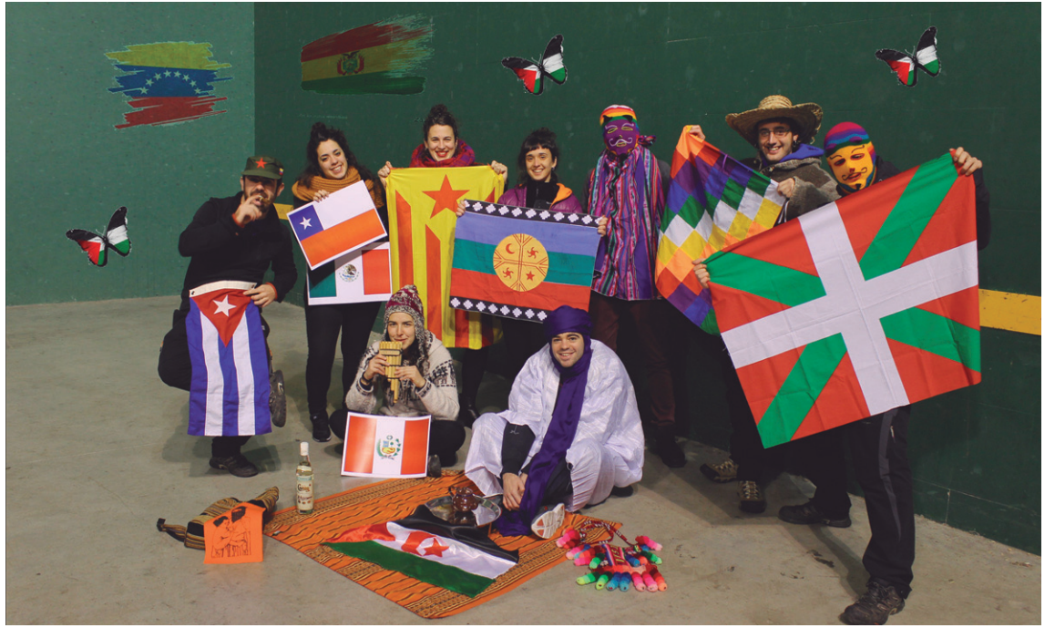
'Lasartetik mundura, mundutik Lasartera' ekimena aditzera emateko ateratako talde argazkia.

zehar zenbait gazte lasarteoriar ibili izanak motibatu du zikloaren antolaketa.