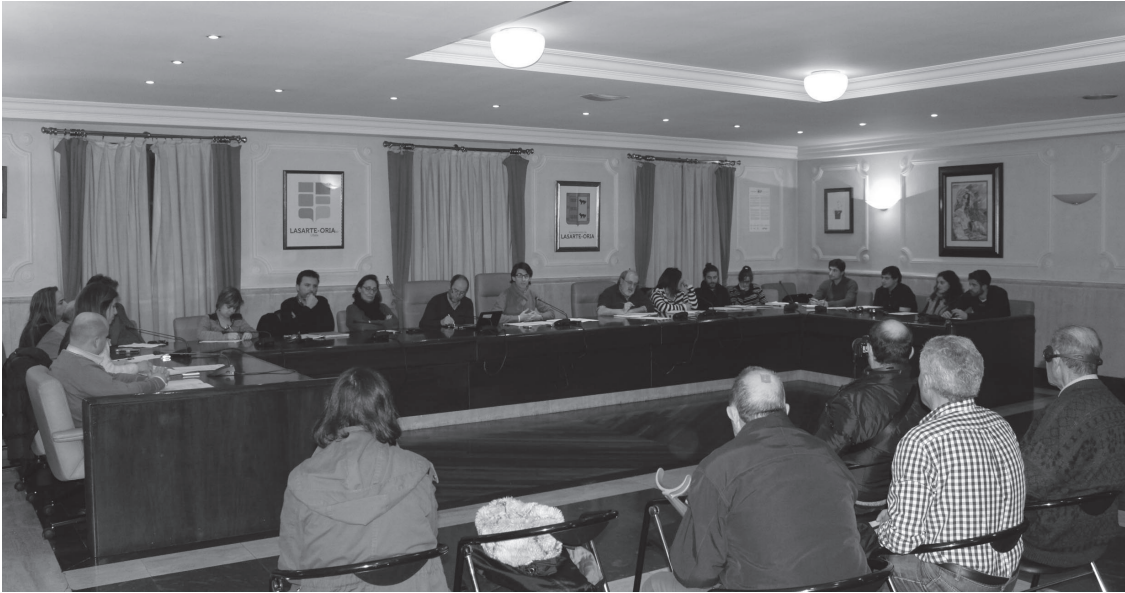
Zenbait herritar gerturatu ziren astearte arratsaldeko ohiko udalbatzarrera.