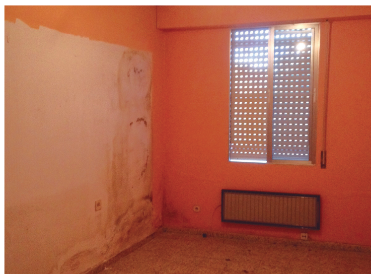
Landaberri-Garaikoetxeako atezaintza etxeke hezetasun arazoa konponduko da. Biyak Bat egoitzan, berriz, kafetegiko komunak egokituko dira. Argazkian, atzean ikusten dira.

Horretarako, hainbat trenkada eraitsi eta estaldura pikatu, iturgintzako instala-