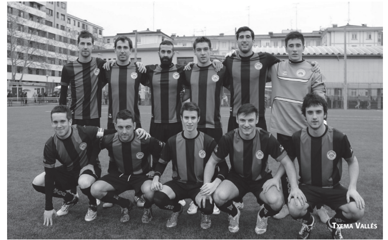
Irudian, pasa den larunbatean Orioko 4-1 mendean hartu zuen hasierako hamaikakoa.

Bihar edukiko dute aukera bolada onari jarraipena emateko, gotorleku bilakatu den Michelingo zelaian. Hain zuzen, Hondarribiaren aurka neurtuko dituzte indarrak, arratsaldeko seietan hasita.