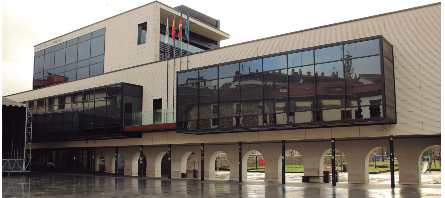
Lasarte-Oriako Udalak Araudi Organiko bat edukiko du haren historian lehenengo aldiz.