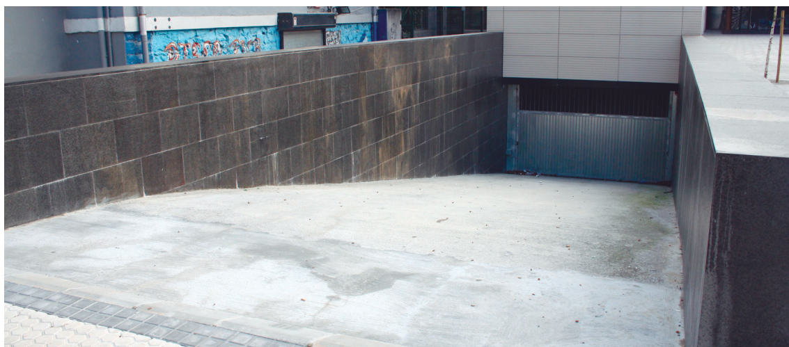
Okendo plaza azpiko 124 garaje-plaza jarriko ditu errentan. Baina ez da leku bakarria izango.

Garaje-plaza alokatzeko interesa duten herritarrek eskaera