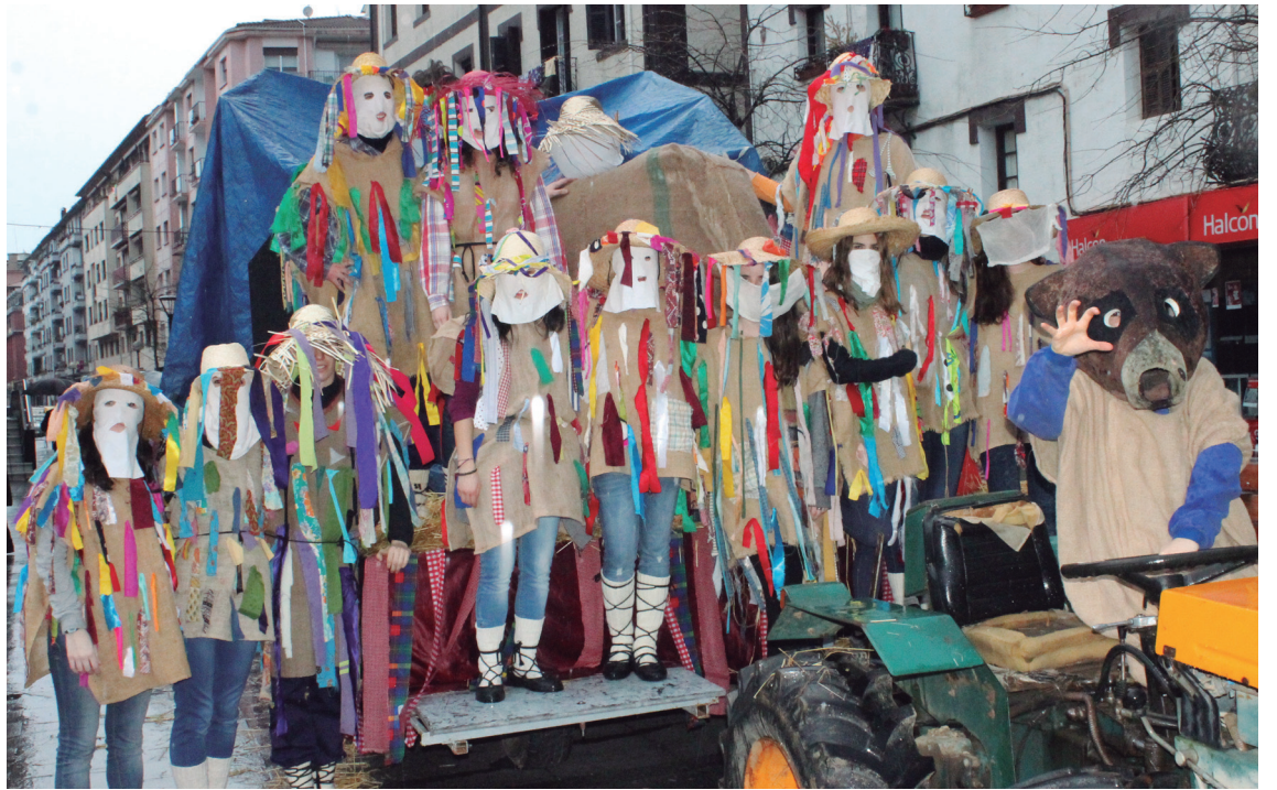
Ttakun kultur elkarteak antolatuta, txantxo jantzia egiteko ikastaroa izango da hurrengo astean.

Mozorro koloretsua Miel Otxinen antzekoa edo zakuz egina Ziripoten antzekoa, edozerk balio du inauterietan.