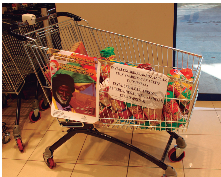
Herriko supermerkatuetan eta ikastetxeetan lekua izango da elikagaiak uzteko.

L asarte-Oriako Saharako Lagunak taldeak Tindoufeko kanpamentuetara otsailean joango den XII. "Piztu itxaropena" Euskal Karabanarekin bat egingo du. Hori dela eta, egun hauetan janari bilketa hasi du taldeak gure herrian.