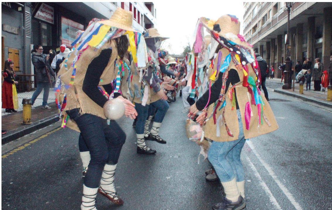
Euskal Inauterietako konpartsak hainbat doinu dantzatzeko dituzte eta hauek entsaiatzeko egunak izango dira 'Plaza dantza' ekimenean.

'Plaza dantza' egitasmoko entsegu irekietara hurbiltzeko ez da inskripziorik egin beharko.