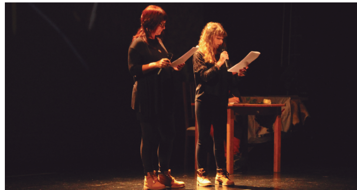
Espetxe borrokei eta kanpoko sostenguari buruzko gogoetak irakurri zituzten