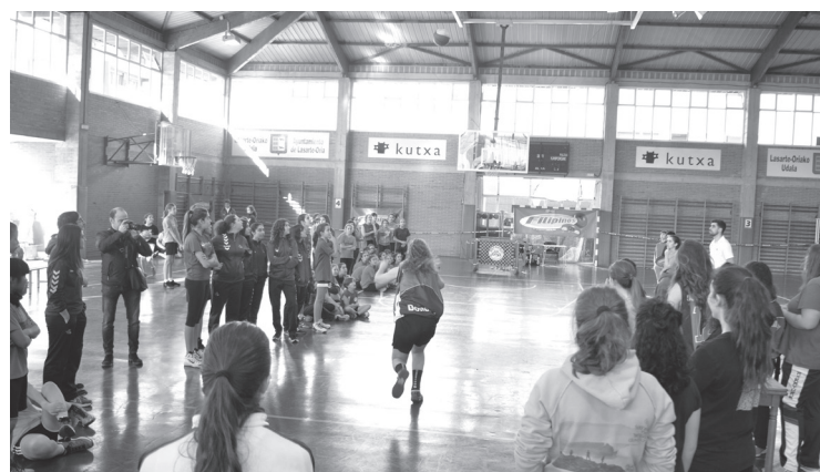
'GBC jaurtiketa' izeneko lehiaketa izan da aurtengo berrikuntzetako bat.

Kategoriaz kategoría, taldeok izan dira aurtengo irabazleak: Alebin nesketan 'Landaneskak'; infantil nesketan 'Menditxu'; infantil mutiletan 'Men in black'; 'Torpedos' izeneko kadete nesketan; kadete mutiletan 'Kuadri'; junior nesketan 'Sokrates'; 'Picaflors' junior mutiletan; 'Moussel' senior nesketan eta, azkenik, 'Durum Team' senior mutiletan. Guztiek oroigarriak jaso zituzten antolatzaileen eskutik.