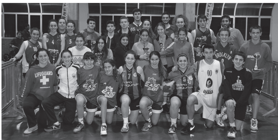
Familia argazkia atera zuten kategoría guztietako txapelketaren lehiaketa amaitu eta gero.

Horrez gain, txapelketako partidu guztien ordutegi eta emaitzak sakeleko telefonoartarako aplikazio baten bitartez jarraitu ahal izan zituzten zale eta kazetariak. Android sistemarako prestatu zuten antolatzaileek; 'Ostadar 3x3 saskibaloia' zuen izena. Jokatu ahala eguneratzen zituzten partidetako emaitzak.