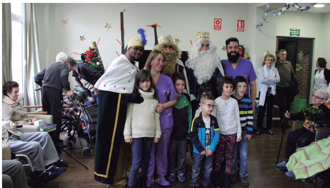
Atsobakar zaharren egoitzara bisita egin zuten egunari Meltxorrek, Gasparrek eta Baltasarrek.