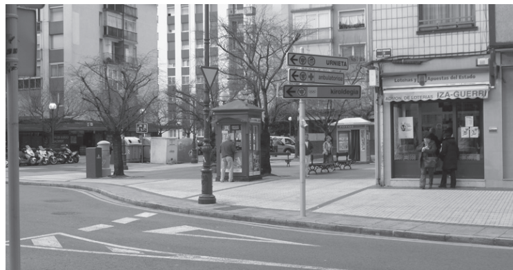
Obra egingo den bidegurutzea, Kale Nagusiaren eta Ola kalearen artekoa

Bestalde, Gizaburuagako Inoxkea Hiri Altzariak SL enpresari 41 paperontziren eskaera egin zaio, urbaniza-