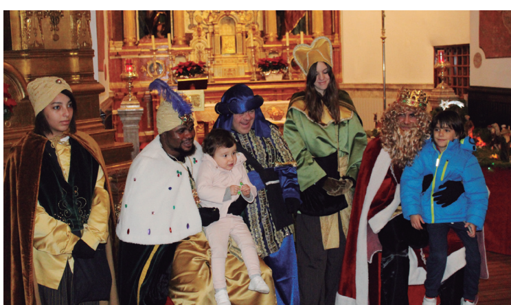
Gaztetxoek eskutitzak jaso eta argazkiak atera zituzten Brigitarren komentuan.