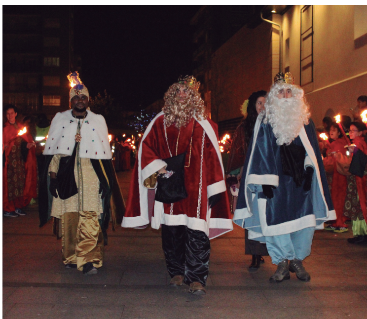
Hiru erregeak, udaletxe berriko balkoira igotzeko bidean.