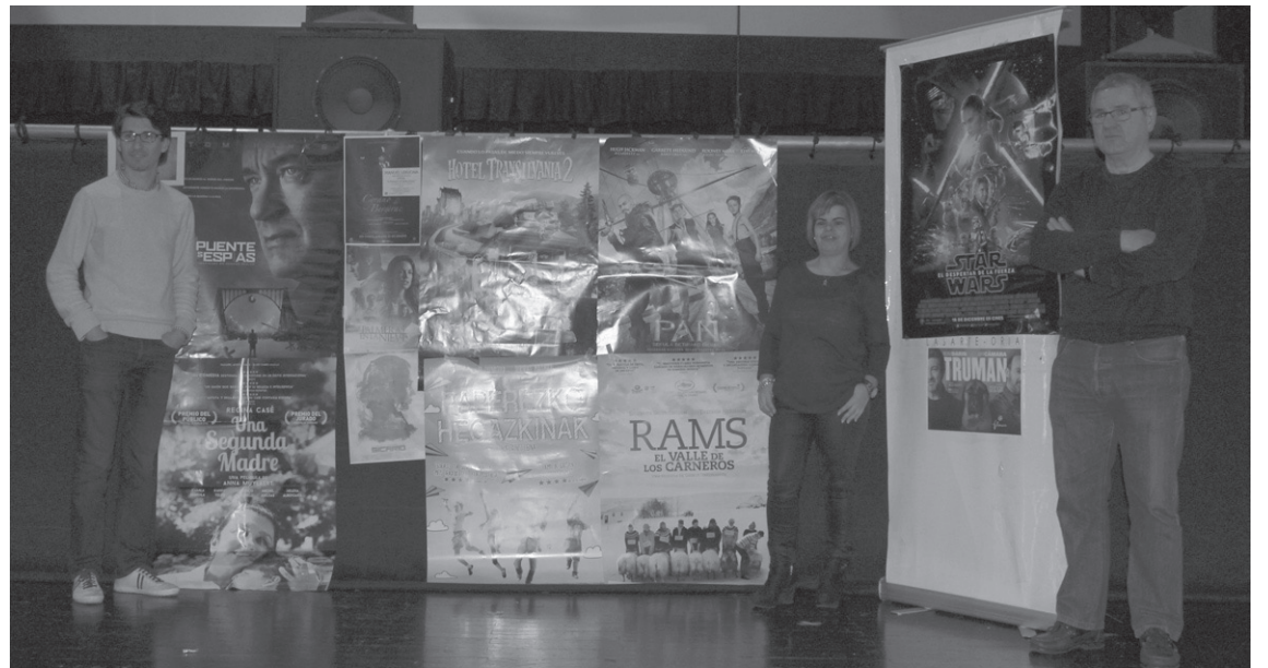
Udal ordezkariak urtarrileko kultur eskaintza aditzera ematen dituzten horma-irudien aurrean.

75 urte beteko ditu Plácido Domingo opera abeslari ospetsuak hilaren 21ean. 'Cyrano de Bergerac' obra antzeztu eta abestuko du Valentziako Palau des Arts antzokian lehen mailako zenbait interpretekin batera. Bi egun beranduago, 23an, Lasarte-Orian ikusteko aukera egongo da, bertsiu digitelean.