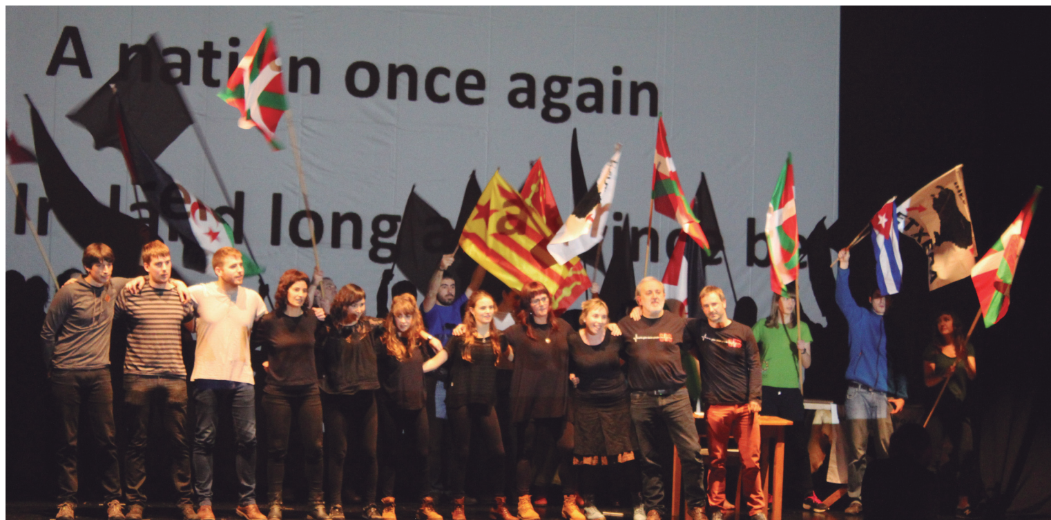
Parte hartzaile guztiak taula gainera igo ziren 'A Nation Once Again' kanta abestera