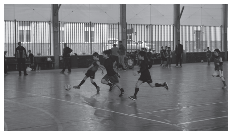
Herriko hainbat gaztetxok hartu dute parte Eguberrietako I. txapelketan.

Sariak txapelketako azken egunean, hilaren 3an banatu zituzten antolatzaileek. Par-