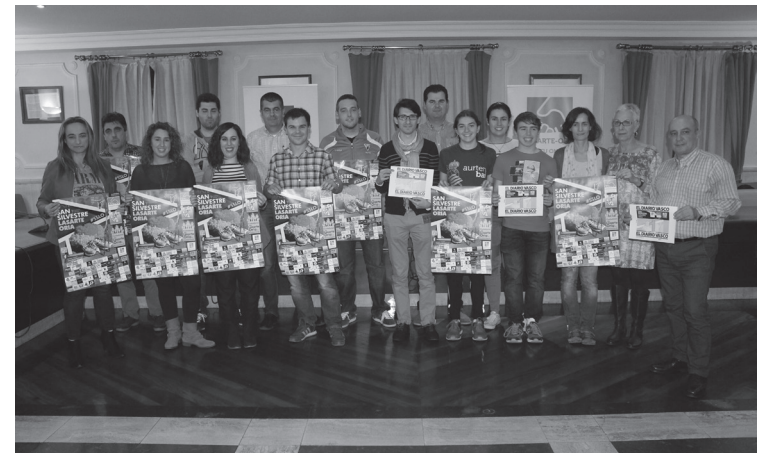
Astearte arratsaldean aurkeztu zuten lasterketa ofizialki, udaletxeko pleno aretoan.

San Silvestre lasterketa- ren I. edizioa jokatu da aurten herrian, hilaren 31n. Antolatzaileen esan- etan, "oso harrera ona" izan du egitasmoak lasarteoriatarren artean: 200 pertsona baino gehiago apuntatu dira jada izena emateko epea ireki eta bizpahiru aste eskas pasa direnean.