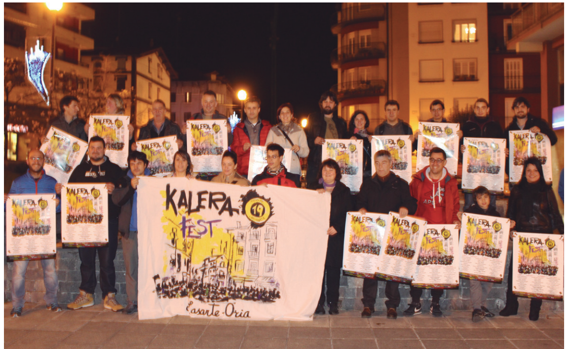
Jaialdiaren antolakuntzan parte hartu duten eragile ezberdinen talde argazkia, aurkezpenean.