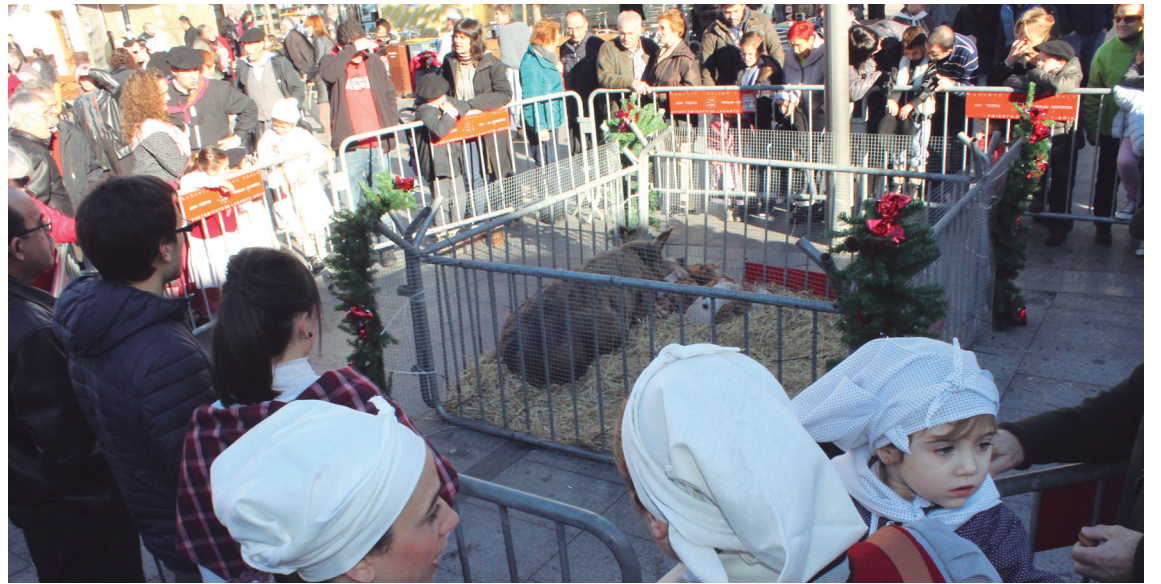
San Tomas azokako txerri eta txerri-kumeek ikusmira handia sortzen dute urtero. Haur zein helduek ikusi nahi dute.

Antolatzaileek ohartarazi dutenez, 4 eta 12 urte arteko