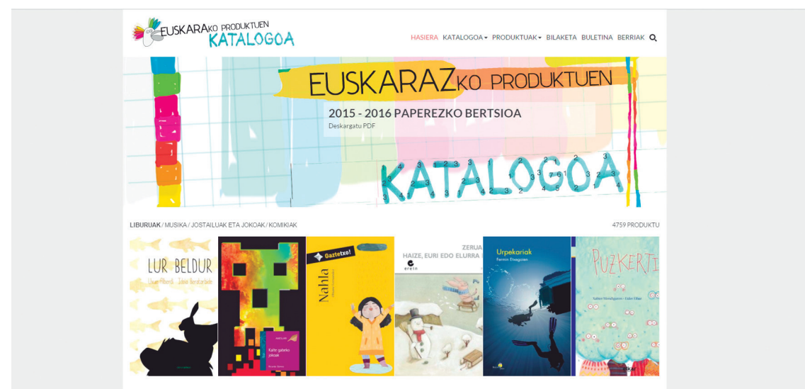
Gabonetako festetan oparitzeko proposak diren hainbat euskarazko eta kalitatezko hainbat produktu aurki daitezke katalogoan.

Gainera, produktu bakoitzaren gutxi gorabeherako prezioa ematen da, eta zen-