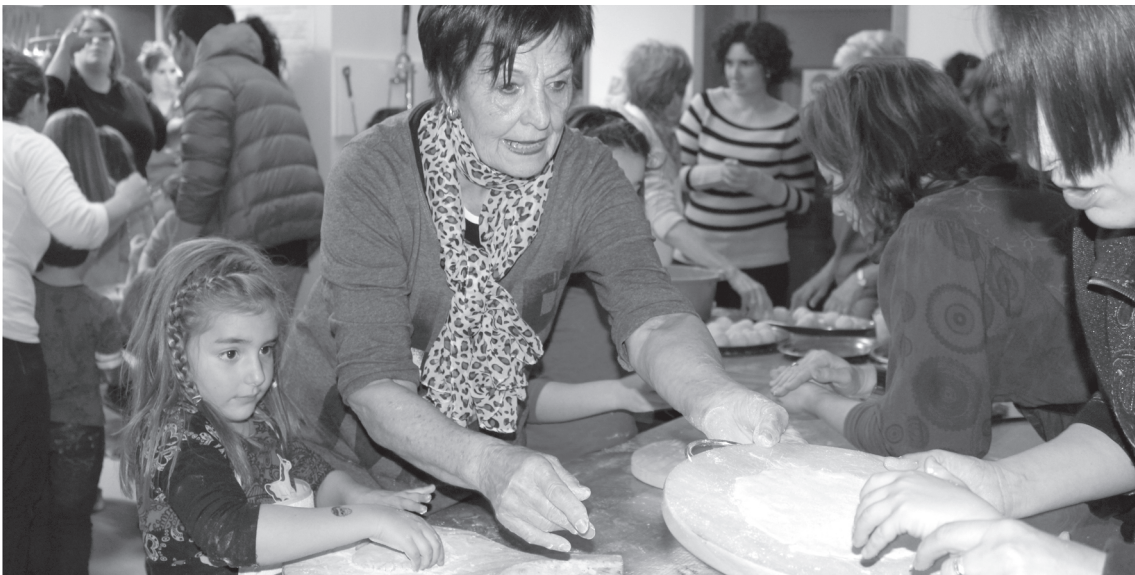
San Tomas azokako talogile taldeko emakumeek taloak nola egin erakutsi zieten Amaraun Kluba eta Solaskide egitasmoak kideei.