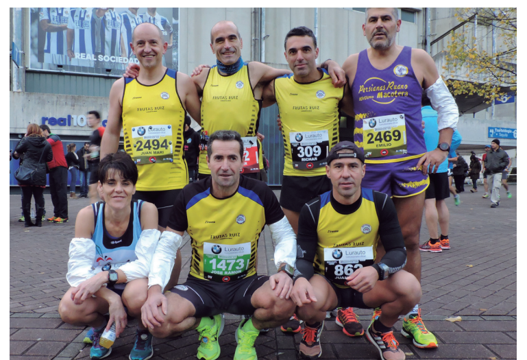
Atzo Maratoian parte hartu zuten herritarren taldeetako bat.