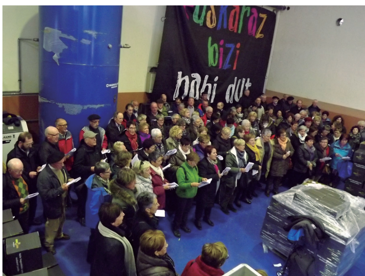
Korueta kideak Ablitasen. Errigorako bountarioei kantari.