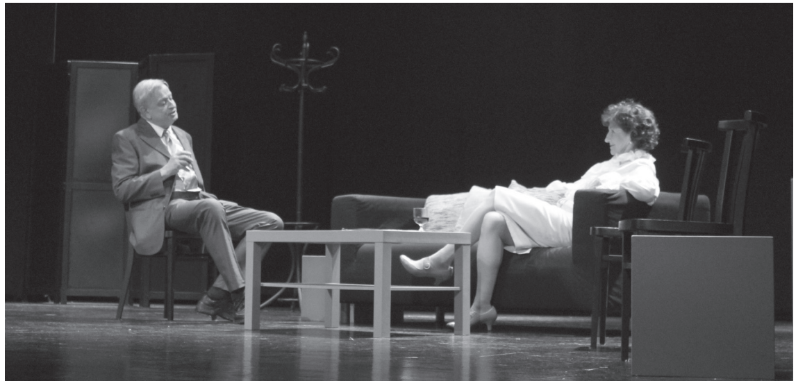
Familia baten egunerokotasuneko gertaerak islatu zituen Donostiako Teatro Ikerketa taldeak 'Komedia espaniar bat' lanean.

Emanaldian ahotsa eta organoaz batera edo organo-