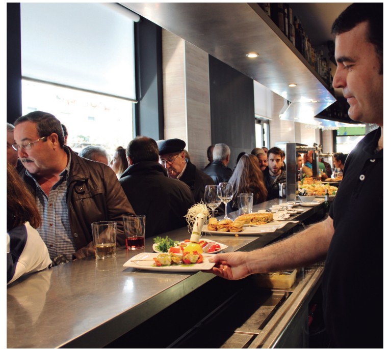
Eguraldia lagun, atzo eguerdian, ibilbideko tabernatan herritar ugari ikusi zen. Ibilbideko pintxoak eta bestelakoak eskatzen zituzten herritarrek.