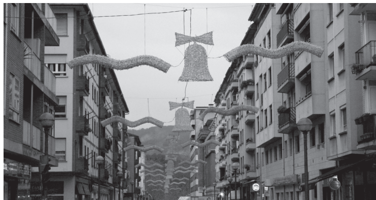
Geltoki kalean edo herriko beste puntu batzuetan dagoeneko jarrita daude argiak.

Udalak adierazi duenez, adostutako aurrekontuari esker, gure herriko kale eta auzo gehiagotara eraman ahalko da argiztapen hori,