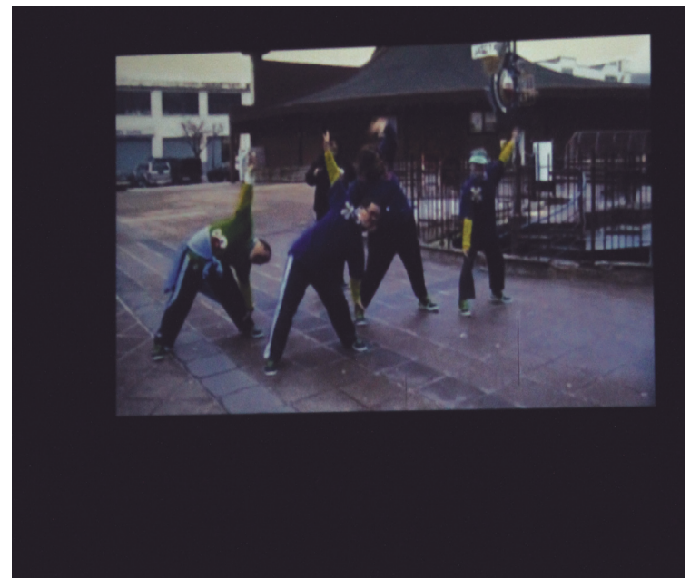
Korrika egunean beroketak ederki egin zituztela ikusi ahal izan zen bideoetako batean.