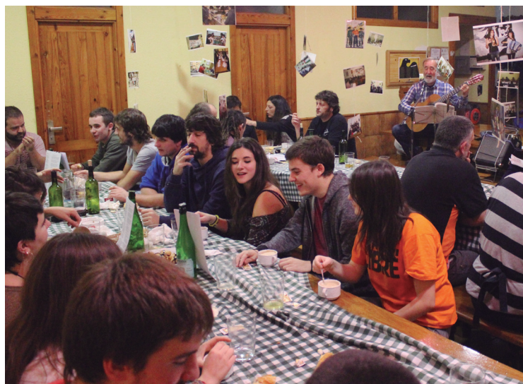
Erakusketa, bazkaria, kantua, musa... omenaldian ekintza ezberdinak izan ziren.