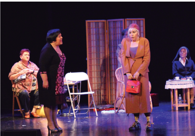
'9 mosaiko infinitu' antzezlanak emakumeen arteko harremanak erakutsi zituen.