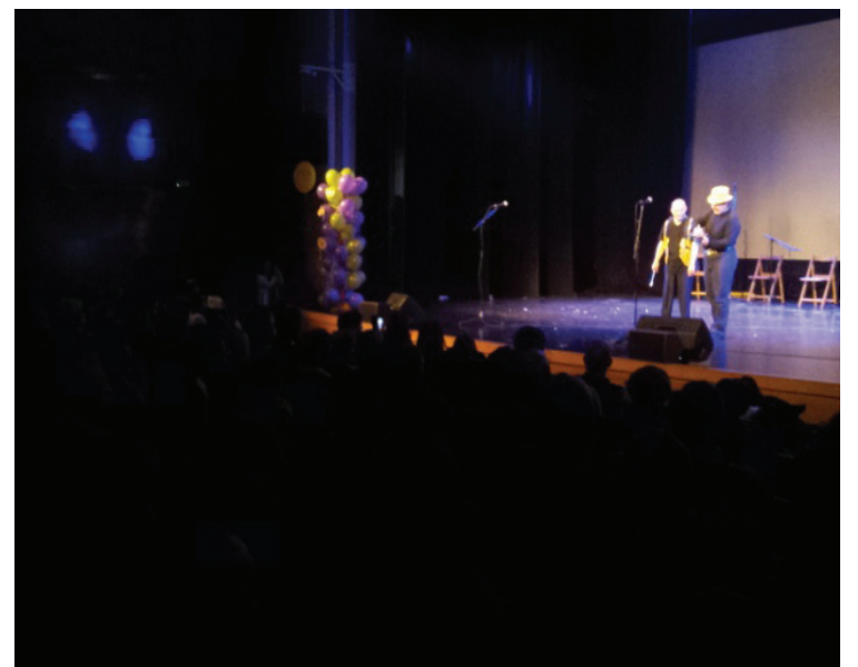
'Erase una vez el cuerpo humano'-ko protagonistak edo magoak izan ziren oholtzan.