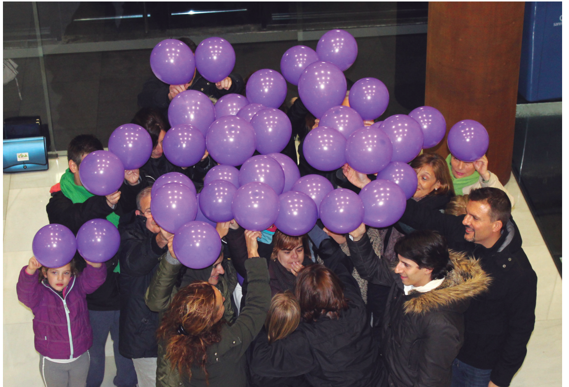
Astezkenean giro zakarra zenez, herritar eta udal ordezkariak udaletxeko harreran osatu zuten puntu morea.