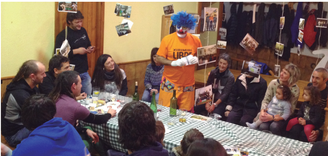
Porrotx pailazoaren emanaldian ederki gozatu zuten haur eta ez hain gazteek.