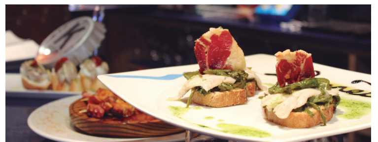
Hamaika tabernetan, pintxo bereziak zituzten. Irudi hauetan dauden pintxoaren antzekoak.

tabernekin aste honetan zehar jakingo dituzte taberna sari-tuen izenak.