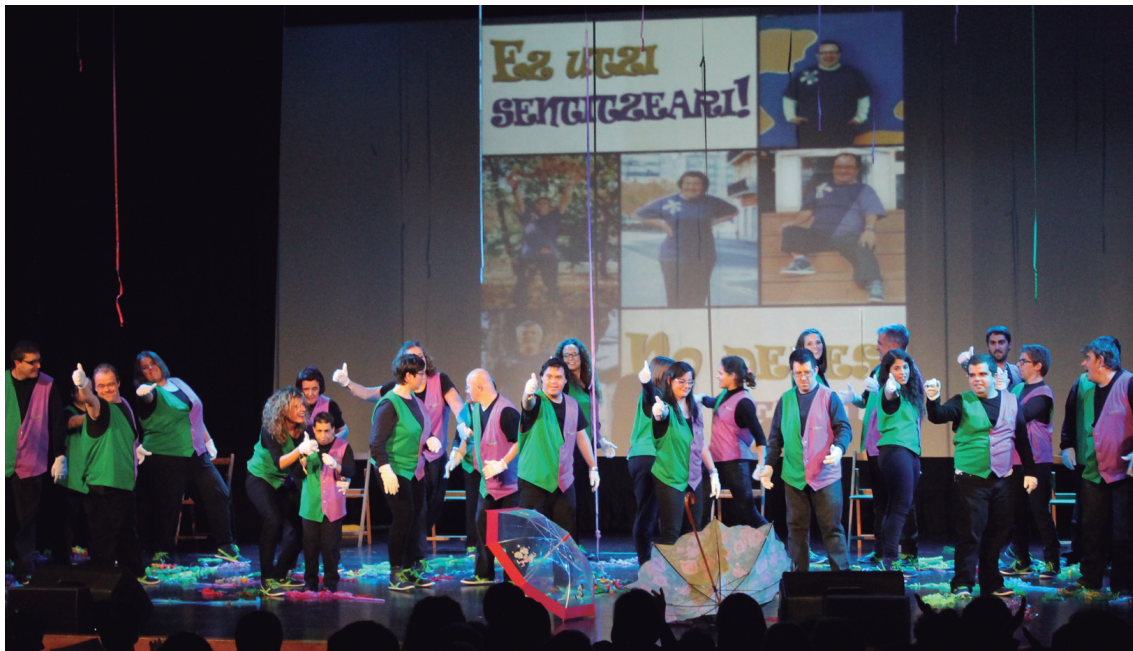
Jalguneko lagunek trebeak direla erakutsi zuten eta gonbita ederra egin zuten emanaldi amaieran: 'Ez utzi sentitzeari!'