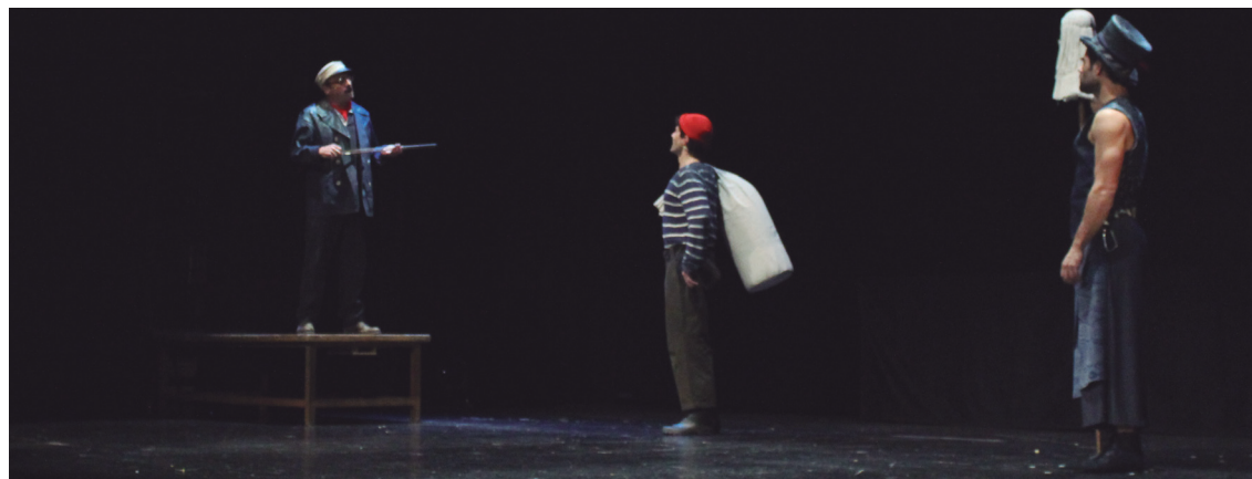
Gorakada konpainiaren eskutik etorri zen 'Moby Dick' gurera

esperientza du taulagainean Gorakada konpainiak. 'Moby Dick' antzezlanaz gain, 'Aladdin', 'Munduaren Itzulia' edo 'Printzea eta Ahatea' obrak