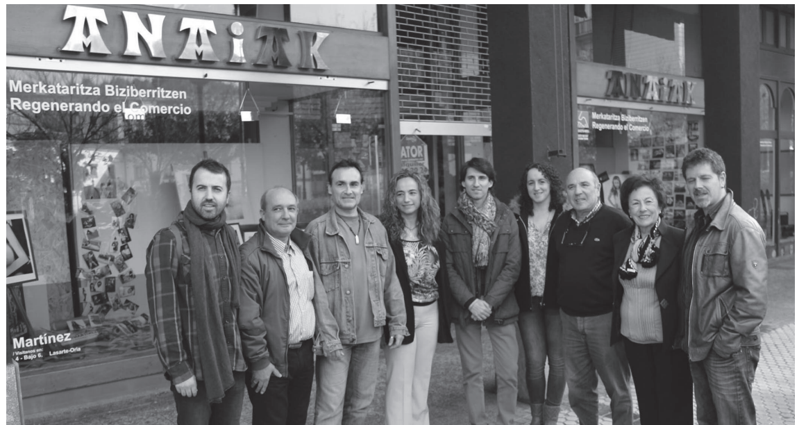
Argazkigintza negozioetako eta Anaiak zenaren jabeek eta udal ordezkariak azaldu zuten Biziberritzen egitasmoaren 2. fasea.

Txuri Urdin taberna Kale Nagusian zegoen garai batean. Orain Santana Informatikak