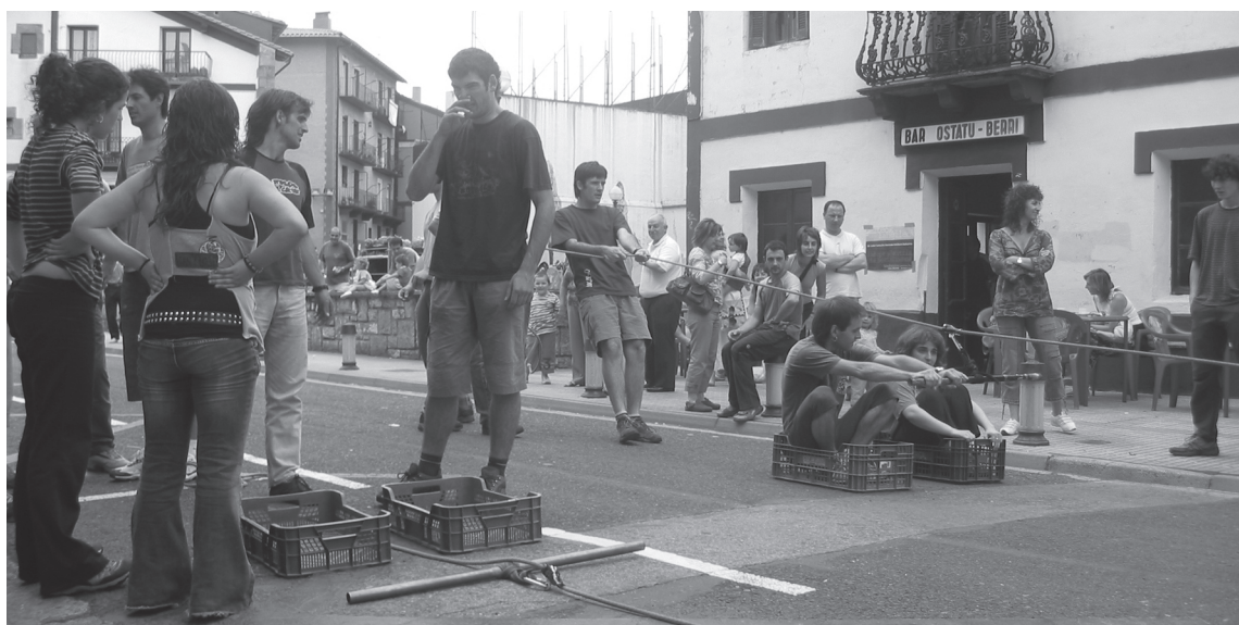
Argazki zaharrak ikusteko parada egongo da erakusketan. 14. urteurrenean egin ziren herri kiroleko hau, adibidez