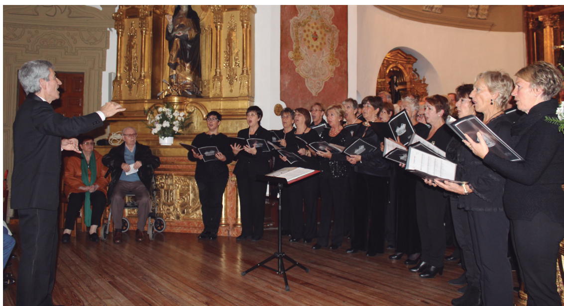
Donostiako Ibaeta Abesbatzak kontzertua eman zuen Brigitarren komentuko kaperan Santa Zezilia egunez.