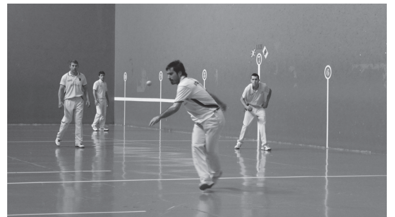
Sendotasuna izan zen garaipenaren gakoa.

Atzaparko pilotariak ostiralean galdu izanagatik ere, Lehen mailan arituko dira hurrengo urtean. Izan ere, beste finalerdian bergararrak eurek baino tanto gutxiago egin zituzten.