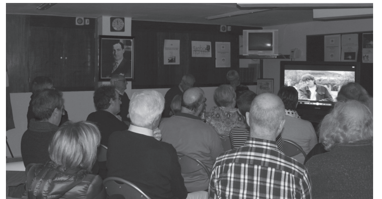
Ganbo Iturri kultur elkarteak antolatutako jardunaldia izan zen.

hainbat film aztertu zituzten. Besteak beste, 'Asier Eta Biok' 'Bakerantza', 'Reconciliación', 'El Reencuentro' eta 'El