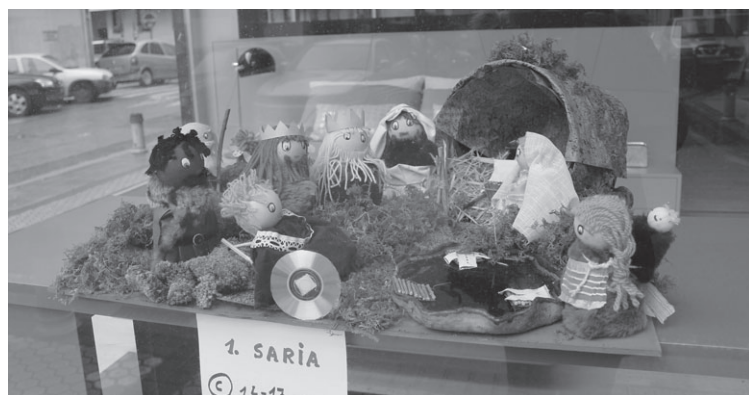
2014ko 14 eta 17 urte bitarteko kategoriako jaiotza saritua

ikusitakoak izango dira, eta irabazleak Muebles Azpeitia denda.