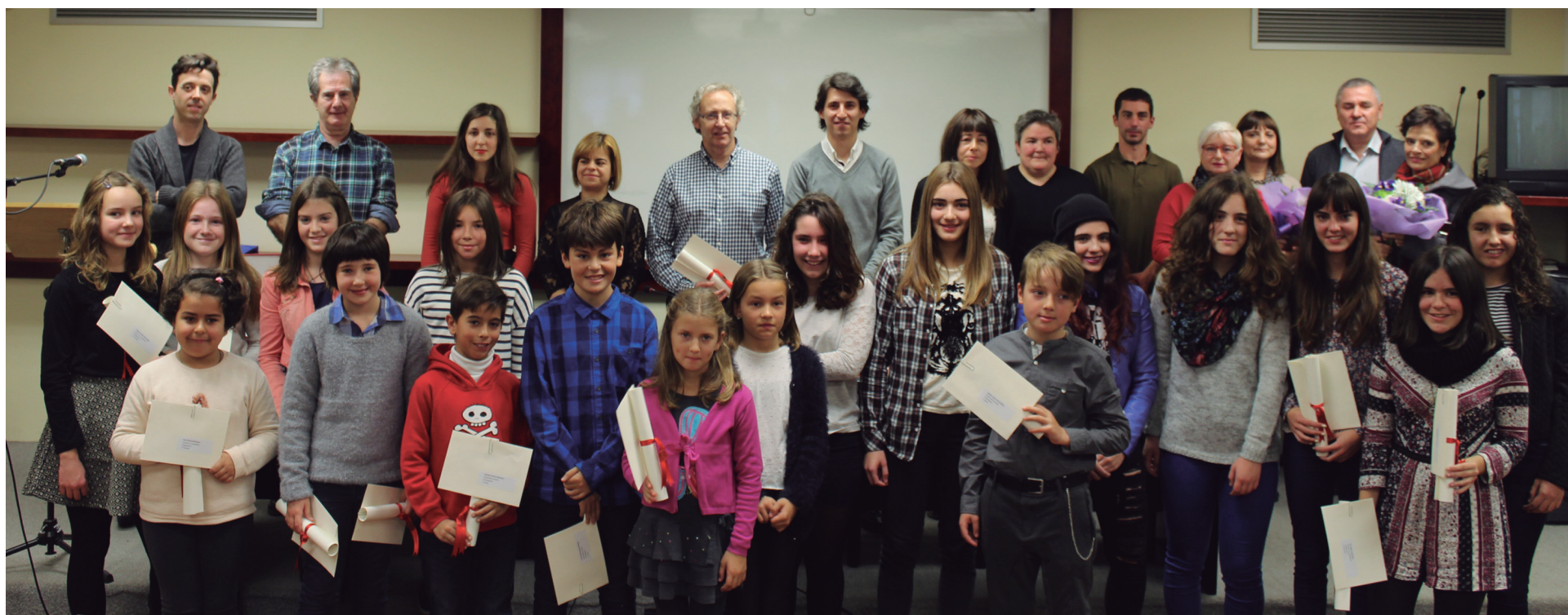
Saridunen, musikarien, omenduen eta antolatzaileen talde argazkia.