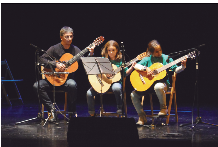
Musika eskolako gaztetxoek urteko lehen kontzertua eskaini zuten ostegunean.