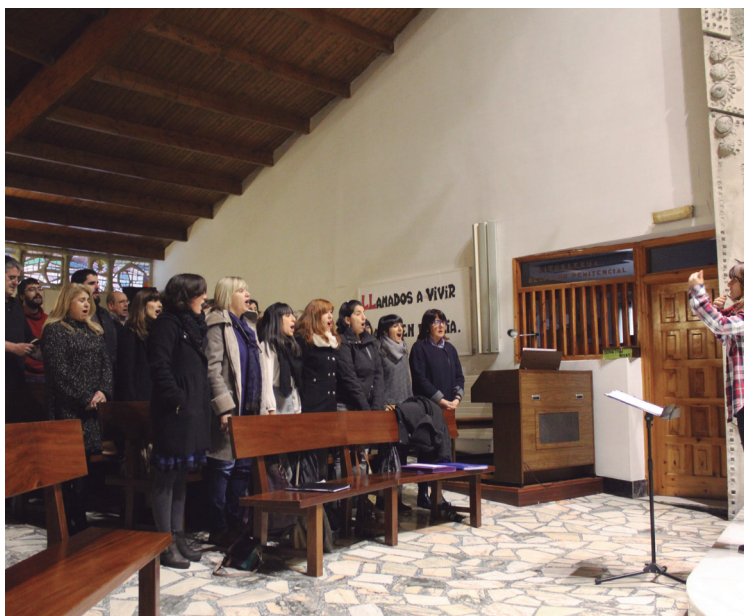
Alboka Abesbatzak Arantzazuko Ama elizako meza girotu zuen.