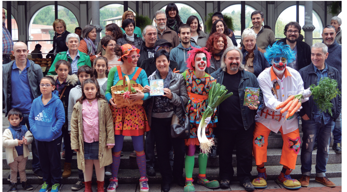
Pirritx, Porrotx eta Marimotots lagunez inguratuta egon ziren bere azken diskoen aurkezpenean.