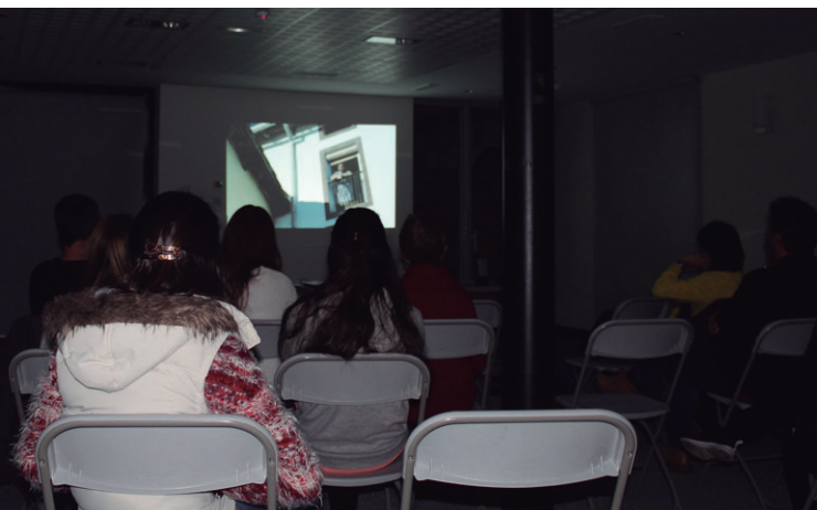
Goiko argazkian hiru gazte 'Diruraren sexu ezkutua' erakusketa ikusten, eta 'Larre Motzean' dokumentalaren proiektzioa behekoan.