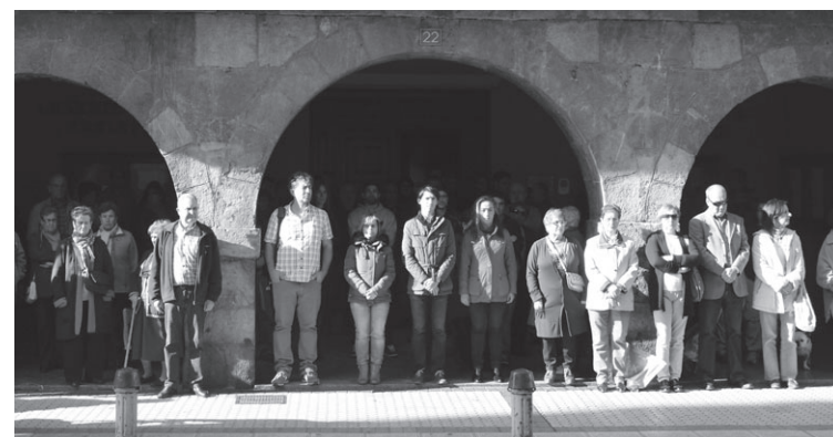
Talde politiko guztiek gaitzetsi zuten Parisko sarraskia.

“Basakeriaren aurrean demokraziarekin, justiziare-