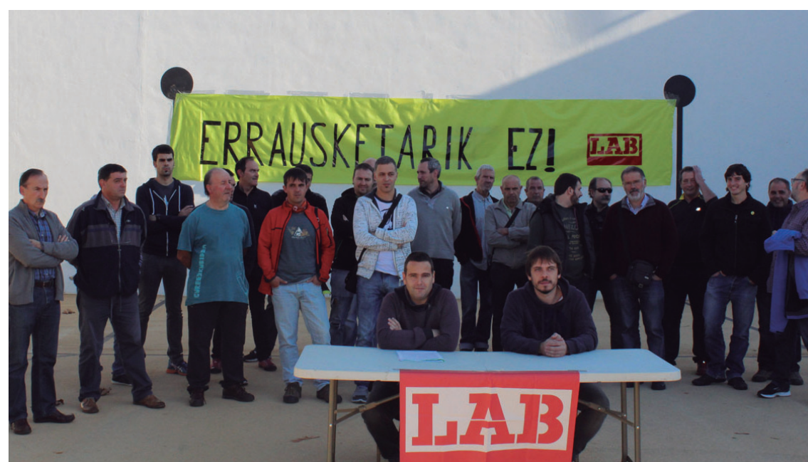
Lasarte-Oriako eta Usurbilgo LAB sindikatuko kideak Zubietan.

Azpimarratu zuten proiektua berreskuratzeko "sekulako gain kostua" izango duela, berriro ere "neurritz kanpoko