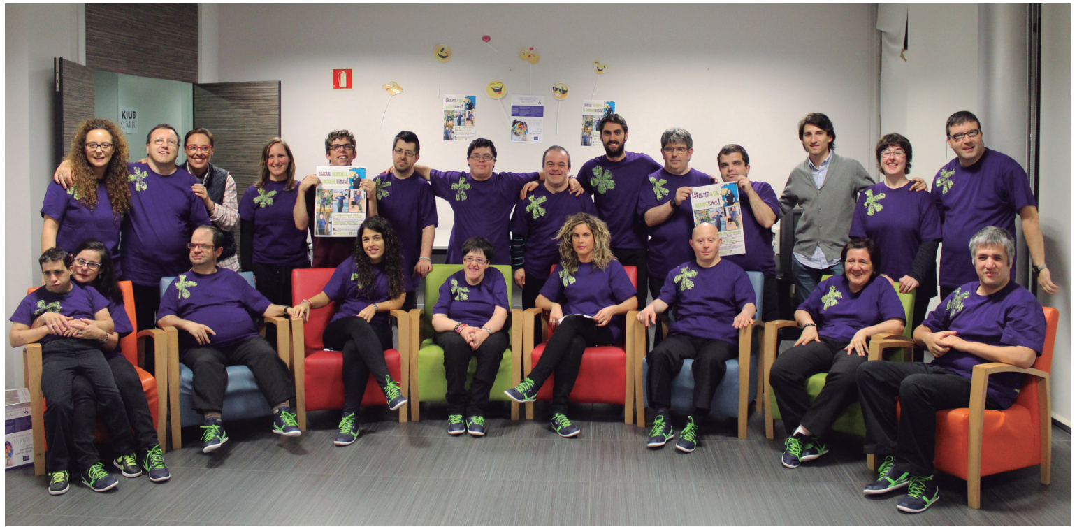
Herritarrek azaroaren 28ko jaialdian parte hartzera animatzen dituzte Jalguneko kideek eta udal ordezkariak.