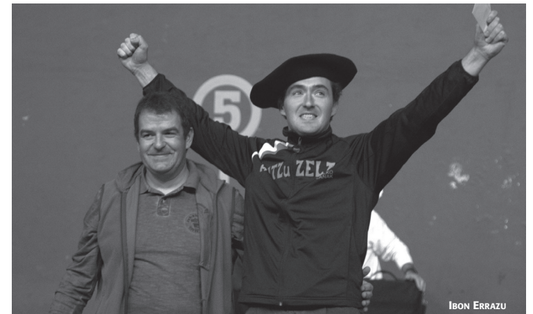
Gogotik ospatu zuen Telleriak igandeko garaipena, Amezketako alkatea alboan zuela.

Bost altxaldi eginak zituen Telleriak 2010ean, eta horiek gairatzeko xedearekin joan zen Amezketara igandean: "Gure lana egitera joan ginen, neurtu genuen zenbat denbora behar izan nuen lehenengo altxaldia egiteko eta hortik aurrera egin nituen gainontzekoak", aipatzen du harri-jantzaileak. Kopurua igotzeko