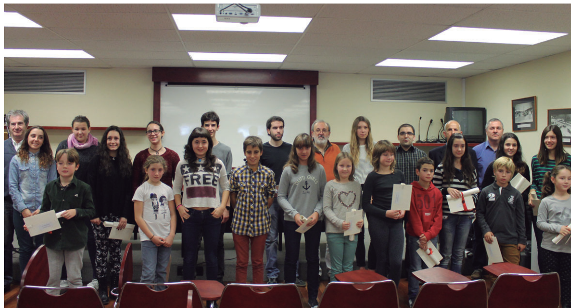
2014ko saridunak Manuel Lekuona kultur etxeko hitzaldi aretoan.

Itxaropentsua da txikiaren kasua. Gaztetxoek kategorian 81 ipuinek hartu dute parte euskarazko lehiaketan. Lehengo urtean soilik 28 izan ziren. Bestalde, B kategorian guztira 72 idazlan gutxiagok