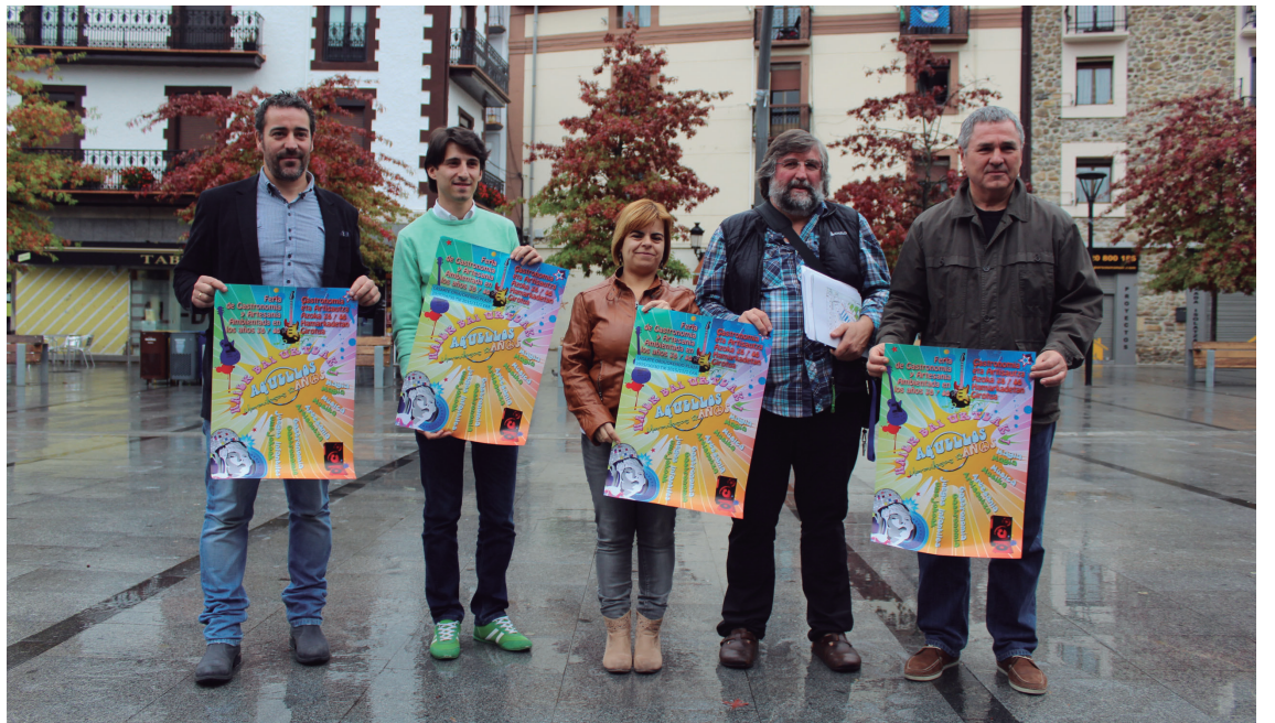
Antolatzaileek gaurtik igande iluntzera bitarteko azokan parte hartzeri gonbidatu zituzten herritarrek.

Hainbat urte egingo ditu atzera gaur Lasarte-Oriak, 70. eta 80. hamarkadetan girotutako 'Hippy azoka' inauguratzearekin batera. Udaleko Kultura sailak eta Bacan enpresak antolatu dute elkarlanean, eta igande iluntzera arte hamaika ekintza prestatu dituzte. Era berean, zenbait probintziatik elikadura zein artisautza alorretako 34 postu jarriko dituzte Okendo plazan, eta garaiko pelikula ospetsuenetako bi proiektatuko dituzte: 'ET' eta 'Los Goonies', gaur eta bihar iluntzean, plazan bertan.