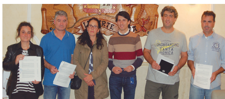
Udal eta ikastetxeetako Guraso Elkartetako ordezkariak hitzarmena sinatu ostean.

Ikastetxeek konpromisoa hartzen dute Udalak eskola