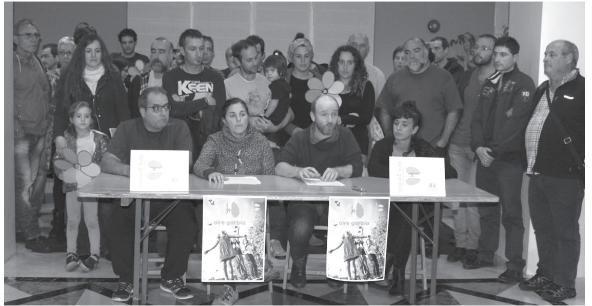
Aire Garbia plataformako kideek asteartean egin zuten aurkezpen ekitaldia.

Batez ere, proiektuaren bideragarritasuna bermatzeko "legezko" zer egingo ote duten galdetzen dute. "Legezkoa izango da kutsadura indizea... Legezkoa izango dira, beraz, kutsadura horrek sortuko dituen gaixotasunak eta horien inzidentziak ere... eta tragedia gertatzen denean, legeak agintzen ziena bete dela esango dute, Aldundiak eta Aldundian proiektuaren alde egin duten gizon-emakume horiek beraiek ez dutela erantzukizunik, dena legearen barruan egin zela, ezinezkoa zela natura kontrolatzea, ezin zela aurreikusi, tragedia saihestezina zela... inpunita-