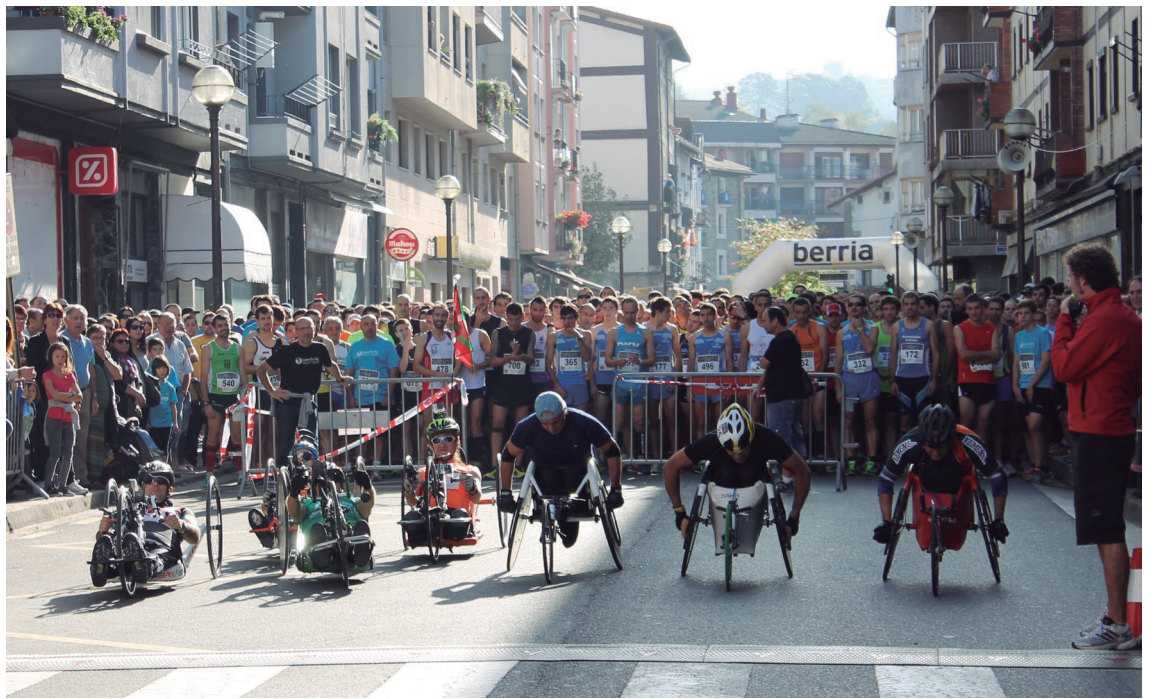
Lasterketa 10:30ean abiatuko da ohiko lekutik, bi minutu lehenago aterako dira gurpildun aulkiko lasterkariak.