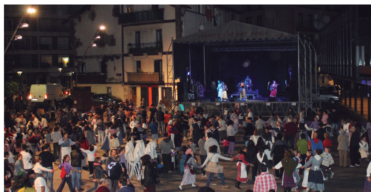
Jai giroa erromeria doinuekin amaitu zen Okendo plazan.