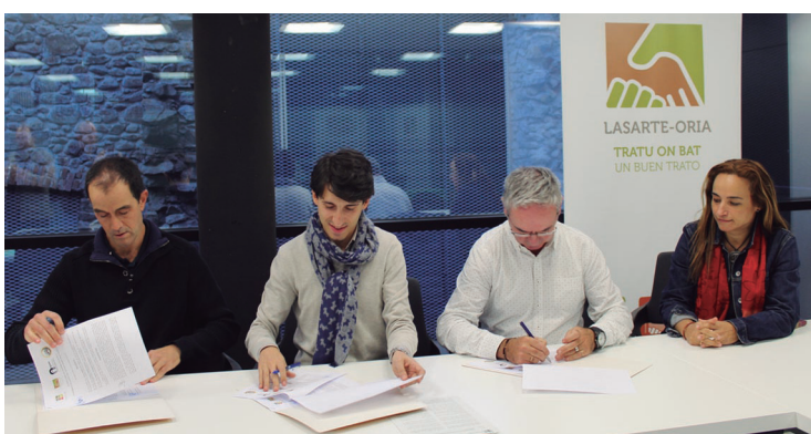
Udala, Ostadar eta Aterpeako ordezkariak sinatu zuten elkarlana.

Bigarren hitzarmen batean sinatu da udala, Aterpea eta Ostadarren arteko elkarlana. Honetan lankidetzat jasotzen