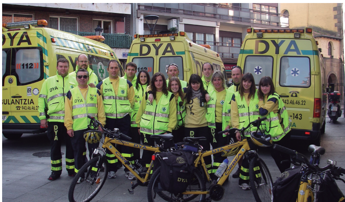
Hamabost pertsona inguru aritzen dira krosaren egunean lanean, bizpahiru anbulantzia eta bizikletekin.

Egun egoitzarrik ez duen arren, 2016ko abenduan 30 urte beteko dira Lasarte-Oriako DYA sortu zenetik