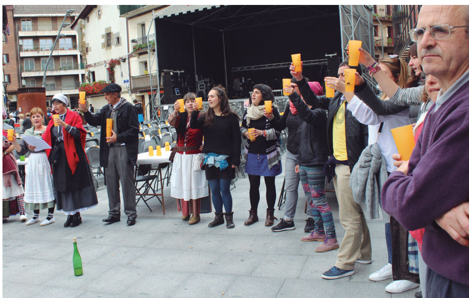
Okendo plazan sagardoarekin topa egin zuten herritar eta euskaltzaleek.