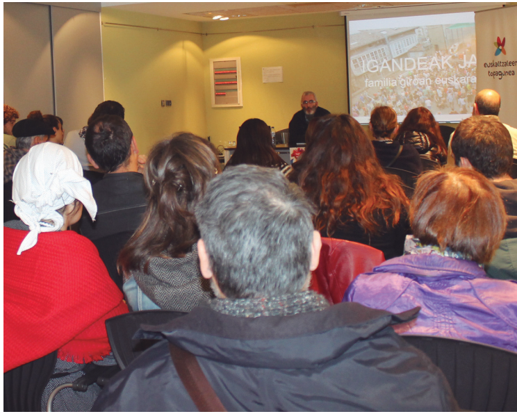
Euskara elkarten Truke Gunea izan zen Villa Mirentxun.