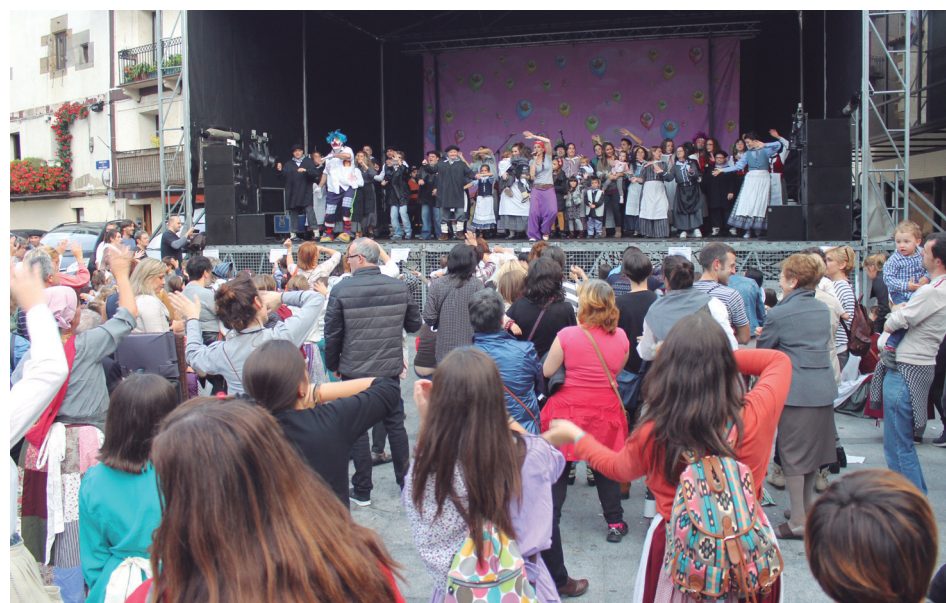
Porrotx,Ane eta Piratek Okendo plaza dantzan jarri zuten. Hainbat elkarte igo ziren oholtzara.

lehena. Nahikoa lan izan zuen harria nola eutsi asmatzen baina 5 minututan, 4 altxaldi egin zizkion herriko harri kuttunari. Josebak hartu zion lekukoa. Honek lehenengo urtean 7 altxaldi egin zizkion, iaz 6 eta aurtengoan soilik 2rekin konformatu behar izan du. Asko sufrituta hainbat saiakera eginda ere, ezin izan zuen Lasarte-Oriako harria menderatu.