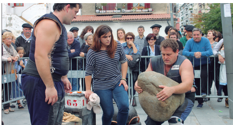
Okerra harriaren errekorra ezin izan zuten hautsi Ostolaza eta Galarragak.