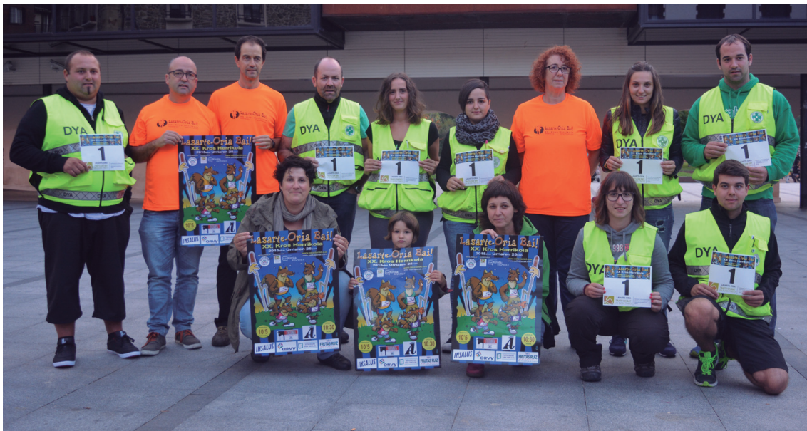
Lasterketaren 20 ediziotako bakoitzean aritu dira laguntzen DYAko kideak; Ostadarrek omendu egin ditu aurtan.

Bizikleten urteen bikoitzak beteko ditu 2016an herriko DYAko delegazioak, 30 hain zuzen ere. 1986an sortu zen eta urteek aurrera egin ahala hazten eta hazten joan zen. 1991. urtera arte anbulantzia propiorik ez zuten eduki, urte