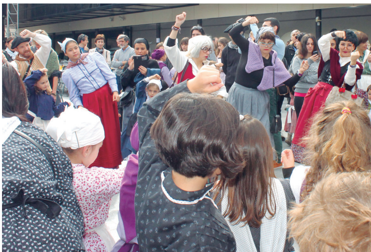
Hiru atso martxoso batu ziren kantu dantza jirara Okendo plazan.