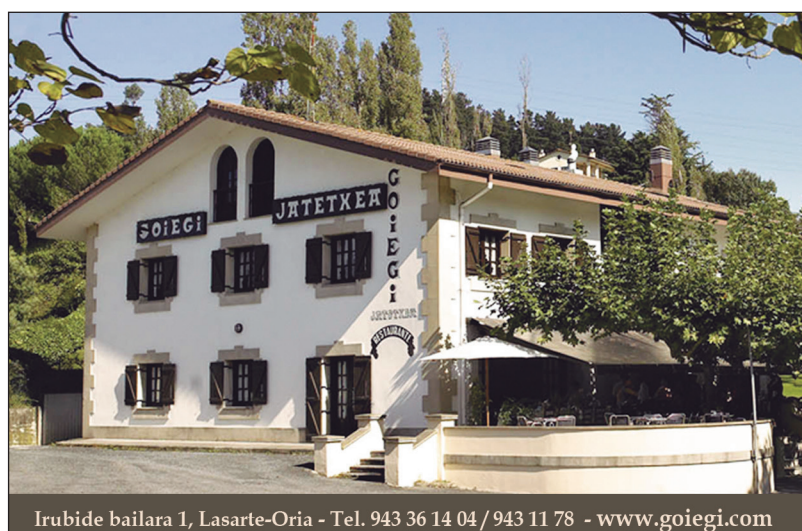
Irubide bailara 1, Lasarte-Oria - Tel. 943 36 14 04 / 943 11 78 - www.goiegi.com