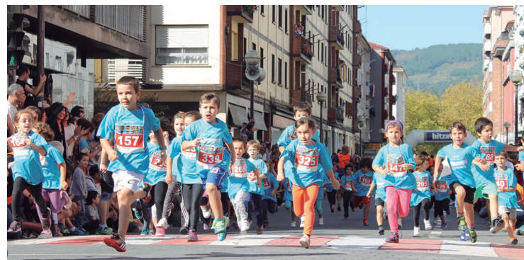
Izena emateko Manuel Lekuona Kultur etxeko kafetegira joan beharko da.

Korrika Festa amaitzen denean, Okendo plazako helmuga ingurura joan beharko dute familiek haurren bila.