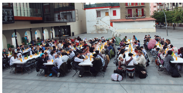
Berrehun bat lagun bildu ziren paella gozoa jatera.

Honela, aurtengo Euskal Jaia eta Topa Egunari agur esan ziztaion Lasarte-Orian. Hurrengo urtean, Atarrabian izango da hitzordua euskaltzaleentzat.