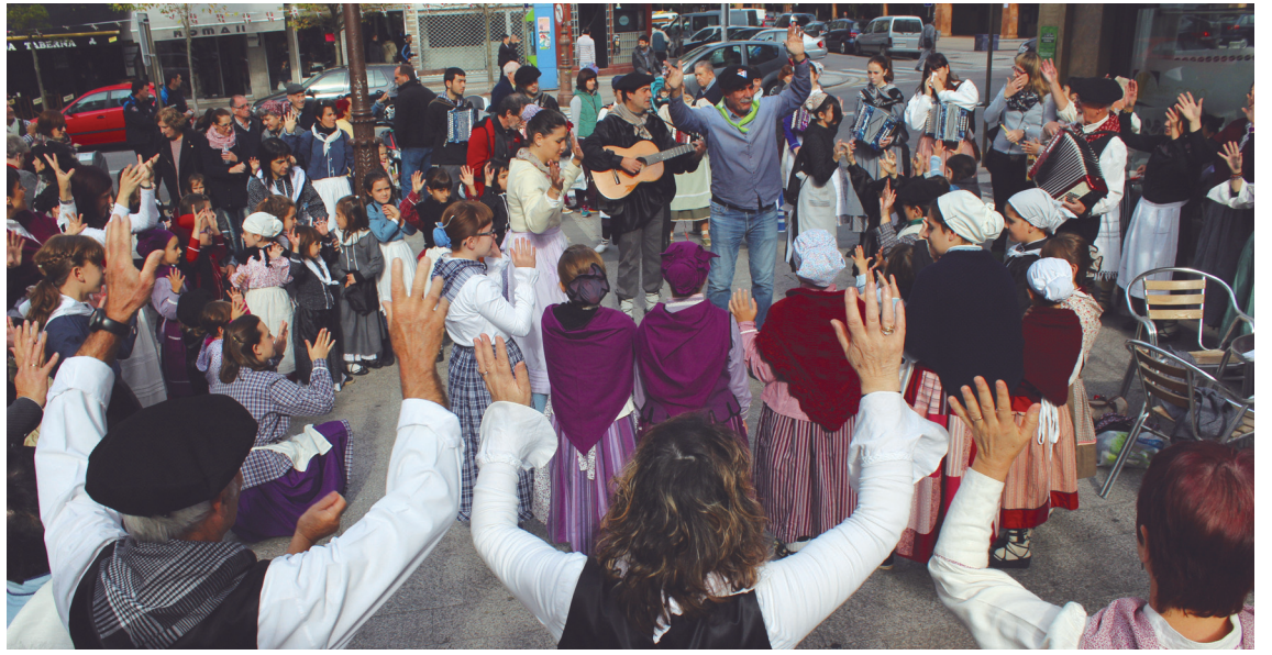
Haur, ezin heldu ederki ibili ziren dantzan eta kantuan herrian zehar.