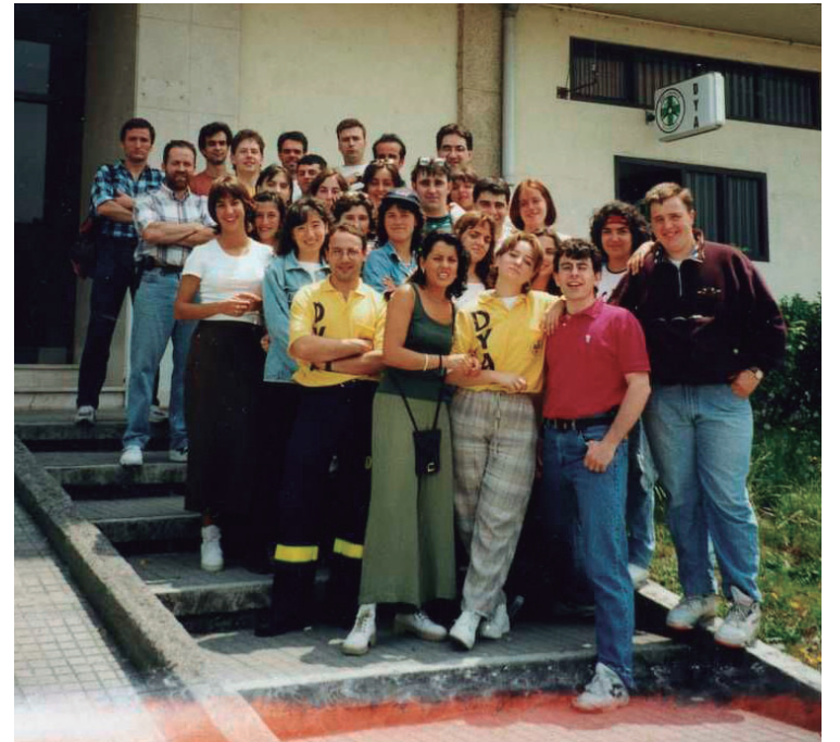
Sortu zenetik 30 urte beteko ditu herriko DYAk 2016ko abenduan.

Jende gehiago aritzen da krosean eta prestatuago dago orokorrean, Gipuzkoako DYA elkarteko buruaren iritziz. Hasierako krosek alderatuz