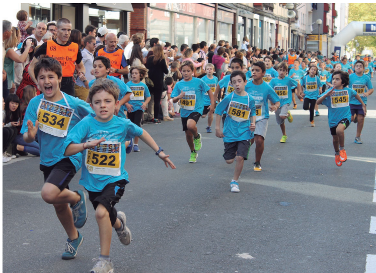
Adinaren arabera distantzia ezberdina egin beharko dute lasterkariak.