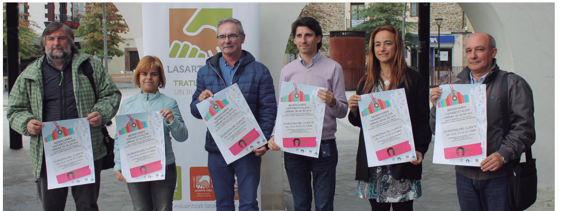
Aurreko astean aurkeztu zuen Aterpeak 'Bezeroaren hamabostaldia'.

gain, 300 euroko txeke bat zozketatuko du Aterpeak. Hastear den kanpaina zehar elkarteko dendetan erosten duten guztiek hartuko dute parte.