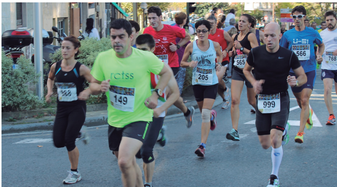
Korrikalariak 10.500 metroko ibilbidea osatu beharko dute herria zeharkatuz.

Aurreko urtean denbora neurtzeko txipa dortsalean integratu zuten lehenengoz, eta aurtun formula bera erabiliko dutela gogoratzen dute antolatzaileek.