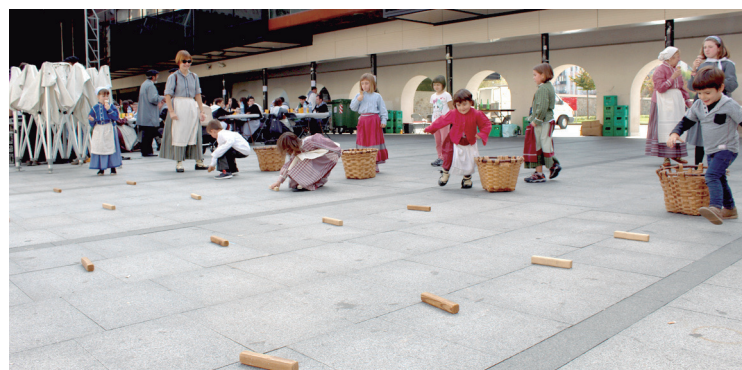
Haurrei zuzendutako, herri-kirolak eta pilota izan ziren bazkal ostean.