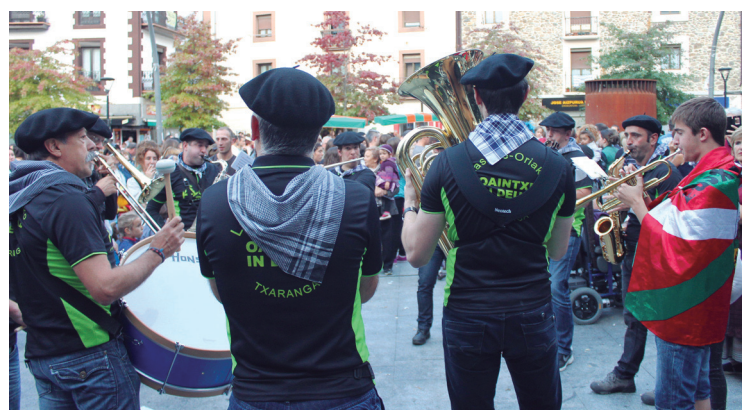
Herriko Oaintxe in deu! txaranga kaleak alaitzen izan zen.