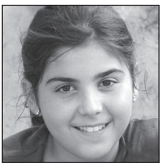
Oihane Zorionak guapetona!!! Hamarkada zoragarria oparitu diguzu... ondo pasa eta primeran ospatu!!!