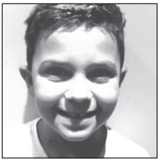
Aner Zorionak zure zazpigarren untebetetzean. Muxu pottolo Malenen partez