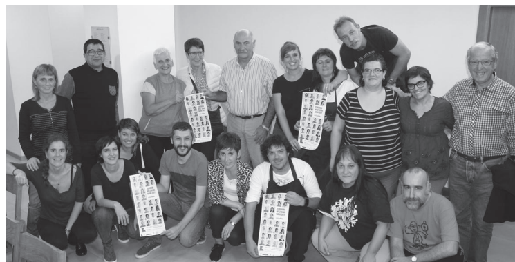
Arrieskalleta elkartean egin zuten afaria.

Solaskide izateko hainbat irizpide finkatu dira. Horrela izanda, euskaltegietan 4. eta 5. mailetan hau da, euskaraz harremanatzeko gai direnek edo maila altuagoa duten ikasleek parte hartu dezakete ekimen honetan. Baina euskaraz hitz egin eta euskaltegietan ez dagoen jendea ere ongi-etorria da. Izan ere, bada