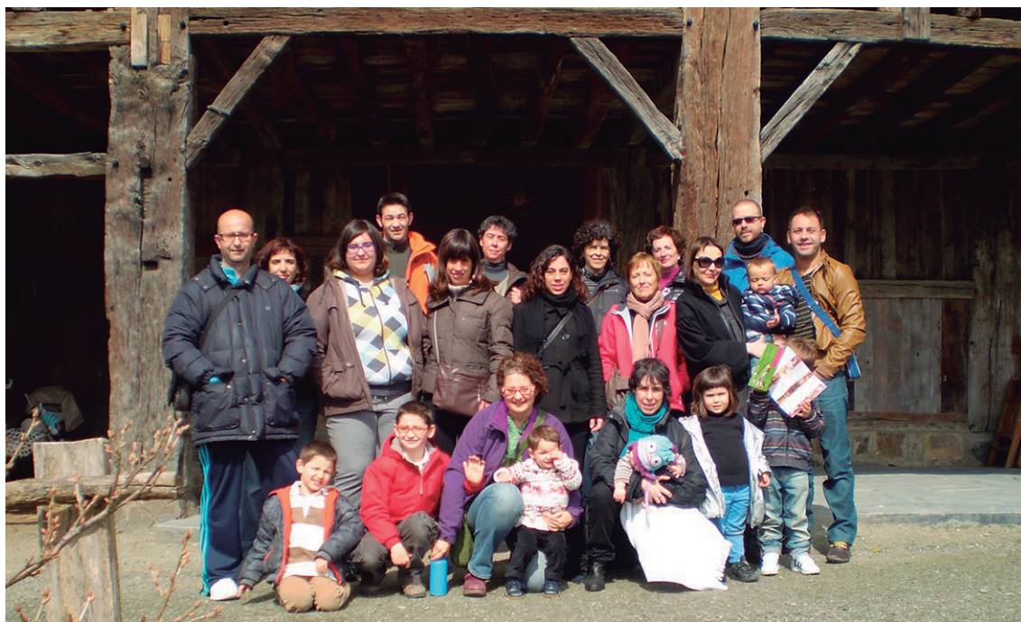
Mintzalagun talde bat, Igartubeiti baserriari eginiko bistan. "Aipamen berezia merezi dute bolondres lanetan jarduten duten lagunek edo euskaldun zaharrek".