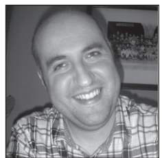
Xabi Zorionak hacker!! Ondo pasa zure egunean!! Ttakuneko lan-kideen partetik.

Zorion agurrak bidaltzeko 943 36 68 58, txintxarri@txintxarri.info edo txintxarri.eus web orrialdeko formularioa erabili dezakezue.