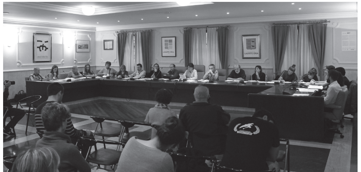
Zenbait herritar gerturatu ziren astearte arratsaldean pleno aretora, udalbatzara zuzenean jarraituz.

EH Bilduren aburuz, epaitegietara joateak "presio politikoa" kenduko lioke gaiari: "Epaileak erabaki dezala, eta bitartean denok lasai. Gainera, Diputazioak ditu irabazte-