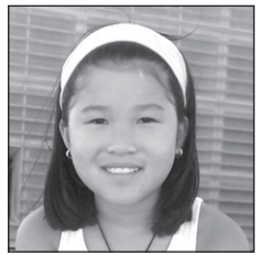
Olaia Zorionak politta!! Hamar muxu erraldoi amona, aita eta amaren partetik.