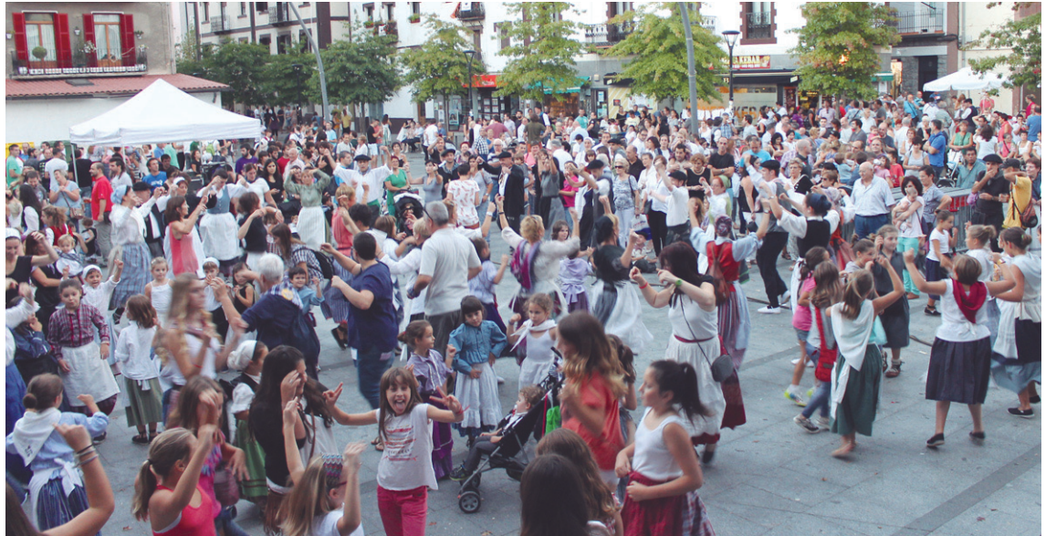
lazko Euskal Jai egunean herritarrak plazara atera ziren eta ederki egin zuten dantza. Aurten ere horrela izatea espero da.

Topa Eguneko ekitaldi nagusia egingo da ostean.