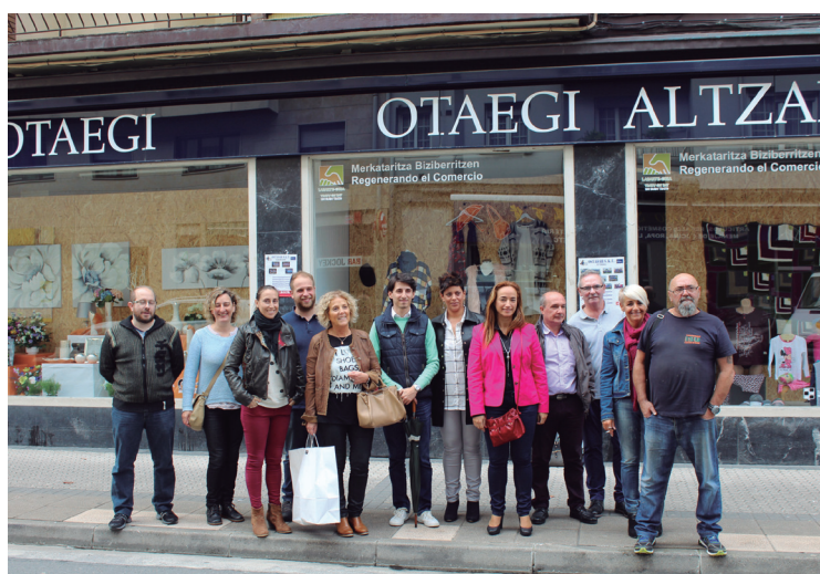
Irudian, ekimenean parte hartzen ari diren dendariak eta Udal ordezkariak.

lako egitasmorik sustatu ez beharko bagenu; komertzioen %100 martxan dagoela esan nahiko luke horrek. Horrela ez denez, gisa honetako ekimenek Lasarte-Oriako merkataritza biziberritu egingo dutela uste dugu", adierazi zuen Ater-