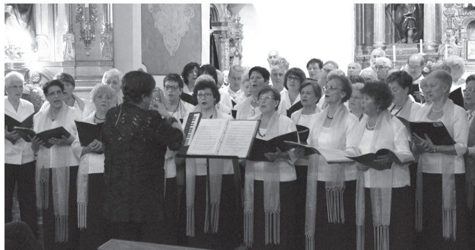
Biyak Bat, Nagusilan eta Xistrak abesbatzen ahotsak entzungai izan ziren astelehenean.