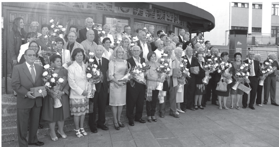
Atzo aurten urrezko ezteiak egiten dituzten bikoteak omendu zituzten Biyak Bat elkartearen.