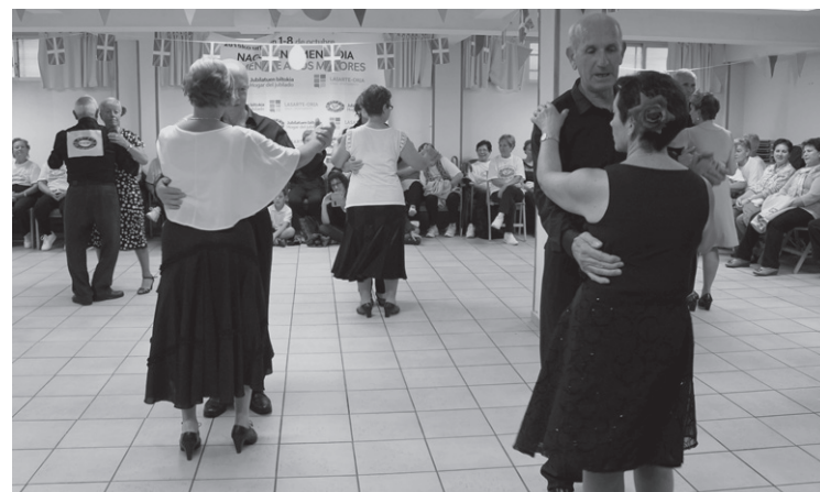
Dantza eta gimnastika taldeek euriagatik egoitzan egin behar izan zuten erakustaldia.