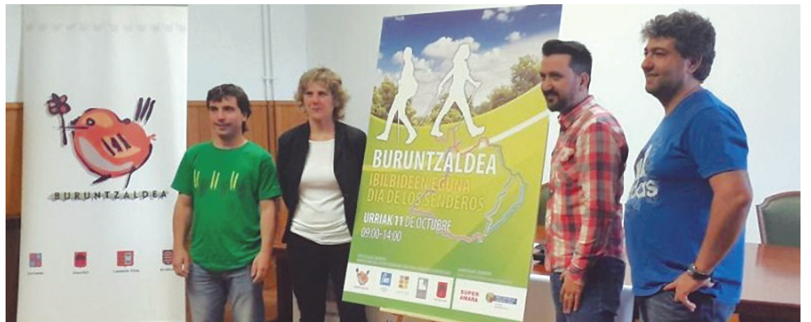
Buruntzaldeko Ibilbideen egunaren aurkezpena.

Aurten gainera, berrikuntza bat dago, Andoain-Lasarte-