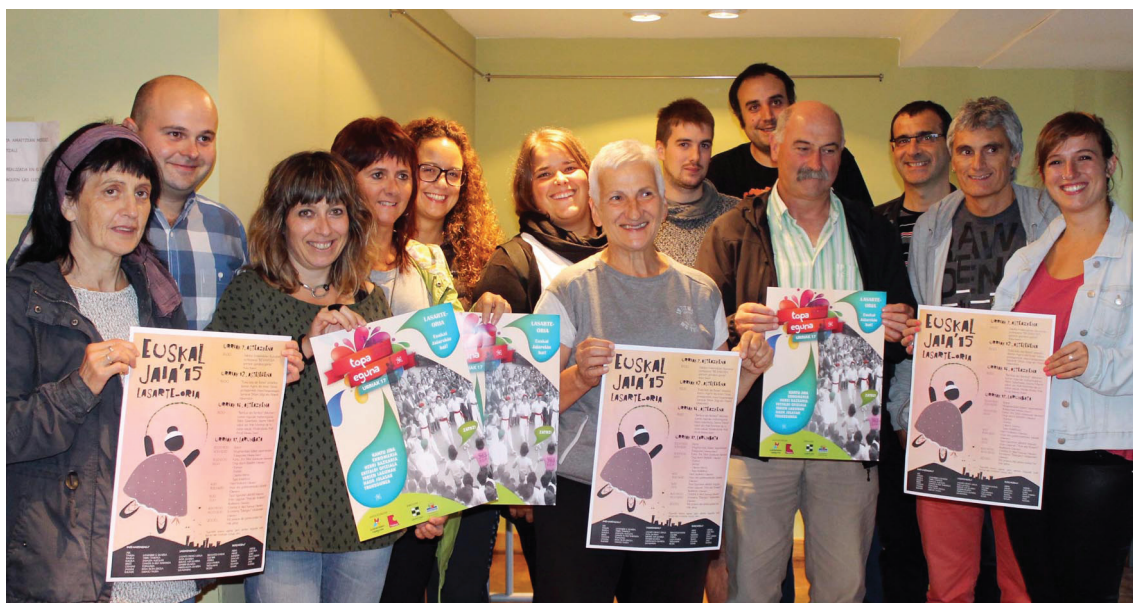
Euskal Jaia egitarauaren baitan hainbat ekintza ere antolatu dira aurretik, hala nola, hitzaldi, antzerki eta mahai ingurua.

Okendo plazara iritsita, ongi etorri ekitaldia ospatuko da. “Jai giroan kantuaz eta