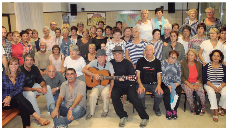
Xumelako kideekin izan ziren aktoreak kantuan.