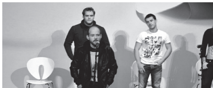
Muñoak laugarren txapelketa izan dela eta, ilusioa berdina ez dela aitortu du.

Horretaz gain, arrapaladan kantatzen ariko balitz bezala sentitu zen bertsolaria "ber-