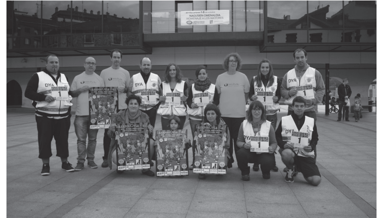
Irudian, DYako laguntzaileak eta Ostadar SKTko hainbat kide aurkezpenean.

Urriaren 25ean jokatu da XX. Lasarte-Oria Bai! Kros herrikoia. Ostadar SKT antolatzaileak bi berrikuntza nagusi iragarri ditu. Batetik, DYako laguntzaileek eramango dute bat zenbakidun dortsala aurten eta, bestetik, Manuel Lekuona kultur etxeko kafetegian eman beharko da izena.