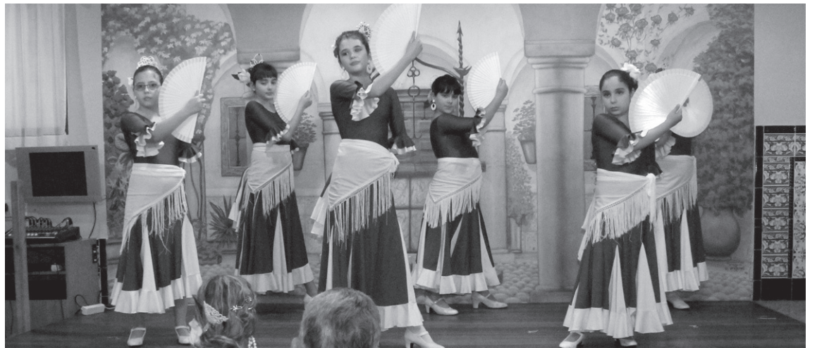
Aste honetan zehar, nagusiki Semblante Andaluz elkarteko dantza eta kantu taldeak izango dira Golf plazako ohoztan.

19:00etan, Zambra taldeak dantza egin eta 20:00etan, Genaro "El Ruiseñor de la Mancha" flamenko-kantariak, "Manolo Badajoz" gitarrarekin lagun duela, emanaldia eskainiko du.