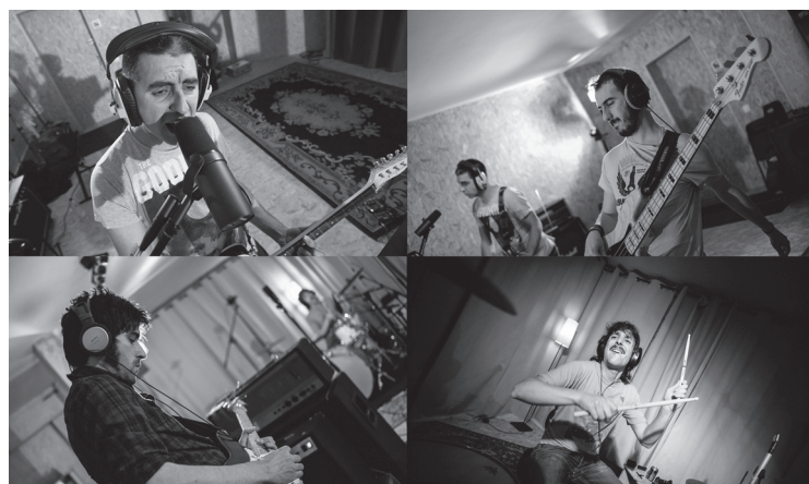
Logroñoko Funny Roman Numbers taldea izan da aurtengo irabazlea.

Oinarriak ezartzen dutenez, formatu komertzialean