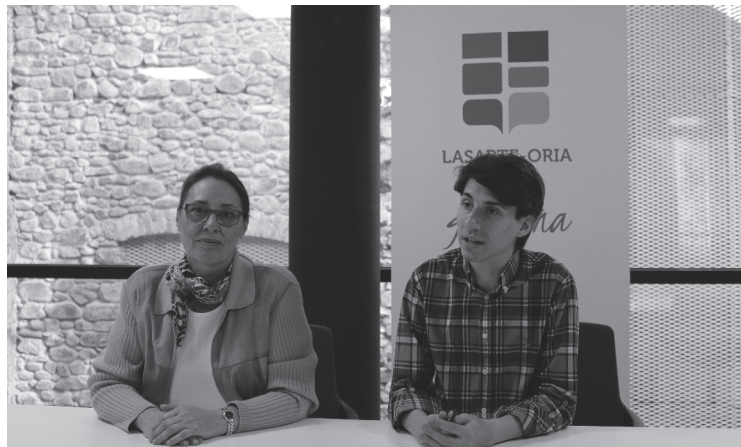
Ikuskaritzaren emaitzak plazaratu zituzten udal ordezkariak pasa den ostegunean.

Transparencia Internacional España erakundeak Lasarte-Oriako Udaleko web orrialdea aztertu eta gardentasun ikuskaritza egin du, udaletxeak berak eskatuta. 80 adierazle osoatutako zerrenda baten arabera ikuskatu du Udalaren web orrialdea; 13 puntu eman dizkio 80tik.