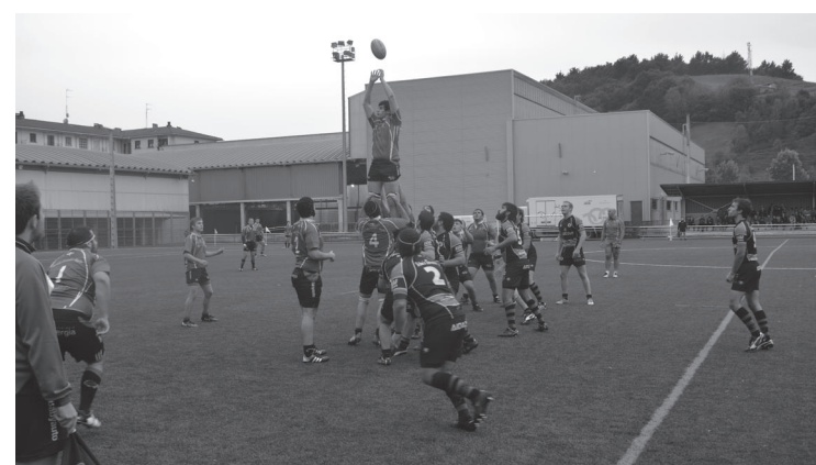
Garaipenarekin ekin dio denboraldiari ZRT Beltzak errugbi taldeak.

ZRT Beltzak taldeak hasieratik ekin zion partidua pisua eramateari, eta hirugarren minutuan erdietsi zuten lehenengo entsegua, 5-0ekoa ezarri markagailuan. Etxekoek bikain kudeatu zuten tartea 80 minutuetan zehar, eta amaieran 22-5ekoa izan zen markagailua. Gauzak horrela, ezin hobeto ekin diote ligari, garaipena erdietsiz lehenengo jardunaldian.