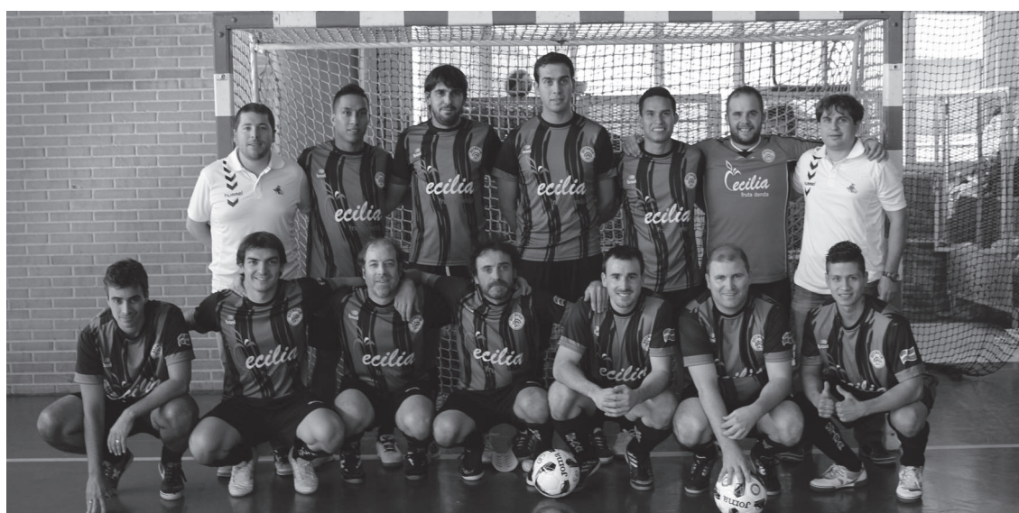
Cecilia Kebab Lasarte Ostadar taldeak bikain hasi du denboraldia Gipuzkoako 2. mailan.

Bi taldeen arteko tartea markagailuak erakusten duena baino murrizagoa da, baina