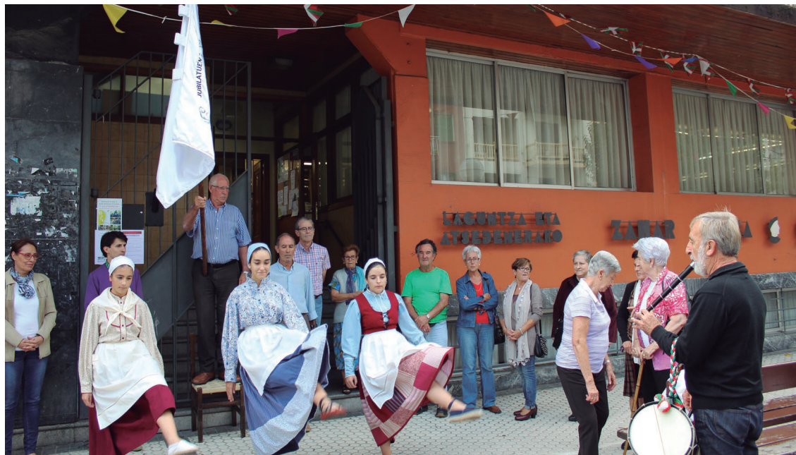
Ostegun arratsaldean ekin zieten ospakizunei herriko adineko pertsonak, banderaren altxatze ekitaldiarekin.