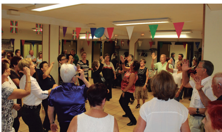
Dantza lehiaketaren ostean denek batera astindu zituzten gorputzak.