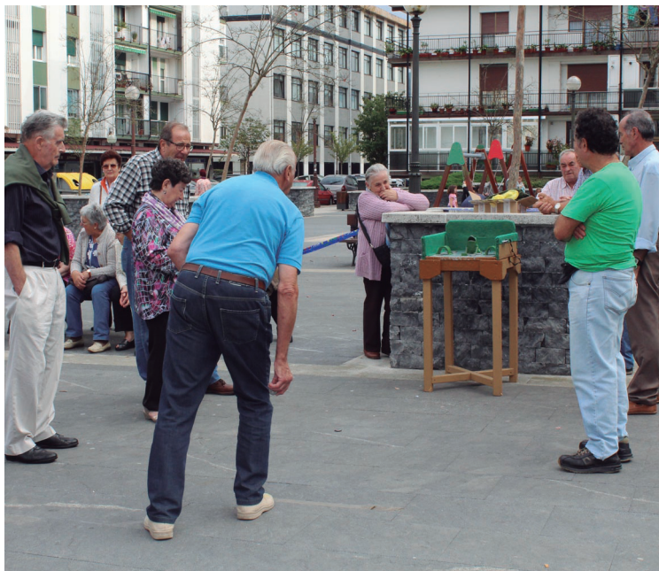
Isla Plazan hainbat jokorekin dibertitu ziren, igelarekin esaterako.