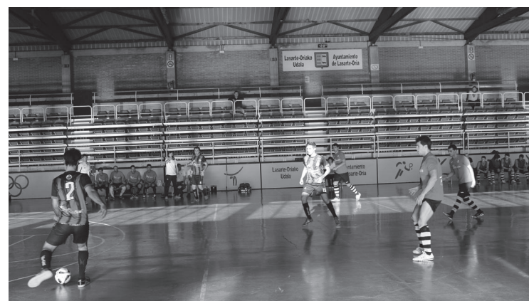
Ostadar Antonioko jokalariek gogotik saiatu arren saririk gabe geratu ziren.

Dosi txikietan, baina etxekoek erakutsi dute kalitatea eta gogoak badituztela egoerari buelta emateko; txanponaren beste aldea ikusteko.