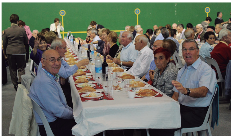
Bapo bazkaldu zuten atzo Michelingo frontoian.