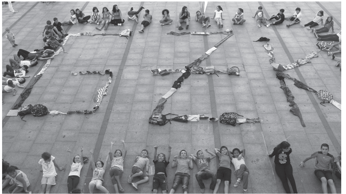
Gazte Klubeko lagunak ostiralean ekintza dibertigarriak egiten dituzte herrian.

Larunbata arratsaldeetan ekintza edo irteera bereziak egiten dira, Txuri-urdirin, zaldi-