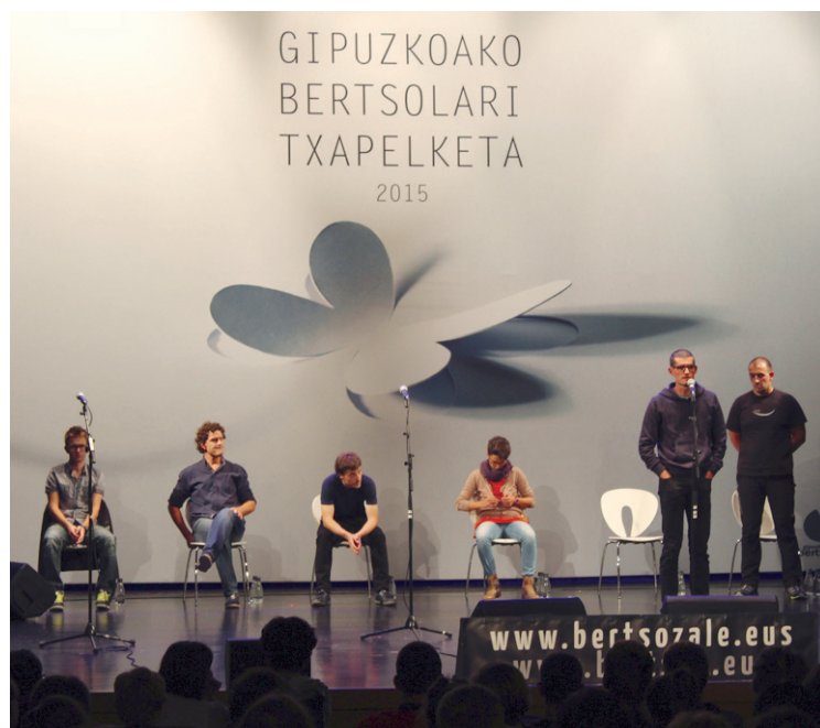
Ohikoa den moduan bertsolarien agurrekin hasi zen final zortzirena.