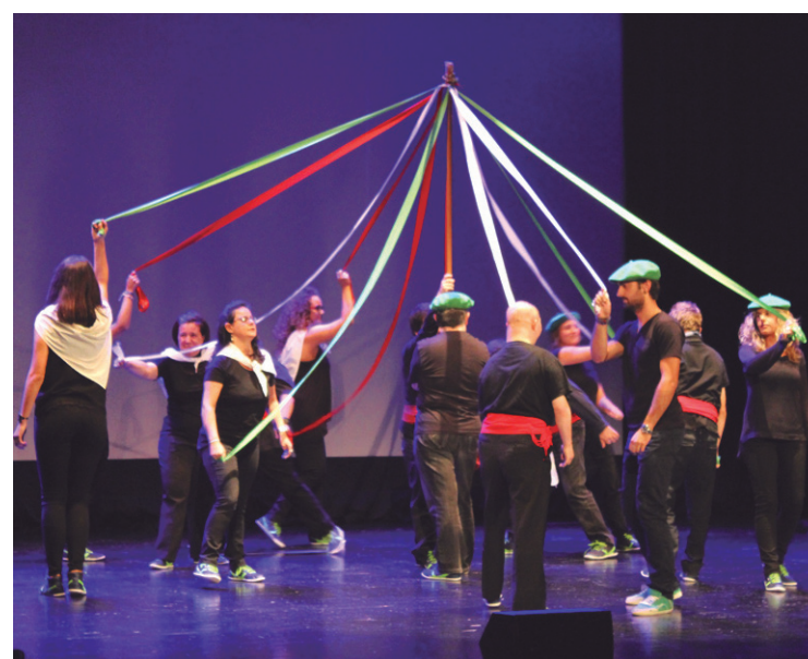
Jalguneko lagunek festa giroa ekarri zuten haien dantzekin.