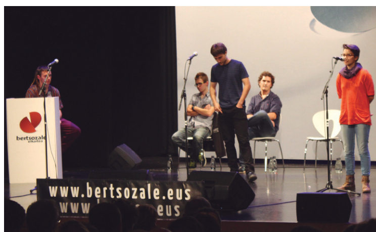
Bertsolariak adi entzun eta ederki erantzuten zieten ezarritako gaiei.