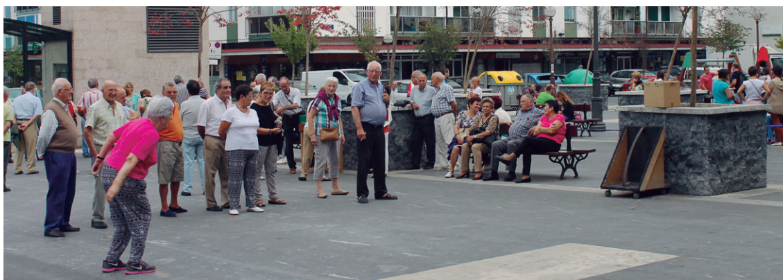
Nagusien omenaldiko ekintzen artean txapelketa eta ibilaldi neurtuak arrakasta handia dute.

Egun handia urriaren 4a izango da. San Pedro parro-