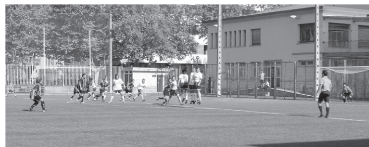
Aukerak izan zituzten Ostadarreko neskek, hala nola, areaz kanpoko faltak.

Uda partean taldea osatzeko izan dituzten zailtasunak erreparatuta, astero berdegutera irteera haientzako garai-pen bat dela esan daiteke, baina ez dira horrekin konformatzen, ezta gutxiagorik ere: "Ahalik eta ondoen ibili nahi