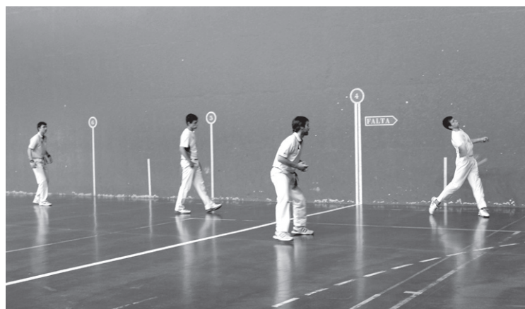
Intzako nagusiek partidari buelta eman eta garaipena lortu zuten.

Intzako bikoteak buelta eman ahal izan zion emaitzari eta seina berdindu ostean,