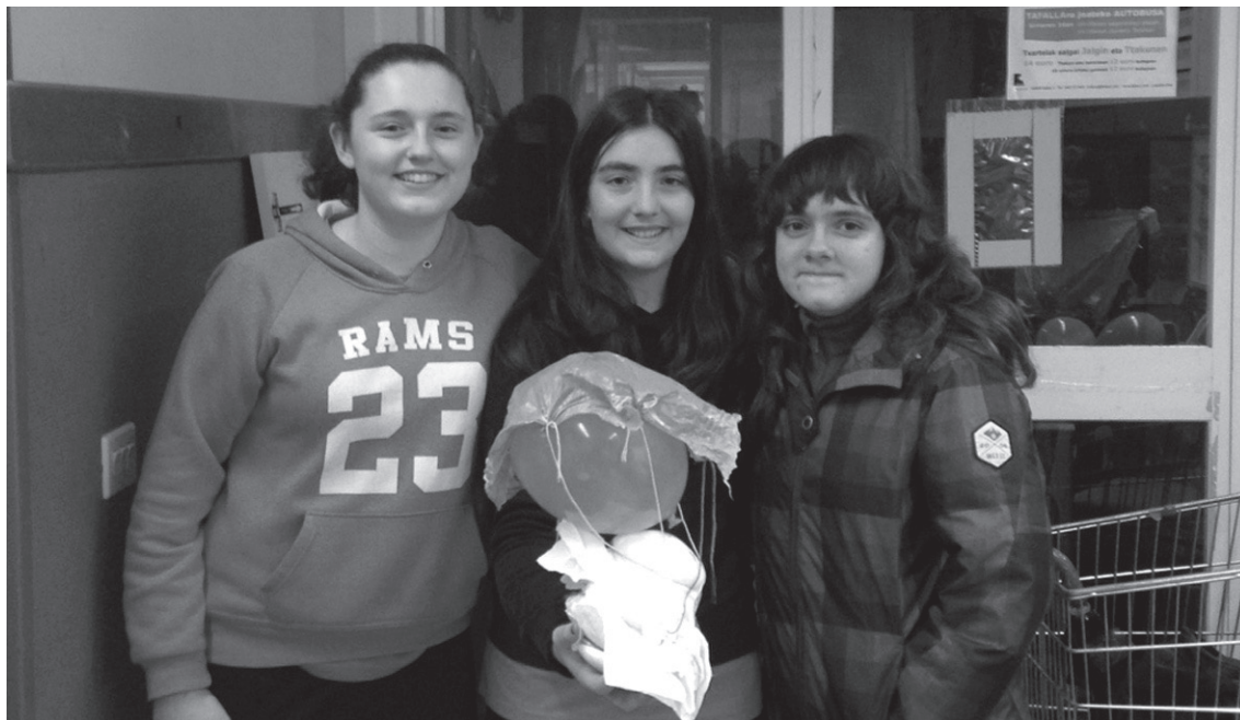
Denetarik egiten dute Kuadrillategi gazteek. laz arrautza altuera batetik bota eta lurrera salbu iristeko tramankuluak.

Bestalde, Kuadrillategi saioen lekuak zehazteko daude oraindik. "Astean zehar jakin araziko zaie gazteei non egingo diren ekintzak," aipatu dute arduradunek.