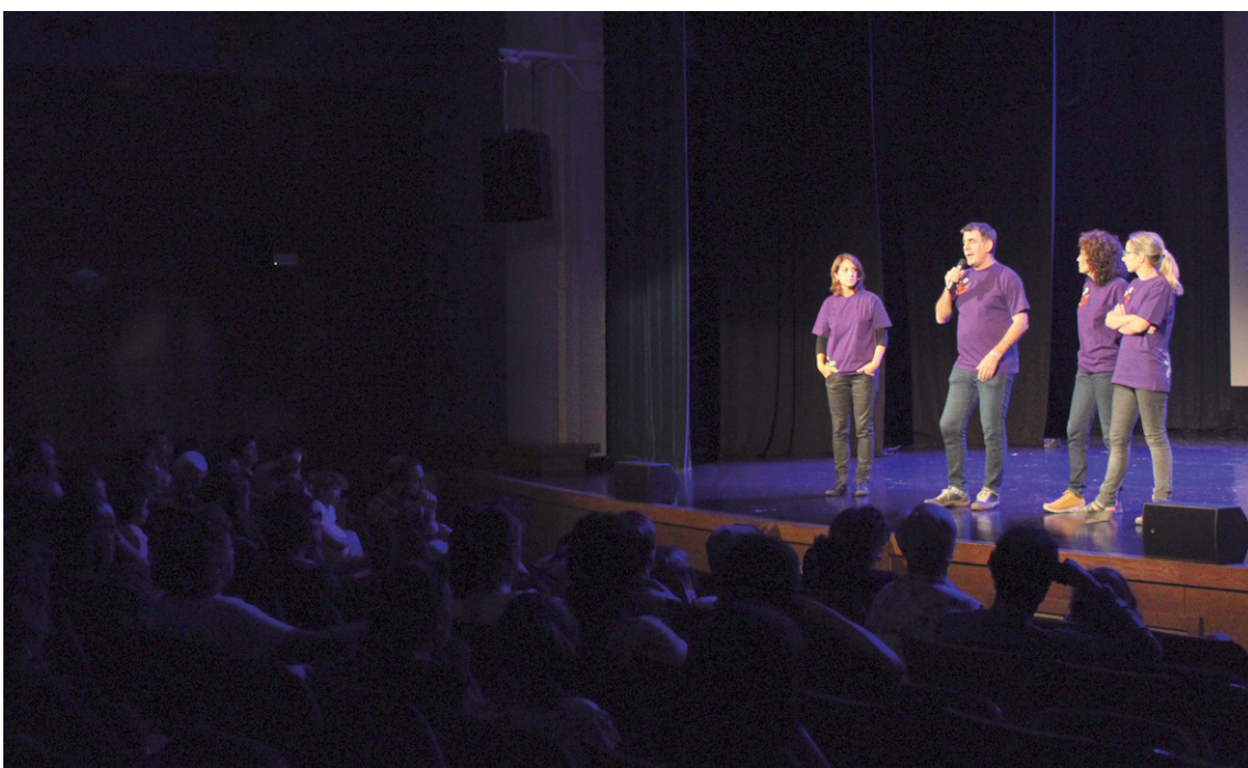
Katxiporretako lagunek 'Txo, Mikmak txikia' DVDan erabilitako berrikuntzak azaldu zituzten.