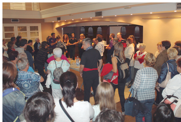
Kafetegian mahai inguru txikia egin zen. Honetan Jalgunerari buruz mintzo zen.