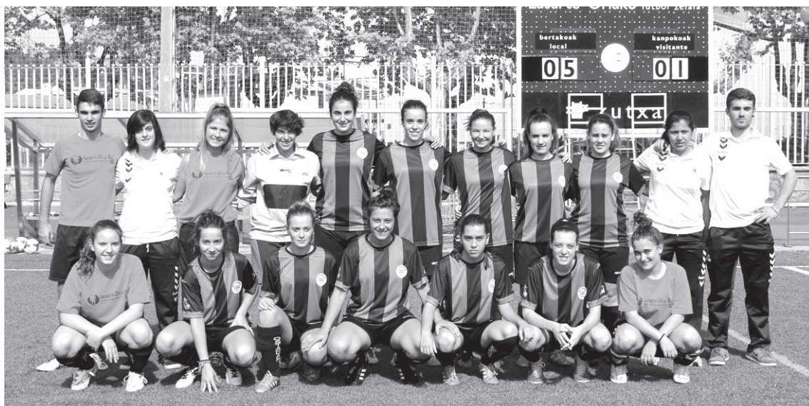
Emakumezkoen erregionalak taldea ozta-ozta osatu du, horregatik herriko neskei gonbita egiten die parte hartzera.

Abuztuari hasi ziren entrenatzen eta oporrak eta lesioak