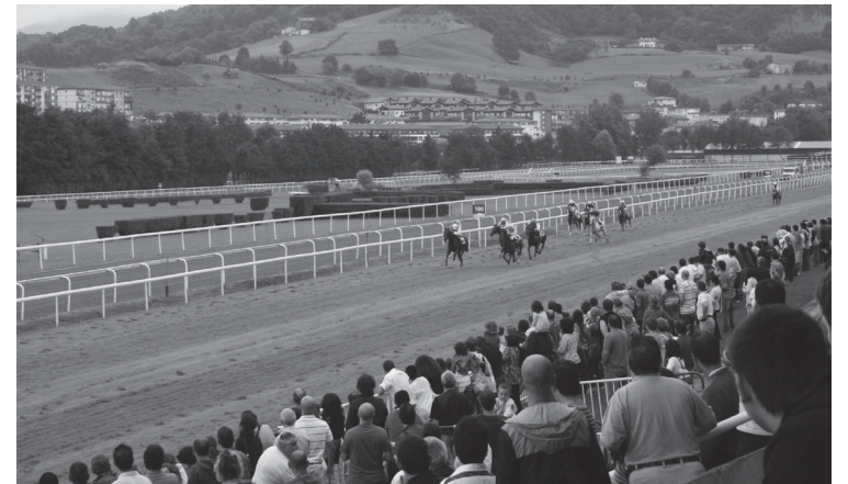
Zale ugari gerturatu dira Hipodromora udako denboraldian zehar.

Donostia saria izan da aurtengo udako denboraldiko azken lasterketa Hipodromoan. Uztaile eta iraila bitartean zortzi jardunaldi jokatu dira, hainbat sari entzutetsu eta handiz osatuak egon direnak: Urrezko Kopa, Donostia saria, Gipuzkoako Foru Aldundia saria... Beste udara batez, turf-zale, turista, apustulari, jockey,