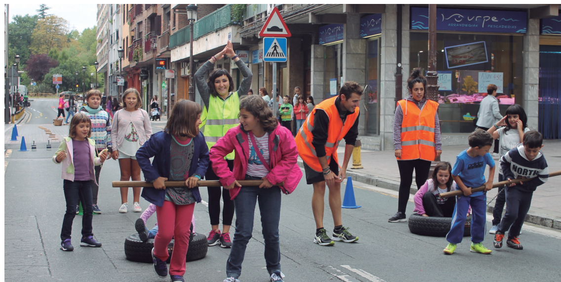
Ederki pasa zuten gaztetxoek herri joko ezberdinak probatzen begiraleen laguntzarekin.

Azken honek urtero izaten du arrakasta eta hala izan zen atzokoan ere. Ilara egin zuten hauen gainean ibili nahi zuten umeek. Txikienek hori bai,