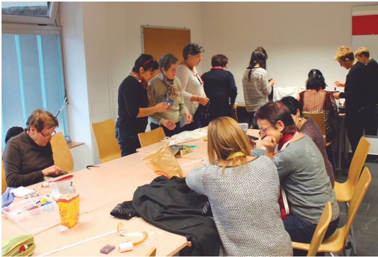
Harrera ederra du euskal jantzi tradizionalaren ikastaroak.