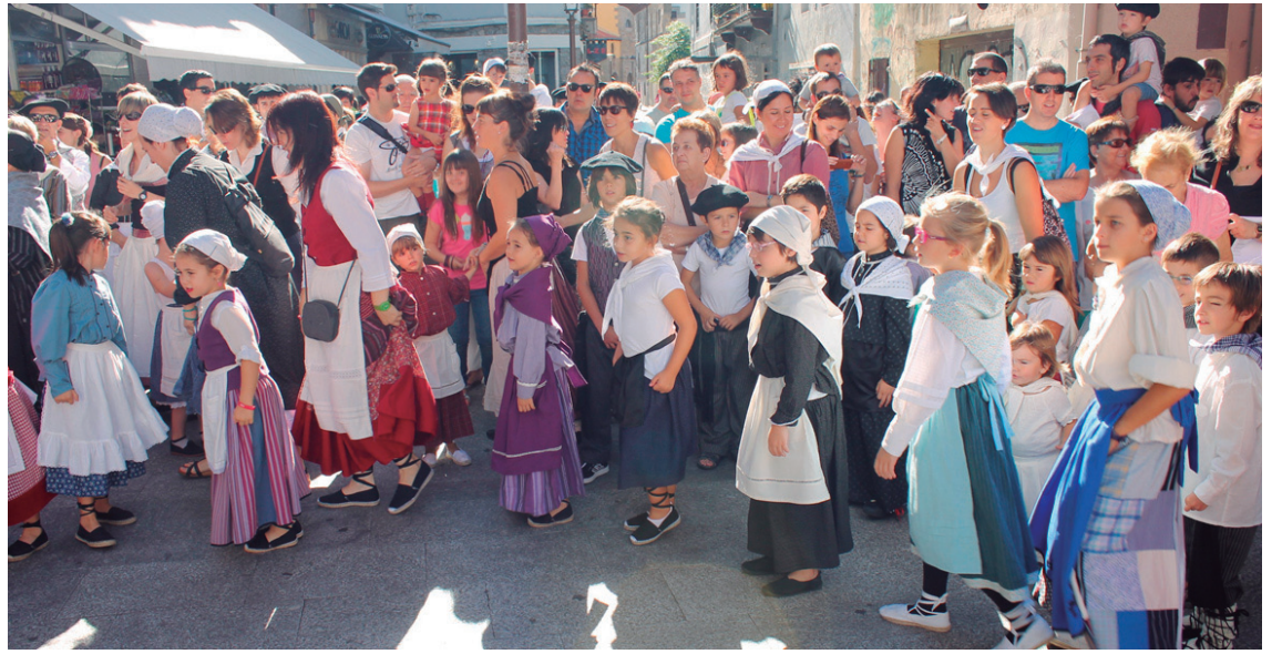
Euskal jantzi tradizionala kalera ateratzeko garaiak datoz, Euskal Jaia, Santa Tomas edo Eguberriak.