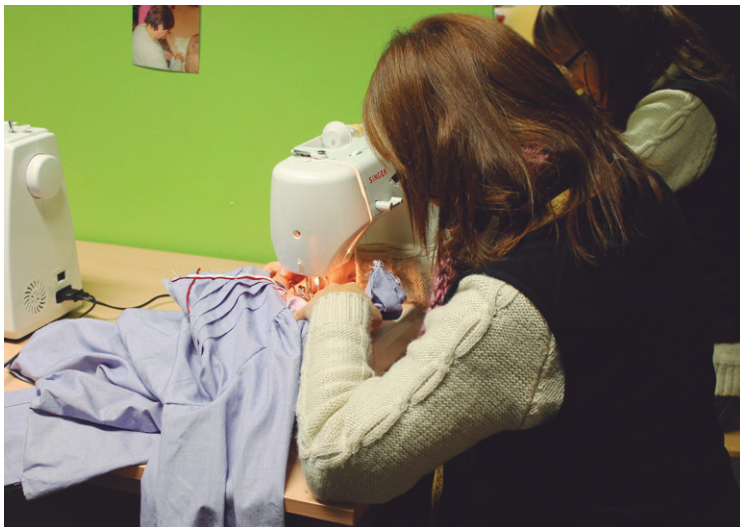
Emakumeen Zentroan egingo dira ikastaroak, bertan baliabide teknikoak baitaude.