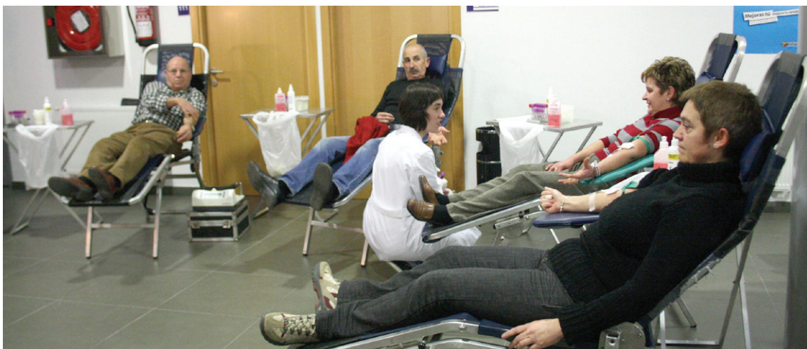
Lasarte-Oriako Osasun zentroan hilabetero izaten dira elkarteko kideak. Bertan 60 bat herritarrek ematen dute odola.

Hala ere, odola eman aurretik, talde medikuak historia bat egiten du, baita miaketa bat ere, odola emateko aukerarik dagoen ikusteko.