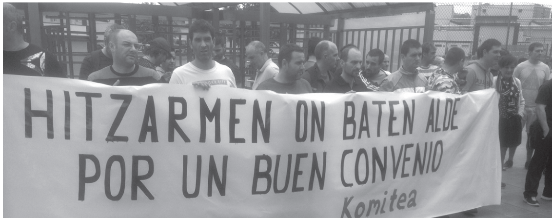
Michelingo langile batzordeko kideak hitzarmen on baten alde mobilizazioak egiten hasi dira.

LAB sindikatua hitzarmen on baten alde agertu da