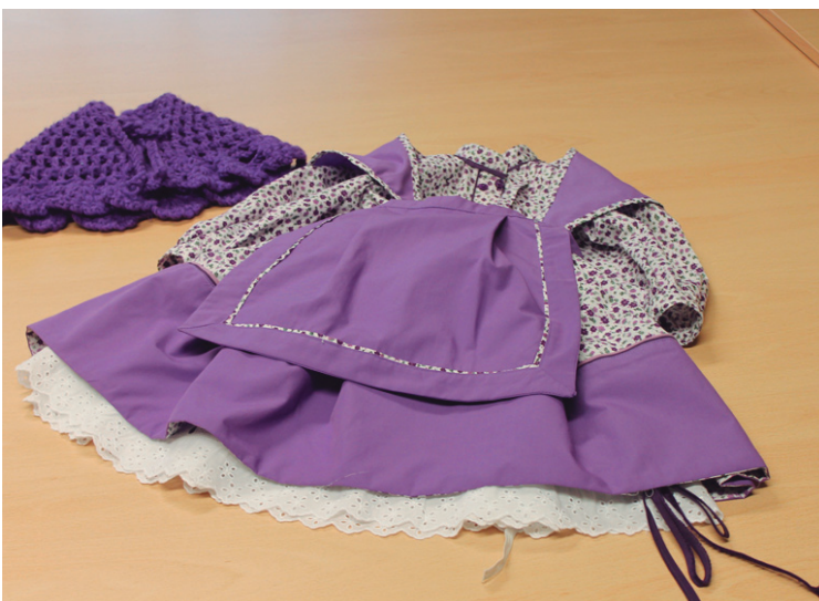
Haur edo helduentzat jantziak egin daitezke ikastaroan.