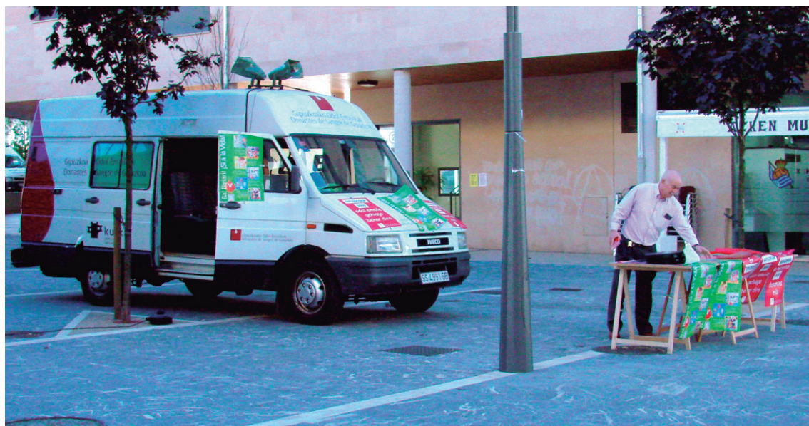
Hitzaldiak, kalean mahaiak jartzea... ekintz augari egiten ditu elkarteak odol emaileak batzeko. Duela lau urteko kanpainako irudia.

Eta "jendea behar da. Ea gazte jendea animatzen den. Odol ematea ez da gauza zaila".