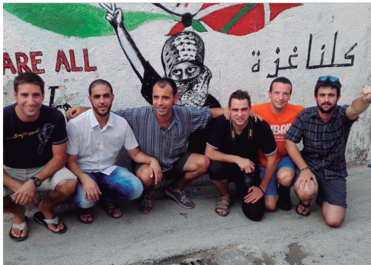
Oihan eskubian, brigadako beste kideekin batera.