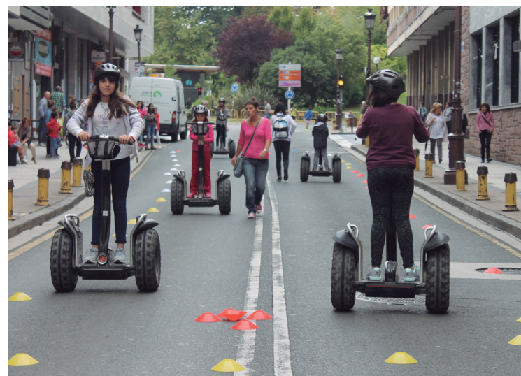
Segway zirkuituak ohi bezala arrakasta handia izan zuen eta ilarak ere egin ziren.

Bizikleta gainean txangoa egitera animatzen ez direnek,