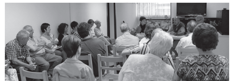
'Ongi ibili' egitasmoa aurrera eramaten duten erakunde, elkarte eta lagunak bileran.

"Saio hauen bitartez, herri-tarrek beste egun batzuetan ere hauek erabiltzeko ohitura hartzea da," aipatu zuen bileran.