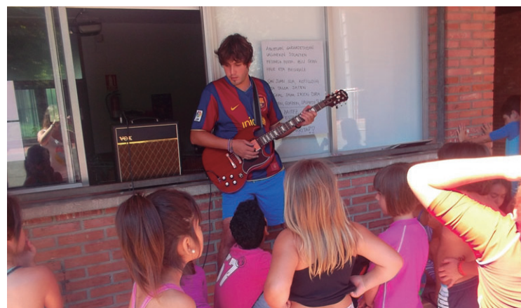
Sei begirale aritu dira gaztetxoekin ekintzaz-ekintza.

Ederki pasa dute denek eta antolatzaileek ezin balantze positiboagoa egiten dute.