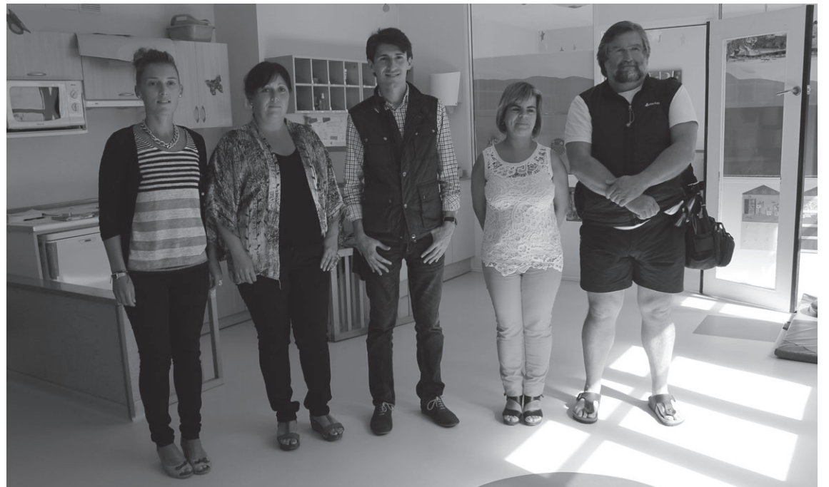
Udaleko eta haurreskolako ordezkariak ostegunean izan ziren haurreskolako konponketak ikusten.

30.000 euroko aurrekontua izan dute eta honekin, lurra aldatu da, kortinak eta haize kortinak jarri dira, goiko patioan toldo bat ipini da haurrak eguzkitik babesteko, honetan ere erorketak ekiditeko zoru biguna jarri da, umeak kalera ez irteteko segurtasun atea eta usoen