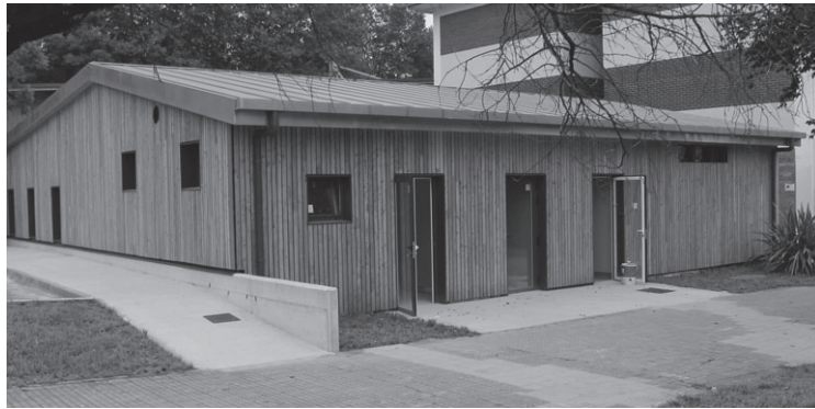
Oraindik lanak guztiz amaitu gabe zeuden aurreko astean.

Landaberri Haur eta Lehen Hezkuntzako ikastetxeak Pablo Garaikoetxea eraikinean eskola-jantoki berria estreinatuz hasiko du 2015-2016 ikasturtea. Instalazio berriak 150 haurrentzat edukiera du. Hezkuntza, Hizkuntza Politika eta Kultura Sailak udalerrri honetako hezkuntza-komunitate osoarekin lankidetzan estuan egin du lan proiektua gauzatzeko, eta 295.369,53 euro bideratu ditu obra egiteko.