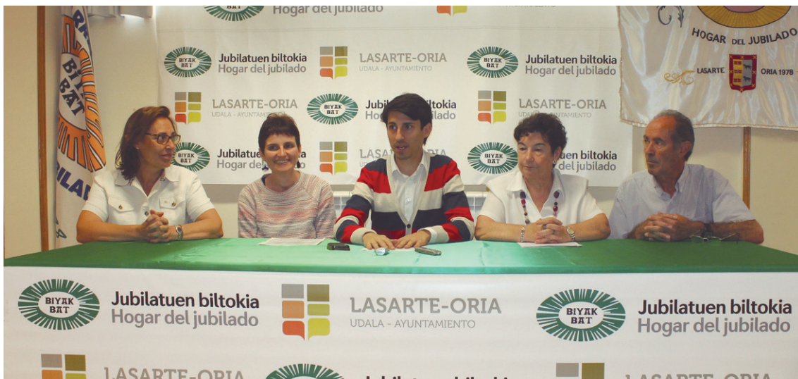
Udal ordezkariak eta Biyak Bat elkarteko kideak nagusien omenaldi astearen aurkezpenean.

astea osatzen lagundu dutenei eskerrak eman eta egitarau zabal eta anitza aurkeztu zuten.