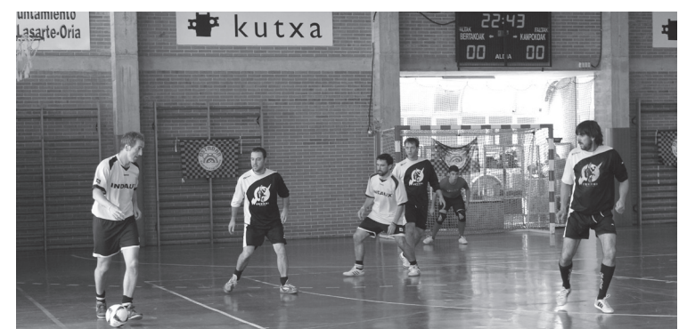
13 talde hartu zuten parte iaz herriko areto-futbol txapelketan.

Antolatzaileek jakinarazi dute 18 talde onartuko dituztela gehienez. Iaz 13 partaidetako multzoa osatu zuten, eta aurtengo txapelketan kopuru