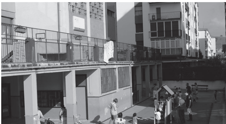
Zumaburuko kanpoko aldea berritzeko proiektua landuko du udalak.