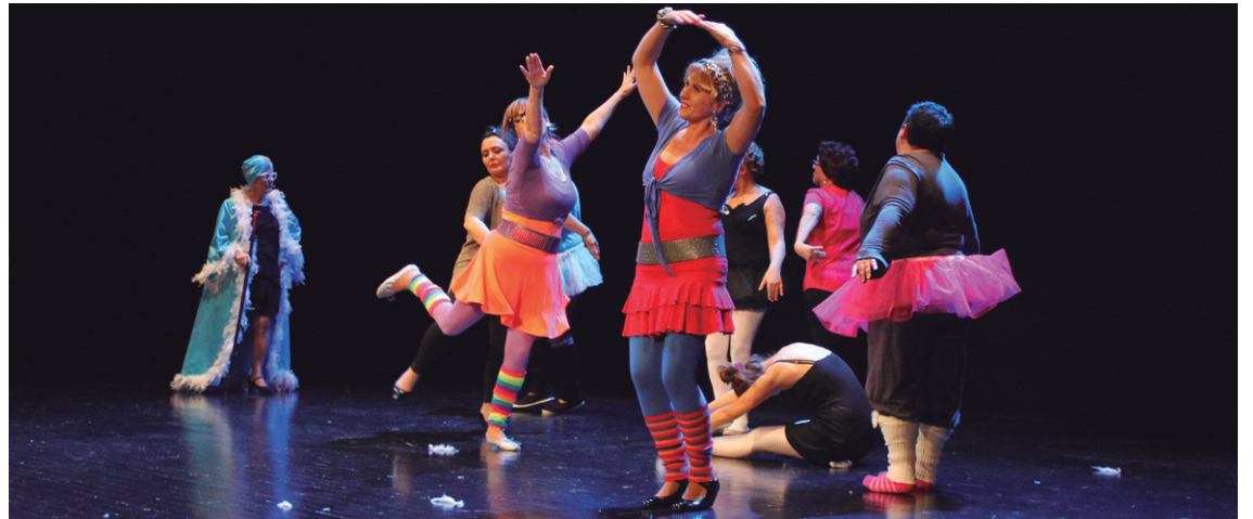
Emakumeen Zentroan ikastaro ugari eskaintzen dira eta horien artean, antzerki taldea dago.

Honetaz gain, ikasturte hasiera honetan nabarmentzekoak dira "Emakumeok gure ekonomia kontrolatuz, eta ez alderantziz" tailerra, emakume migranteekin egingo den topaketa, Lasarte-Oriako Udalaren Beldur Barik II. lehiaketa eta honekin lotuta Gaztelekuan egingo den film laburren tailerra.