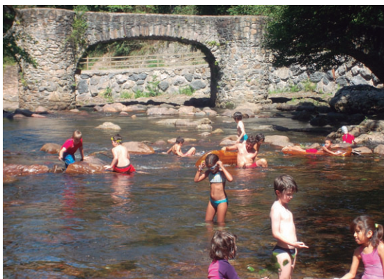
Leitzarango jaitsiera egin zuten gaztetxoek baita zaldian ibili ere.

Ekintza hau esaterako, "uztailean egitea ia ezinezkoa da haur bolumena askoz handiagoa delako. Talde txikiak