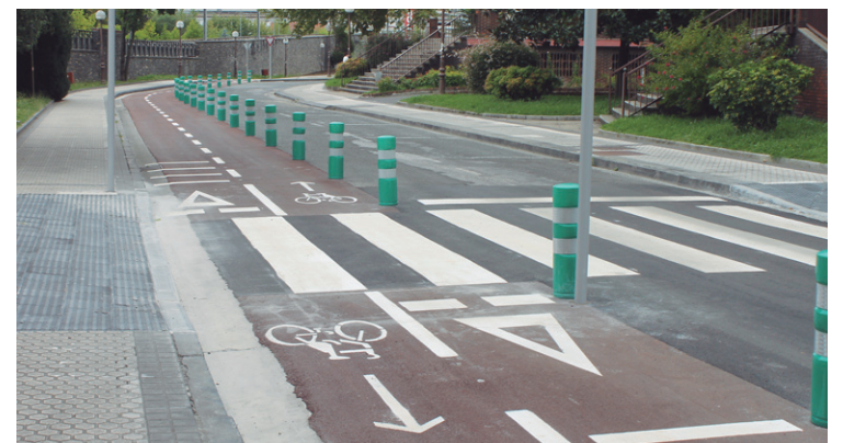
Atsobakar auzoan Urbileko rotondaraino luzatu da bidegorri sarea.

Baina "Foru eta udal bidegorriak oraindik lotuta ez daudenez, txirindulariek ezin dute Lasarteko zentrorra edo zentrotik bidegorrira joan modu eroso eta garbian.