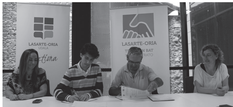
Alkatea eta Aterpeko lehendakaria hitzarmena sinatzen.

Bazkide berriak erakartzeko kanpaina egingo dute elkarlanean, urte batez haien kuotak udalak finantzatzeko dituzte. Teknologia berrietan eta komunikazioan taldeko formazioa bazkideek eskuratzea ahalbidetuko du udalak ere. Banakako aholkularitza eskaintzea, marketineko aholkulari bidez; Aterpeak Merkataritza biziberritzen egitasmoan eta Tratu On Bat markaren eta haren webgunearen promozioan aktiboki parte har dezan sustatuko da eta azkenik, herriko giro komertzialari eragiten dioten ekimen berrietan