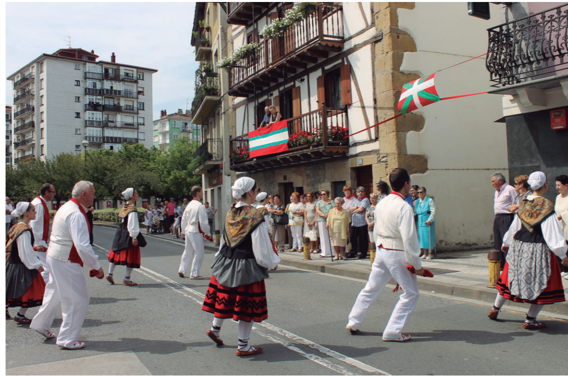
Erketzeko dantzariak agurra, arin-arina eta fandangoa eskaini zuten Santa Ana Karkabaren aurrean.