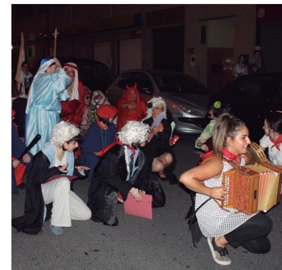
Desfilea egin zuten ohi bezala elkartetik Okendora jendea parodiara gerturatatzeko animatuz.

Akusatuak, Brunette Tro-luzi eta Maximiliana Irurzur-tini ez ziren sugarrengatik salbatu eta erre egin zituzten Santa Ana egunari amaiera borobila emanez.