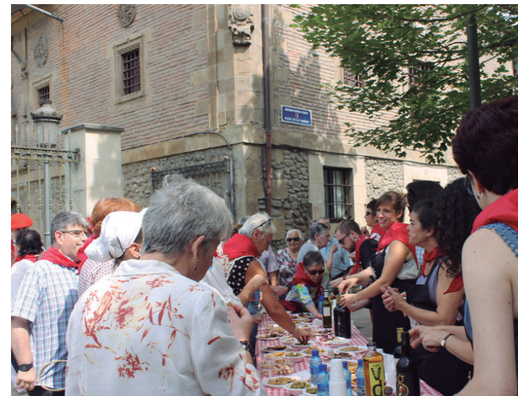
Dantzaren ostean egin zen aurtengoan hamaiketako.