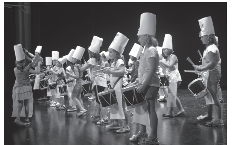
Donostiako Danborrada irudikatu zuen haur talde batek pasa den ostiralean.

Festa erraldoia. Hitz horiek definitzen dute ongien pasa den ostiralean udako txokoetako kideek eskaini zuten emanaldia, Manuel Lekuonako hitzaldi aretoan.