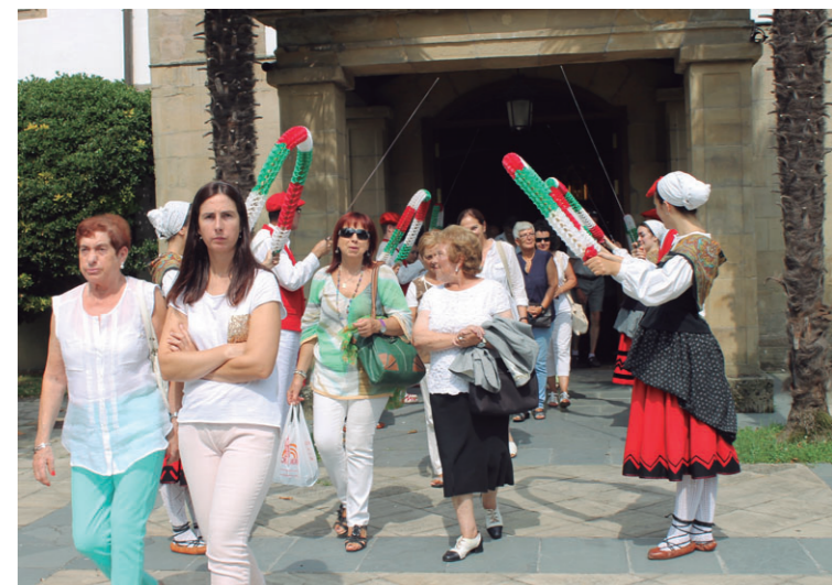
Mezatik irteadakoan zuzenean karkabara gerturatu ziren herritarrek.