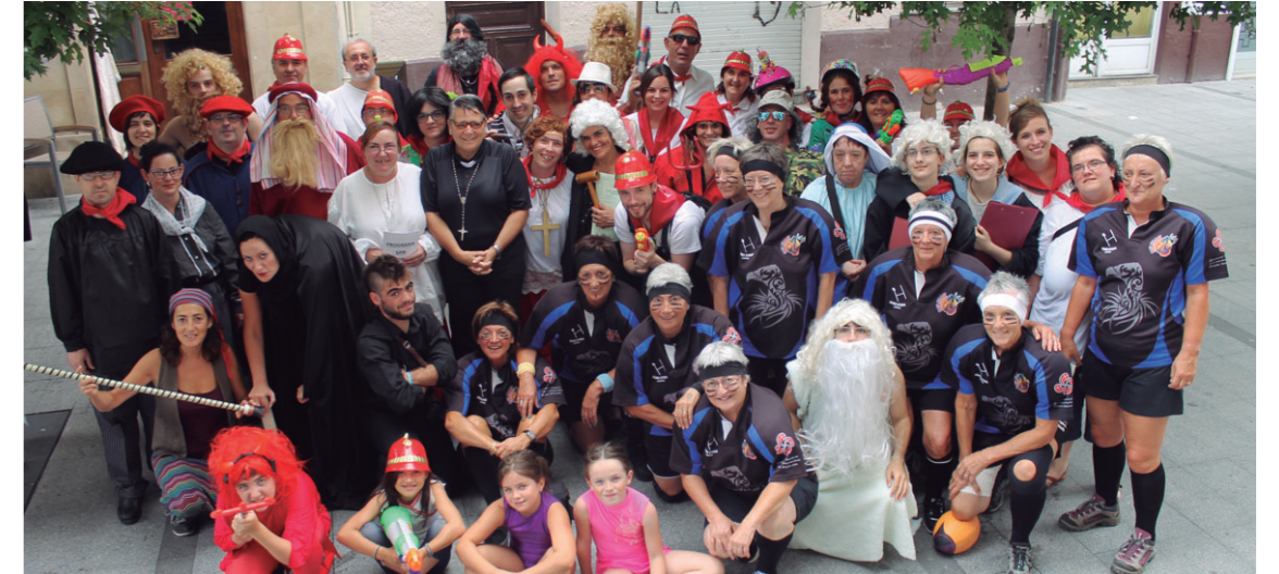
Familia argazkia atera zuten aktore guztiek afaltzera abiatu baino lehen.