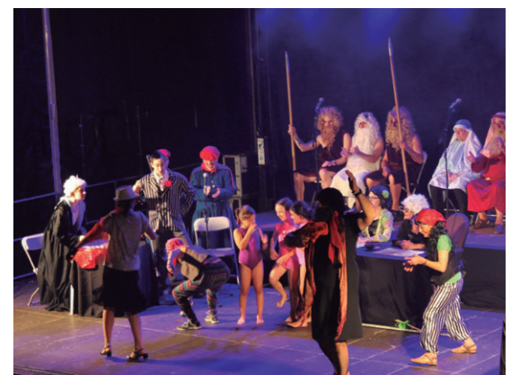
Ohi bezala mota guztietako pertsonaia pasa ziren Okendoko oholztatik, ikusleek euriari egin behar izan zioten aurre,