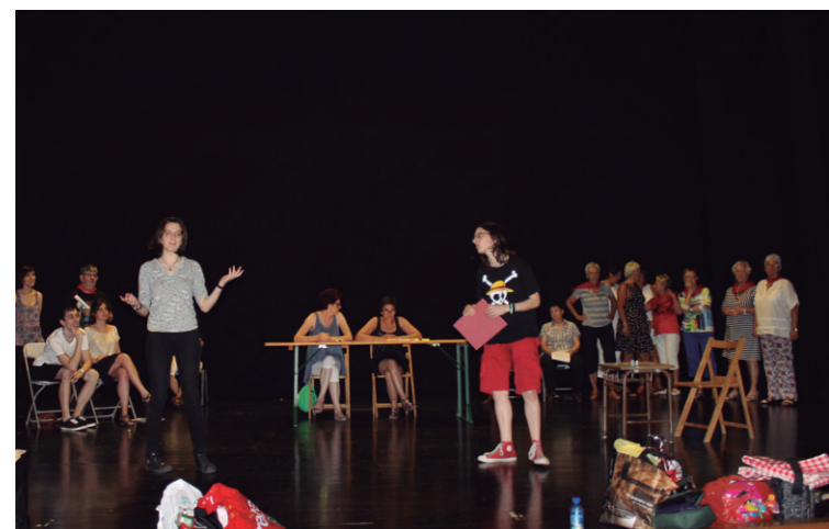
Aktoreek azken entsegua egin zuten arratsaldean.