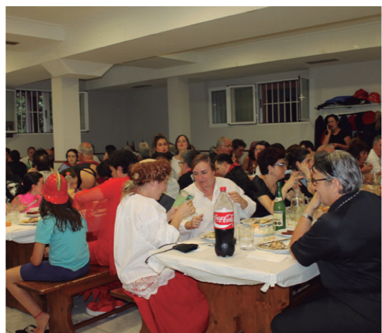
Udaberri elkartean afari goxoaz gozatu zuten parte hartzaileek.