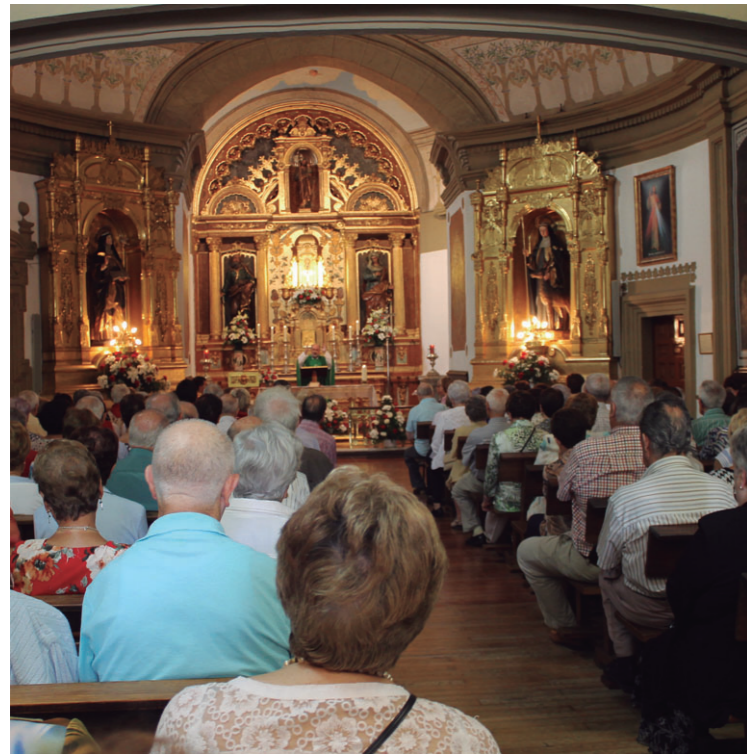
Santa Ana eguna igandea izanik, asko izan ziren mezara gerturatu ziren herritarrek.