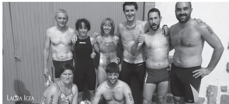
Hainbat herritarrek argazkia atera zuten atzoko zeharkaldian.