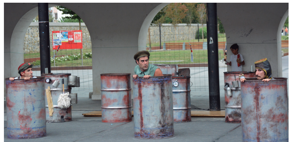
Ikuskizun paregabea eskaini zuten Malas Compañías taldeko antzezleek ostiral arratsaldean Okendon.