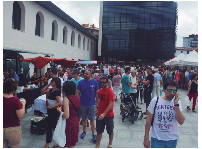
Hainbat herritar hurbildu ziren egun osoan zehar Santa Anako azokara.