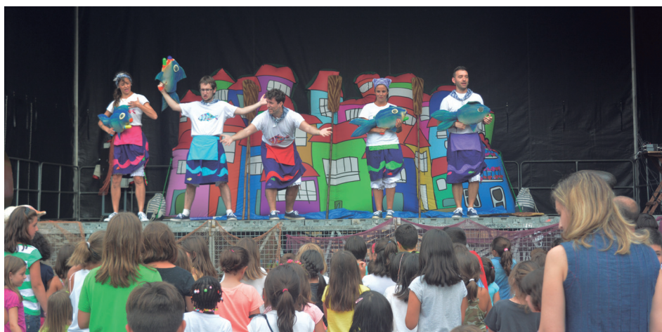
Hamaika jolas, kantu eta kolore ekarri zituen 'Sardina freskue' ikuskizunak Okendo plazara ostegunean.