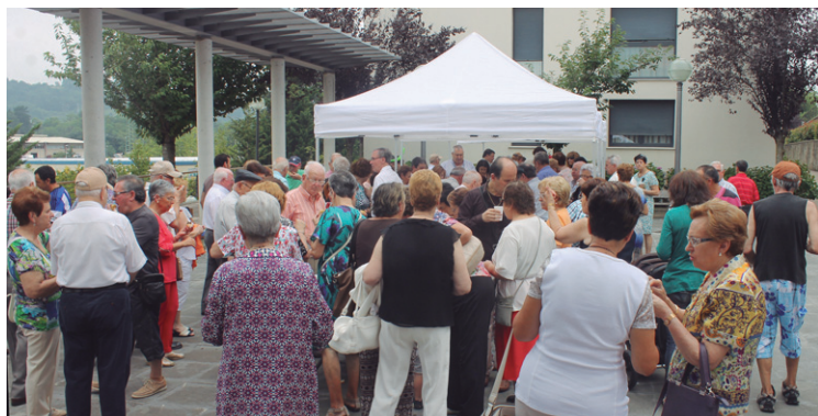
Oriatarren bazkaria baino lehen luntxean solasaldian hasteko aukera izan zuten auzotarrek. Arratsaldean, Oriako Sorgin Dantzaz gozatzeko aukera izan zen Brunet-Enea parkean.

Jai hau Basaundi auzoan hilabete amaieran izango diren San Inazio jaien aurrekari izan da. La Esperanza elkarteak herritarrei hauetan ere parte hartzeko gonbita egiten die eta batez ere, haurrei.