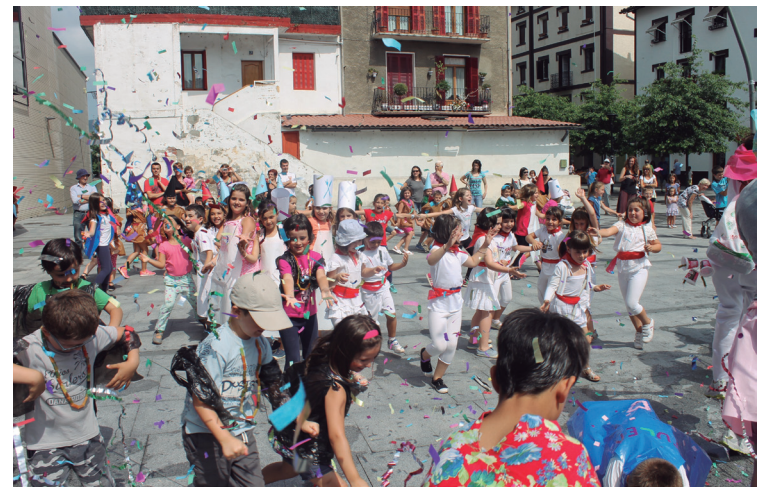
Herriko kaleetan barrena desfilean ibili ostean, Okendo plazan lehertu zen festa.