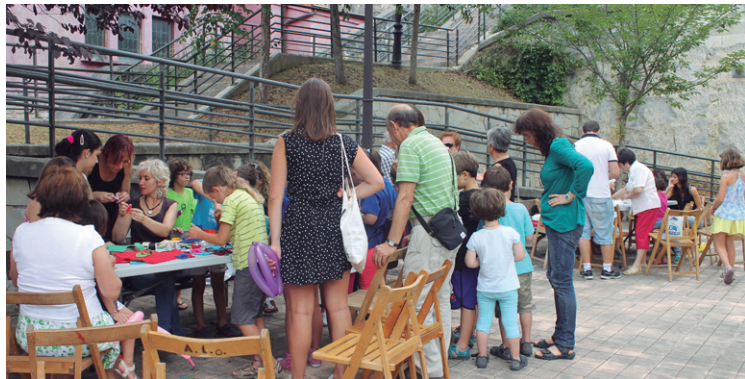
Buruhandiak edo haurrentzako tailerrak izan ziren goizeko lehen orduetan Oriako auzoan. Eguerdian, berriz, Karmango Amaren ohorezko meza izan zen. Lepo bete zen.

Xirimiri elkarteko kide eta lagunek agerraldia egin zuten ostegunean. Honetan Auzitegi Nazionalak ekainean berretsitako erabakiaren irakurketa egin zuten. Desjabetzearen aurka agertu eta zigortutakoen absoltuzioa eta herriko tabernen zigorraren indargabetzea eskatu zuten. Era berean, elkarteari elkartasuna adierazteko hainbat ekintza egingo direla jakitera eman zuten; hala nola, sinadura bilketa.