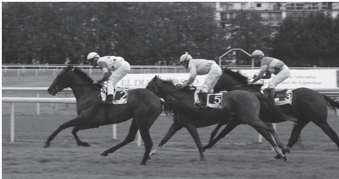
Igande honetan bueltatuko dira zaldi lasterketak Hipodromoan; udako denboraldia hasiko da.

La Zarzuelako hipodromoak ez zuen ebazpen hori onartu eta lasterketak bertan