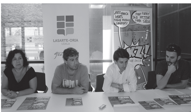
Uda sasoiaren kultur ekintzak kalera ateratzeko apustua.