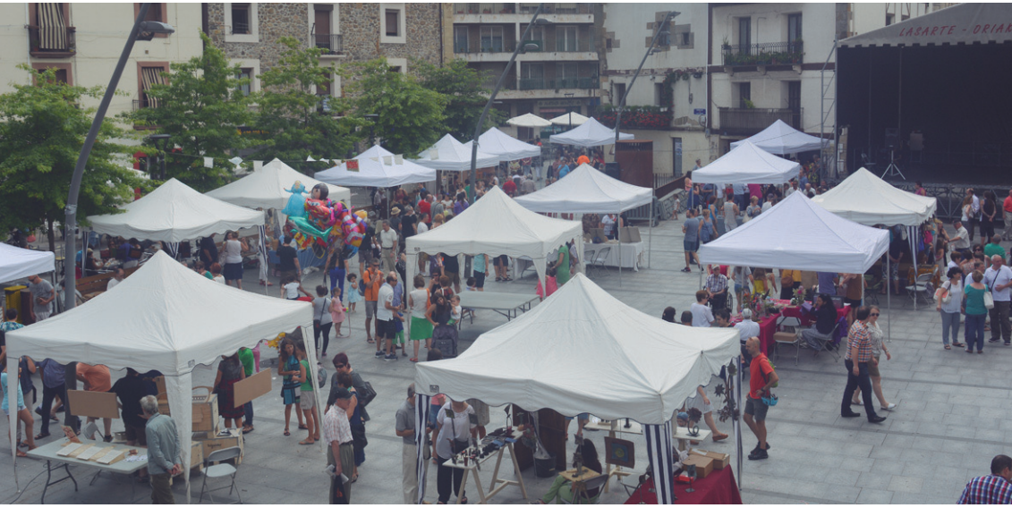
60 postutik gertu ikusi ahal izan zituzten herritarrek atzoko Santa Anako XXXI. azokan.