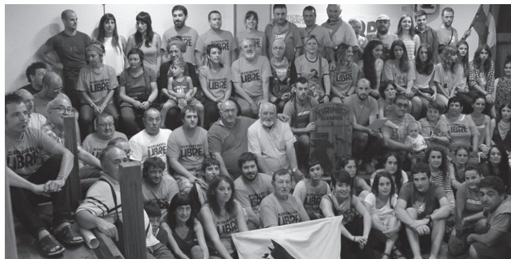
Ostegunean egindako agerraldian herritar asko bildu zen.

Xirimiri ixteko aginduaren aurrean, sinadura bilketa abiatu dute eta ostegunean Lucio Urtubiaren hitzaldia izango da elkartearen 19:00etan. Elkartasun ekintzak dira eta herritarrak hauetan parte hartzea deitzen dituzte bazkideek.