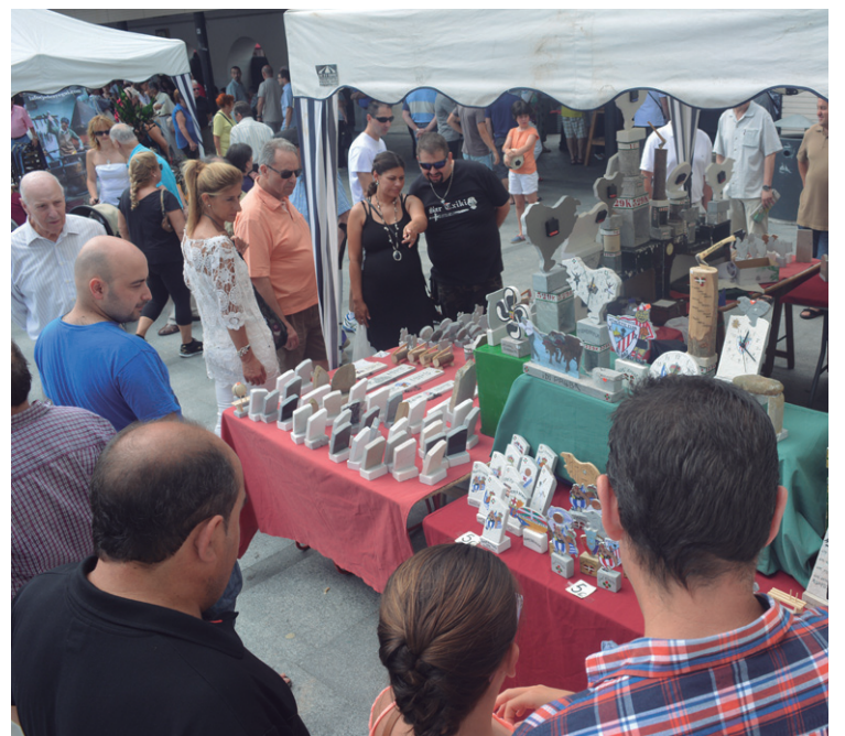
Denetarikoko produktuak ikusteko eta erosteko aukera izan zuten herritarrek atzo.