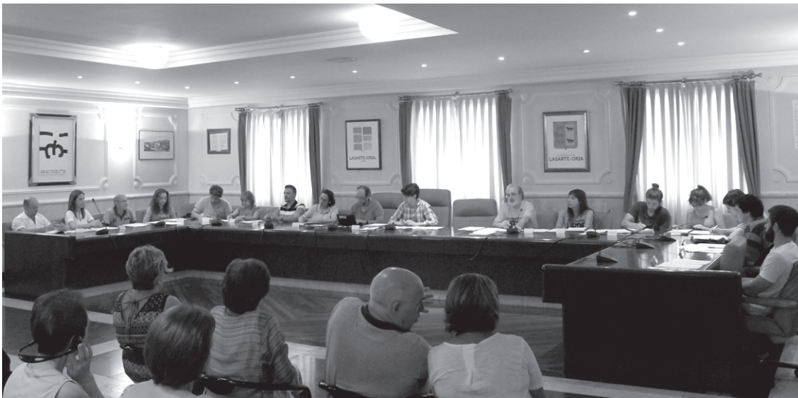
Joan den asteartean bildu zen lehenengo aldiz Udal berria, udaletxe zaharreko pleno aretoan.