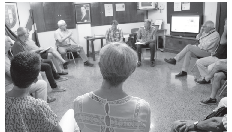
Iritzia eta esperientziak partekatzeko aukera ere izan zuten hurbildu ziren herritarrek.

Era honetara, norbanakoen memorian oinarritutako memoria zabalago bat edo memoria aztarnategi bat