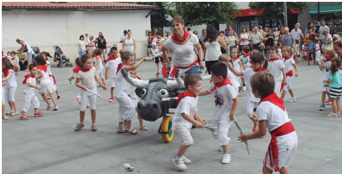
Entziero berezia izan zen Okendo plazan, deunari abestu eta zezenen aurrean lasterka ibili ziren Udako Txokoetako txikiak.

Hala ere, ez dira Udako Txokoetako ekintzak amaitu, hurrengo ostiralean bertainek hartuko dituzte herriko kaleak Euskal Herriko jaietako desfilearekin.