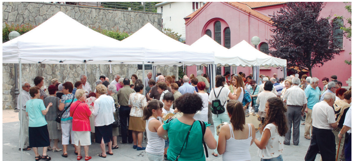
Oria auzoan Karmengo amaren eguna ospatuko da ostegunean eta honekin batera, kaperako 75. urteurrena.

hilabete bukaeran, uztailearen 30ean eta 31an, San Inazio eguna ospatuko dute.