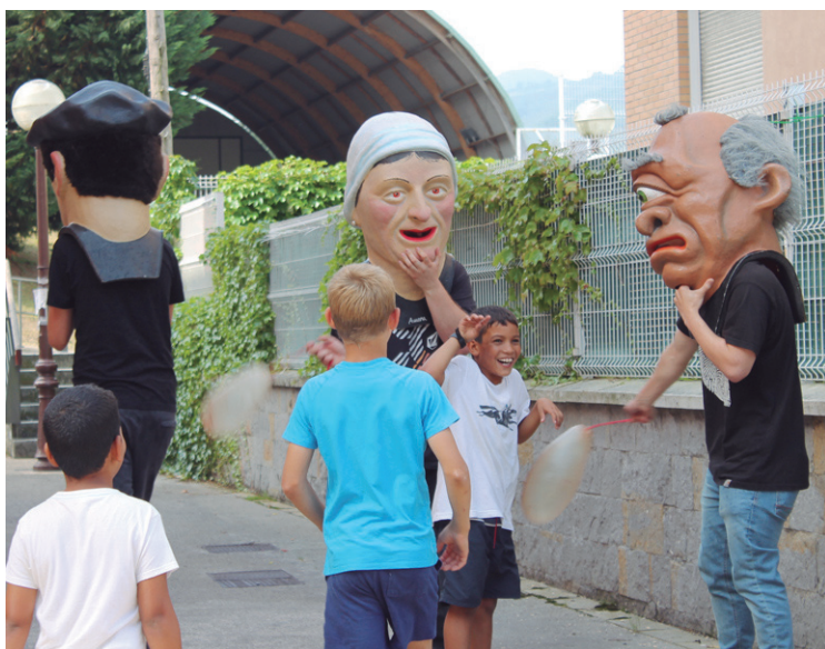
Haurrei zuzendutako ekintza ugari antolatu dira Basaundiko San Inazio jaietan.

Era berean, kultura eta jaiak deszentralizatzearen alde lan egingo dutela azpimarratu zuen agerraldian. "Auzo guztiek kultura eta jaiak izateko lan egingo dugu. Egun Zabaleta edo orain Oria eta Basaundik dituzten bezala, beste auzoek haien jaiak antolatzeko babesa emango dugu".