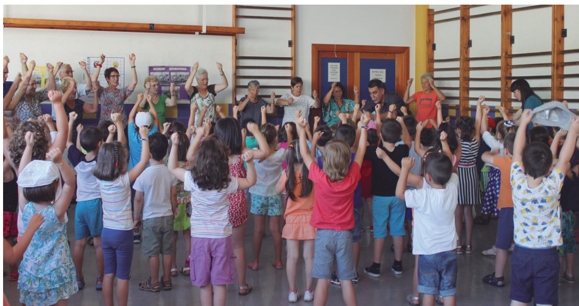
Xumela koruko hainbat kiderekin batera, ederki astindu zituzten gorputzak eta mingainak.