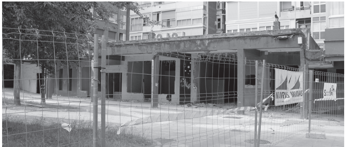
San Marcial eta Uzturre plazako lokalen lanak bi hilabetez geratu dira. Telefonikak ere lanak egin behar ditu.

Gainera, Udalak adierazi duenez, amiantodun materiala denez espezializatutako enpresa berezi bat sartuko da hodiak erretiratzera.