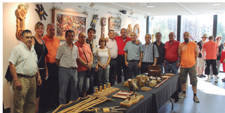
Zurmailu zurlanketa elkarteko kideak eta udal ordezkariak izan ziren erakusketa zabaltean.

dako ekarpen ekonomikoa" eskertu nahi diote. Beloki familiarentzat (ORVY grafikak) ere esker hitzak dituzte: "Inolako irabazi-interesik gabe utzi dizkiugu Beloki familiak herri honetan dituen lokalak".