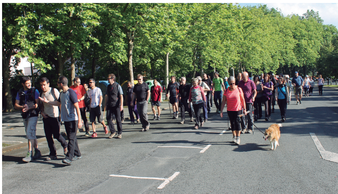
Eguraldia lagun hainbat herritar eta zubietar animatu ziren Islada Ezkutatuak taldearen ibilaldian parte hartzera.