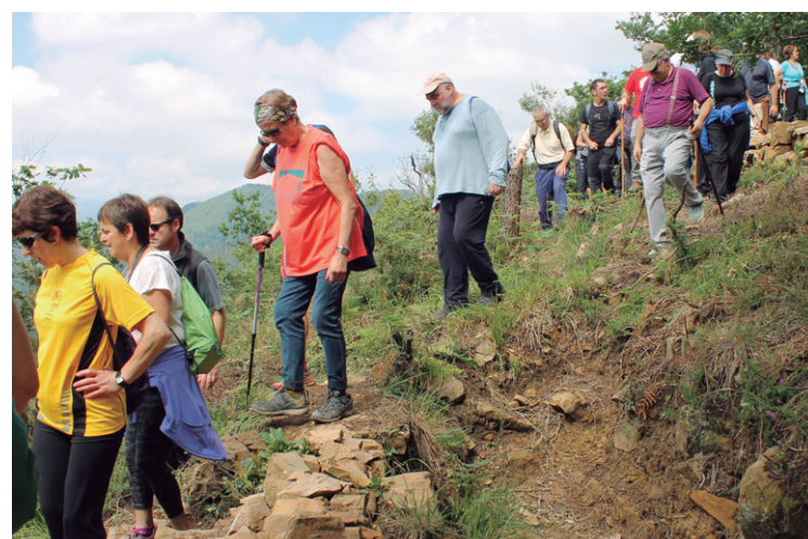
Lubaki artean ibili ziren herritarrek eta adi-adi entzun zituzten azalpenak.