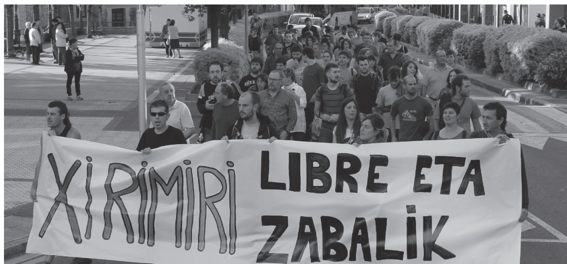
Ostegunean manifestazioa eta ostiralean bilera egin ziren egoeraren berri eman eta erabakiak hartzeko.

Elkarteko kideek egindako deiari erantzunda, herritar ugari hartu zuten parte ostegunean elkarretaratzean. 'Xirimiri, aurrera' eta 'Ez, ez, ez, lapurretarik ez!' bezalako aldarrikapenekin elkartasuna eta babesa adierazi zioten Xirimiriri. Ostiralean berriz, batzarra egin zuten elkartean bertan eman beharreko pausoak azaldu eta erabakiak hartzeko.