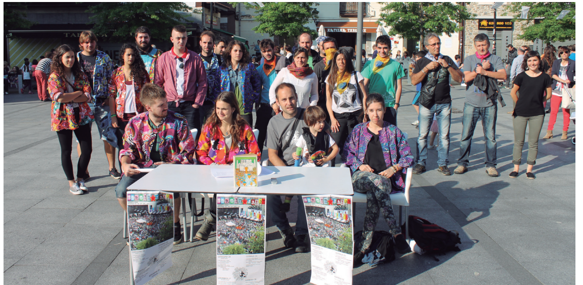
Sorgin Jaiak-eko hainbat kide eta herritar, joan den ostegunean Okendo plazan eman zuten prentsurrekoan.

Gaur egungo langilariaren egoerari buruz ere aritu ziren atzoko prentsurrekoan: "Euskal Herriko zein Lasarte-Oriako gazte askok kanpora joatea beste irtenbiderik ez daukate, hemen ez baitago