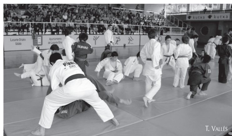
Gimnastika erritmikoko eta judoko atalek erakustaldiak eskaini dituzte aste hauetan.