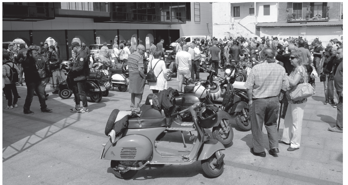
Hainbat izan ziren asteburuan Vespa eta Lambrettak ikustera hurbildu ziren herritarrak. Okendo plazan giro ederra sortu zen.

Basaundin izan ziren igandean. Bertan erakusketa egin eta Buruntz-Azpi elkartearen bapoz bazkaldu ostean, amaitu zen topaketa.