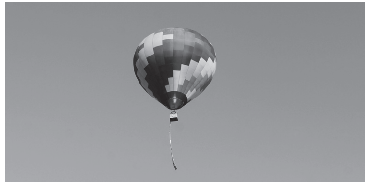
Gure Esku Dago pankarta zintzilik zeraman globoa ikusi ahal izan zen zeruan larunbatean.

Ostiral arratsaldean ere hainbat herritar gerturatu ziren Villa Mirentxura, 'Jostunak' dokumentala ikustera. Aurretik, azken oihalak josi zituzten Okendo plazan.