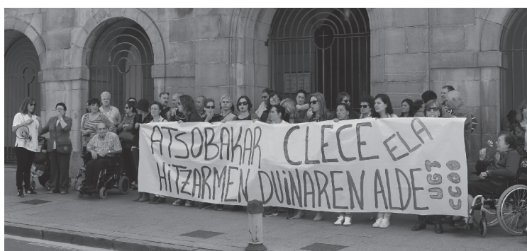
Hilabetez langileek protesta egin dute euren egoera salatzen.

"Ekainaren 12a iritsi eta ezustekoa izan genuen. Enpresak hitzarmena sinatu beharrean, denbora gehiago