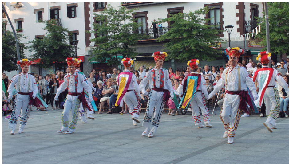
Nafarroa, Behe Nafarroa, Bizkaia, Gipuzkoa, Araba... herrialde ezberdinetako dantzak eskaini zituzten Erketz eta erketzeko lagunak taldeko dantzari larunbateko emanaldian.