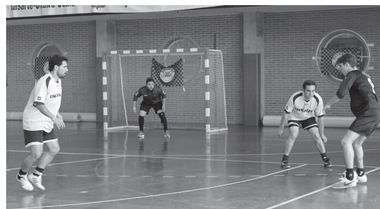
Trumoi tabernak Indaux menperatu zuen kontsolazio finalean.