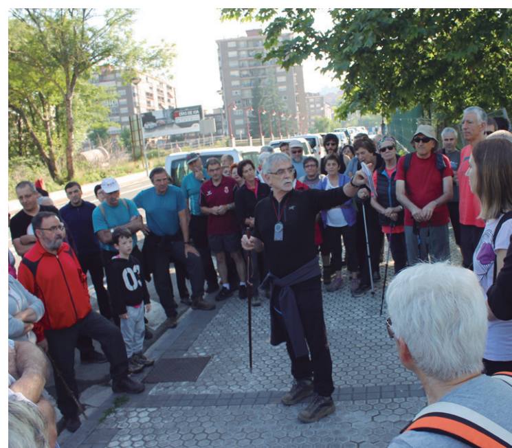
Lehen azalpenak Hipodromoko aparkalekuan eskaini zituzten.