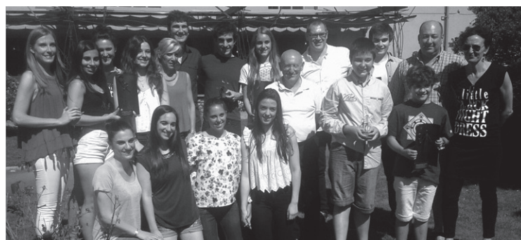
Denboraldi amaierako bazkarian saritutako lagunak eta LOKEko ordezkariak.