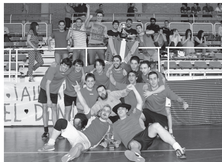
Lagunekin ospatu zuten garaipena El Punto taldeko kideek.