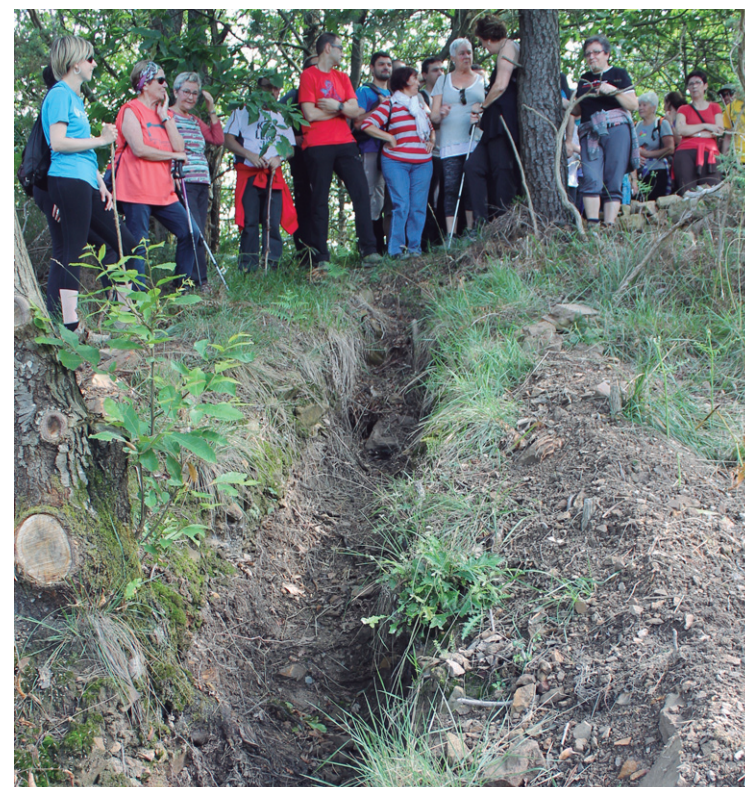
Tiratzaileen hobiak eta komunak ere aurkitu dituzte Txaldatxurren Islada Ezkutatuak taldeko lagunek auzolaenan egindako garbiketan. Muguruzak defentsa nola egin zuten azaldu zuten tiratzaileen hobian.