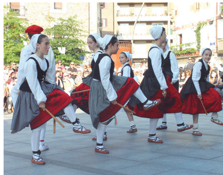
Erketzeko txiki eta gaztetxeok ere haien lanak erakutsi zituzten.

Emanaldiari amaiera emateko, Behe Nafarroako Inauterietako dantza koloretsuak izan ziren Okendo plazan.