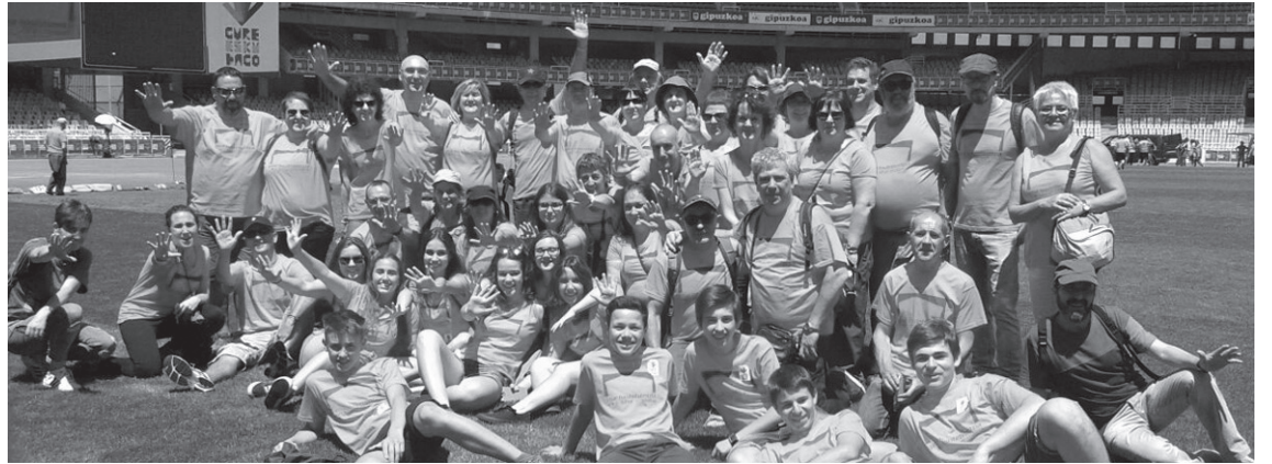
Lasarteoriar ugari izan zen atzo Donostian bai oihalkatean, baita Anoetan ere erabakitze eskubidearen aldarria egiten. J. PEREZ

Atzoko ekitaldirako motorrak berotzeko, hainbat ekintza