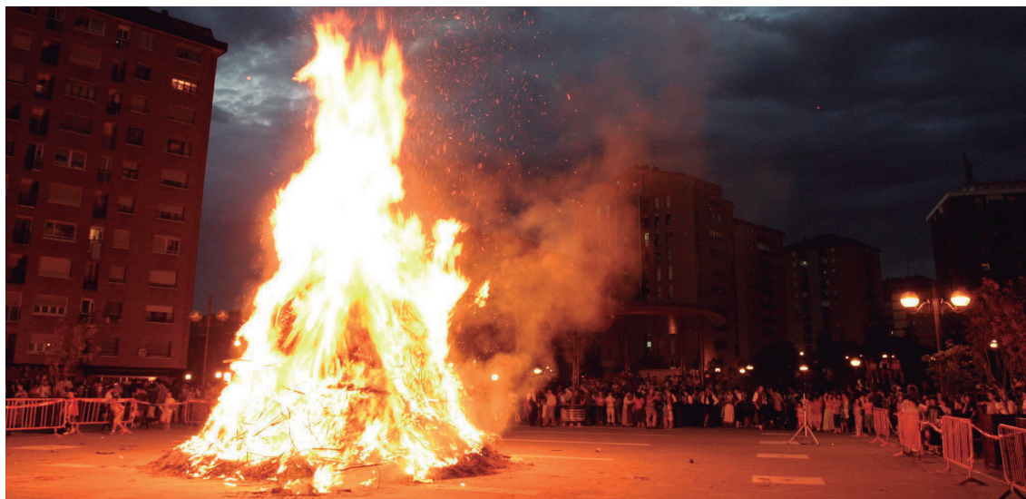
Hainbat urte eta gero Andatza plazara bueltatuko dira San Joan bezperako ospakizunak, baita sua ere.

Bertan San Joaneko zortzikoa eskainiko du 21:30ean,