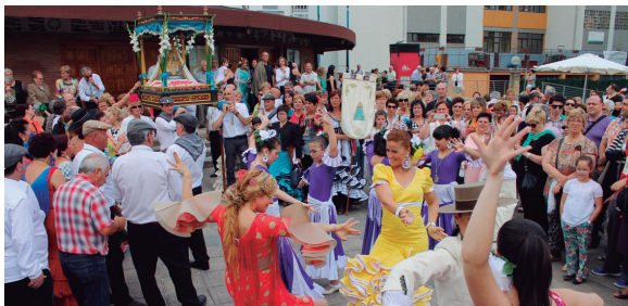
Rocioko erromeriko giroa ekarriko du Semblante Andaluzek Lasarte-Oriara ekainaren 13 eta 14an.

12:30ean, Birjina aterako da elizatik eta herri kaleetatik barrena Atsobakar parkerainoko bidea egingo du