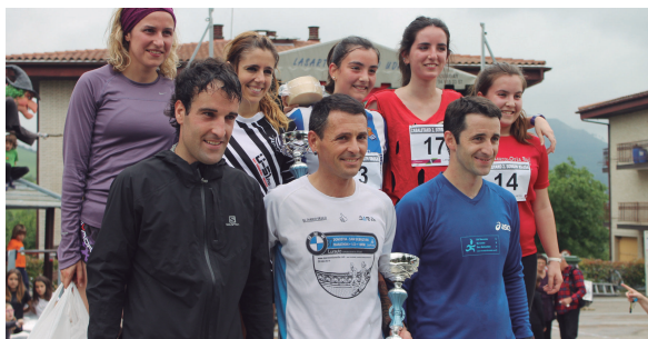
II. Sorgin krosako podiuma osatu zuten neska-mutiak, sariak eskutan dituztelak. Gaztak, txuleetak, oroigarriak...