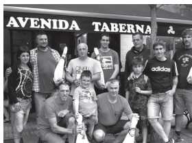
Giroko porraiko sariak banatu zituzten ostiraldean, Avenida.