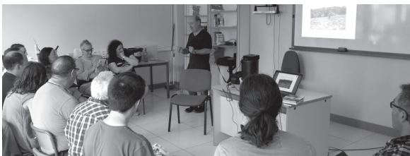
Exeean baratza ekologikoa nola egin eta hainbat gomendio ikasi ahal izan ziren ostiralean.

Zerbitzuan izena emateko merkatariek Sanmarko Markomunitateko 943 21 49