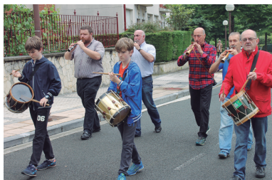
Zabaletako festetako argazki guztiak tintxarri.ueb.org-ean.