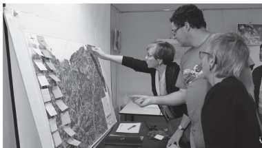
Aldundiko bilera Villa Mirentxun egin dira.

dezakete Astigarraga, Andoain, Lasarte-Oria, Hernani, Urnieta eta Usurbilgo herritarrek.