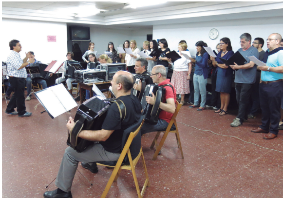
Zero Sette akordeoi orkestra eta Alboka abesbatzako kideak ostiraleko entseguan.

Usadioari jarraituz, ekainaren 23an 21:30etik aurrera ospatuko da San Joan sua Okendon.