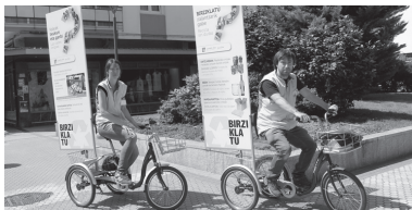
Aste osoan zehar, bi hezitzaile ibili dira herrian komertzio komertzio.

Honetaz gain, hezitzaileak auzo auzo ibili dira triziklo berezi batzuetan eta hauetan gaikako birziklapenari buruzko informazioa zuten. Garraibide berezi hauekin, herritarren arreta bereganatu nahi izan dute eta herritarrek galdetuz gero, birziklapenari buruz zituzten kezak azaldu zizkieten.