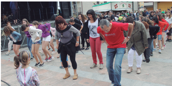
Jendetza bildu da asteburuan Zabaletan prestatu dituzten ekintzetan. Guztiek izan dute gozatzeko aukera.