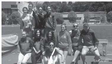
LOKEko neskek, Anoetako Miniestadiko podiumean.

"Eurenak ez diren disziplinak egin behar izan dituzte denek, elkartzan handia erakutsi dute eta emaitzengatik baino, harroago nago neskek erakutsi duten