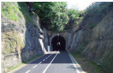
Maiatzaren 18an zabaldu zen bidegorri berria.

"Gure iritziz, poza ondo justifikatuta dago. Izan ere, bidegorriak hausti du Lasarte-Oriaren isolamendu ulertezina. Ulertezina diogu, ulertezina baita herriatik Errekaldera joateko (2,5 kilometro) derrigorrean autoa, autobusa edo trenatu behar izatea. Orain, aldez, bidegorri berriari esker, oinez edota bizikletaz modu zuzen eta seguruan joateko aukera dugu, eta Errekaldeetik barrena Donostiaraino (eta alderantziz, jakina). Beraz, esan bezala, poza ondo justifikatuta dago. Baina, aldi berean, bidegorri berriari argi erakusten du lana ezin dela inolaz