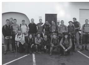
Sokoatik Donostiarainoko bidea egin zuten mendi sailak.

Hondarribiara pasa ostenan, Jaizkibelen labarretatik bide ikusgarria egin zuten Pasai Donibaneraino. San Pedroa