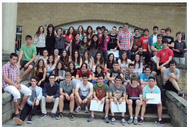
2014-2015 ikasturtean Batxilergoa amaitu duten ikaslearen argazkia.

Batxilergoa amaituta, bizi-tzako ziklo bat itxi eta berriei ekitea tokatzen zaie Lasarte-Oria eta Usurbil BHI Intitutuan. Batzuek Unibertsitatera joko dute aste honetan bertan egingo duten Selektibitate azterketak pasa ostean. Beste batzuek aldez, Goi-mailako Lanbide Heziketa eraman dute izana. Baina denek dute aurrean landu beharreko bide bat, etorkizun bati.