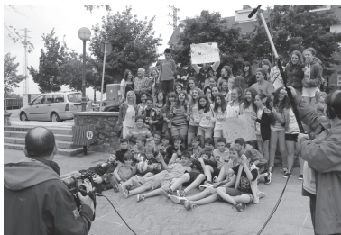
ETB1eko Gu ta Gutarrak saioko kamerak Zabaleta auzoan izan ziren ostiralean.