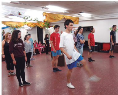
Erketze DTko kideak buru-belarri ari dira soka dantza prestatzen.

Dantzak amaitzean, kalejira herrikoia egingo dute eta 22:00etan sua piztuko da, ohitura den moduan.