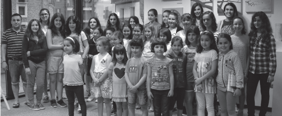
Ikasleek pozik agertu ziren egindako lanarekin eta baita erakusketak izandako harrerarekin ere.

Brancussiko ikasleek ikasturteari amaiera eman zioten ostiralean Merzero aretoan jarritako erakusketaren azken egunean. Bertan izan dira 60 artista gazteen lanak ikusgai eta ostiraleko hitzorduarekin, bakoitzak bere lana etxera eraman ahal izan zuen.