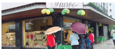
Loidibarren frontoian mugimendua egon zen, baita dendetan ere.