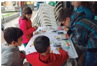
Plastilinoz panpinak egiten zikindu zituzten eskuak haurrek.