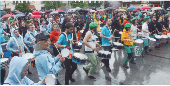
Egun osoan eutsi bazien ere, arratsaldeko emanaldia euripean egin behar izan zuten... Hori bai, umore onean!