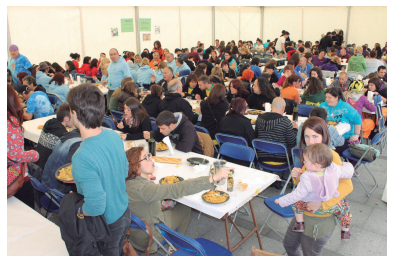
Euskal Herriko 3. Batukaden Topaketako argazki eta bideoak tintxarri.eus webgunean.