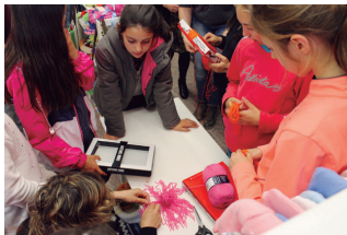
Artilezko irudiak egiteko aukera ere izan zuten.