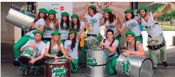
Dinbi Banda aisialdi elkarteko kideek Udalarekin batera topaketa antolatzeaz gain, majo gozatu zuten egun osoan zehar.

Indarrak berreskuratzeko haragi paella edo begetala izan zituzten aukeran parte-hartzaileek eta behin triapak beteta, Okendo ingurua sanbodoromo bihurtu zuten. Jen-dea bide bazterretan perkusio