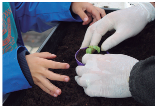
Landaretxo bat ere etxera eramán zuten askok.