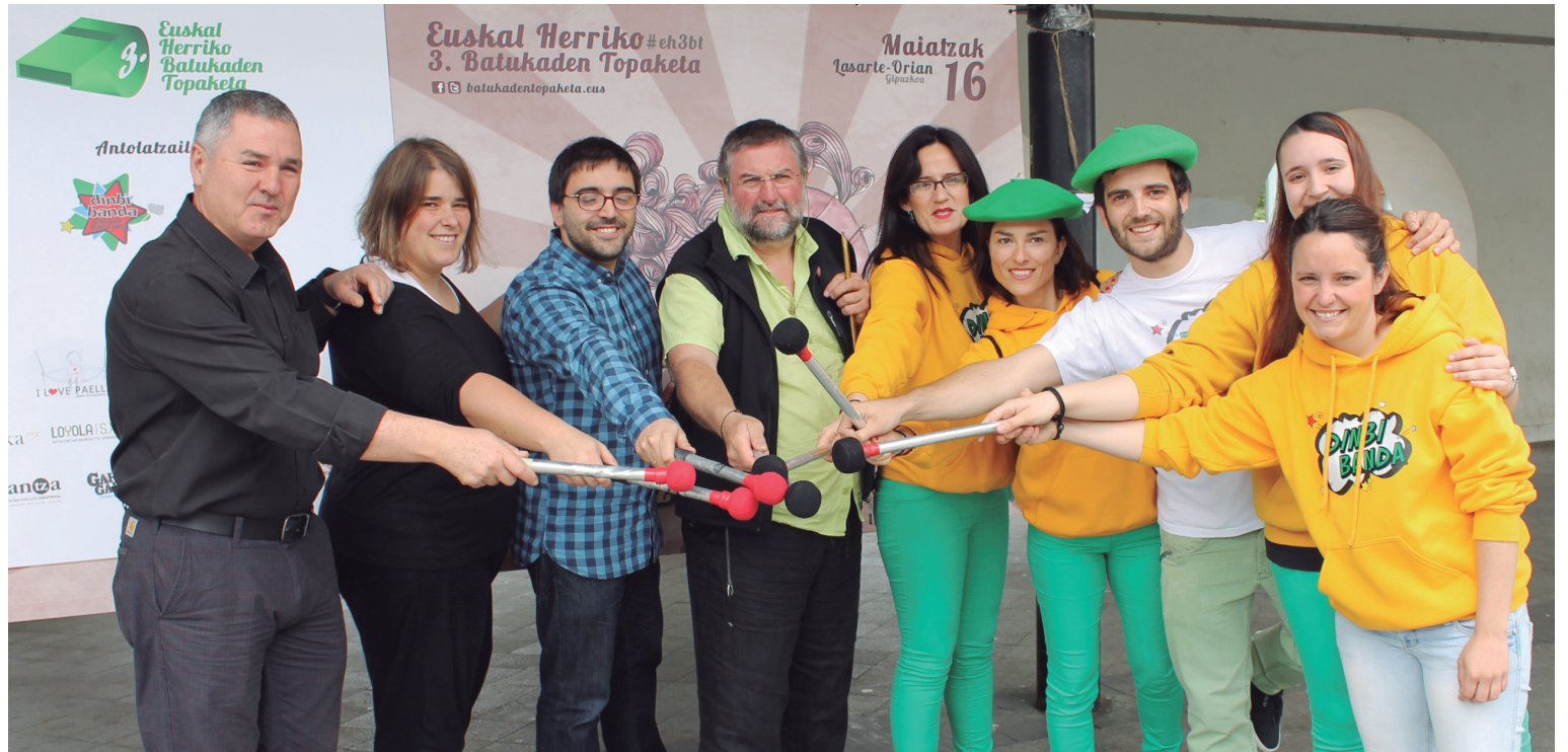
Dinbi Bandako kideek aurten ere argazki lehiaketa abiatu dute, larunbateko argazkiak maiatzaren 23a baino lehen bidali beharko dira info@batukadentopaketa.eus helbidera.

170 perkusio-jole batuko dira bihar Okendo eta inguruetan