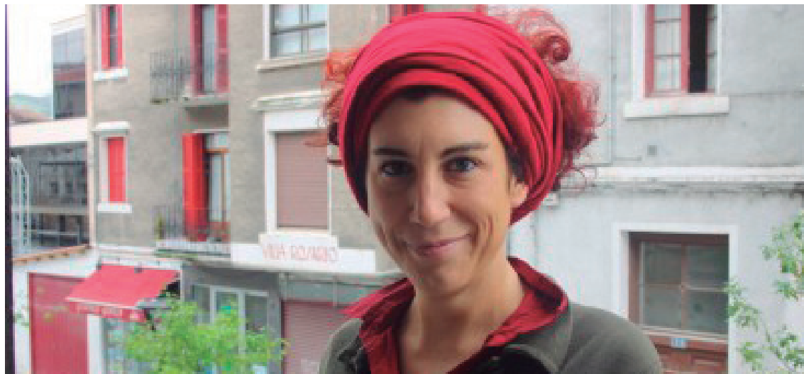
Jule Goikoetxeak ikerketa arloan lan egiteaz gain, Lauaxeta poesia saria eskuratu du 'Traktatus' lehenengo lanari esker.

'Euskal Estatugintza feminista' izango du hizpide