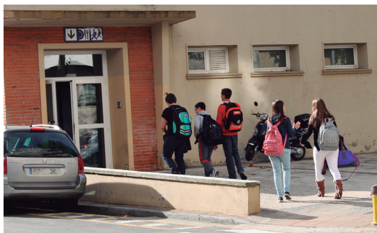
Oinez edo autobusen mugitu behar dira haur eta gazteak bazkaltzera joateko.

Batzordean jakitera eman bezala, Gipuzkoako Delegaritzan, maiatzaren 7an izandako bileran, beste gaiekin