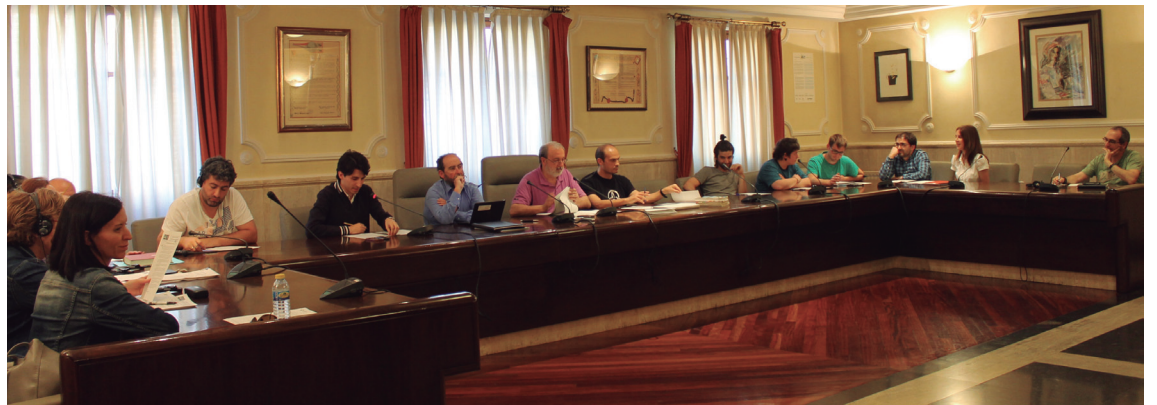
Ekaineko ohiko bilkura ez da egingo udal berria osatzeko datekin bat egiten duelako.

Jarraian, PSE-EEK ere Lanbide herrian zuen formazio zentroaren itxieraren inguruko mozioa aurkeztu zuen. Hain zuzen, herrian dagoen langabezia tasa dela eta zentroak for-