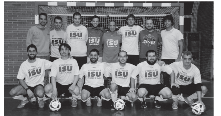
ISU Leihoak taldeko jokalariek, 2014/2015 denboraldiko talde argazkian.