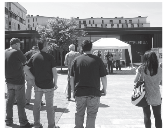
EHBilduk bizikleta martxa egin zuen larunbata goizean. Igandean, Lasarte-Oria Ahal Du taldeko lagunak Jaizkibel plazan izan ziren.