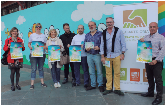
Aterpeko kideak Dorre parkean asteazkenean egindako agerraldian.

Kalejaren ibiliko dira herrian barrena ere Tiririkitarrakako trikilitari eta pandero joleak 18:30etatik