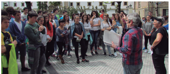
Landaberri BHko ikasle talde batek egin zuten Isladako kideekin ibilbidea.

Ibilbidean, fusilamenduak izan zirela gogoratu, guda lekuak zein izan ziren adierazi eta bando errepublikanoko kuartelak eta militarren aginte lekuak kokatu zituzten. Beste beste, barrikadak, sindikatu eta alderdi politikoaren egoitzak, bonbardatutako etxeak eta Hipodromoko hegazkin zelaia ere aipatu zituzten.