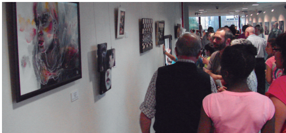
Jende asko bildu zen atzo iluntzean Mercero aretoan, herritarren dozenaka obrez gozatzeko.

Lasarte-Oriako Udalak eta Artisten mahaia antolatutako ekimen honekin, herriko artisten ahalmena erakutsi eta kul-