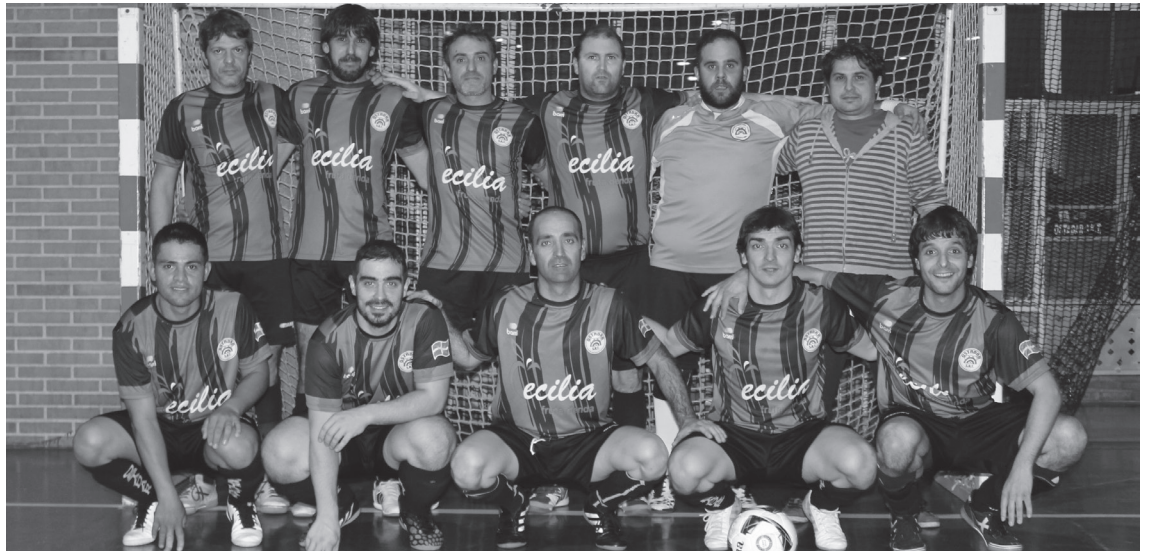
Ostadarreko jokalariek joan den asteko Umore Onaren aurkako partidari ekin aurretik.

Izan ere, azken hamarkadetan estu loturik egon da gure herria areto-futbolarekin, baina azken aldian ez dira areto-futbolaren garairik onenak Lasarte-Orian. Herriko txapelketako talde kopurua izugarri jaitsi da eta talde federatuak mantentzeak sekulako esfortzua eskatzen dio kirol hau maite duen herritar talde honi. Dena den, ez daude etsitzeko: "Jokalarien ahalegina antolatzaileenarekin batu behar dugu, eta halako play offak jokatzeak indarra ematen digu aurrera jarraitzeko", adierazi dute.