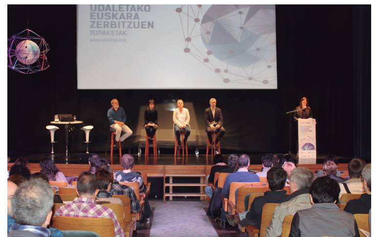
Harrera ekitaldian, jardunaldien antolatzaile eta laguntzaileek izan zuten hitza.