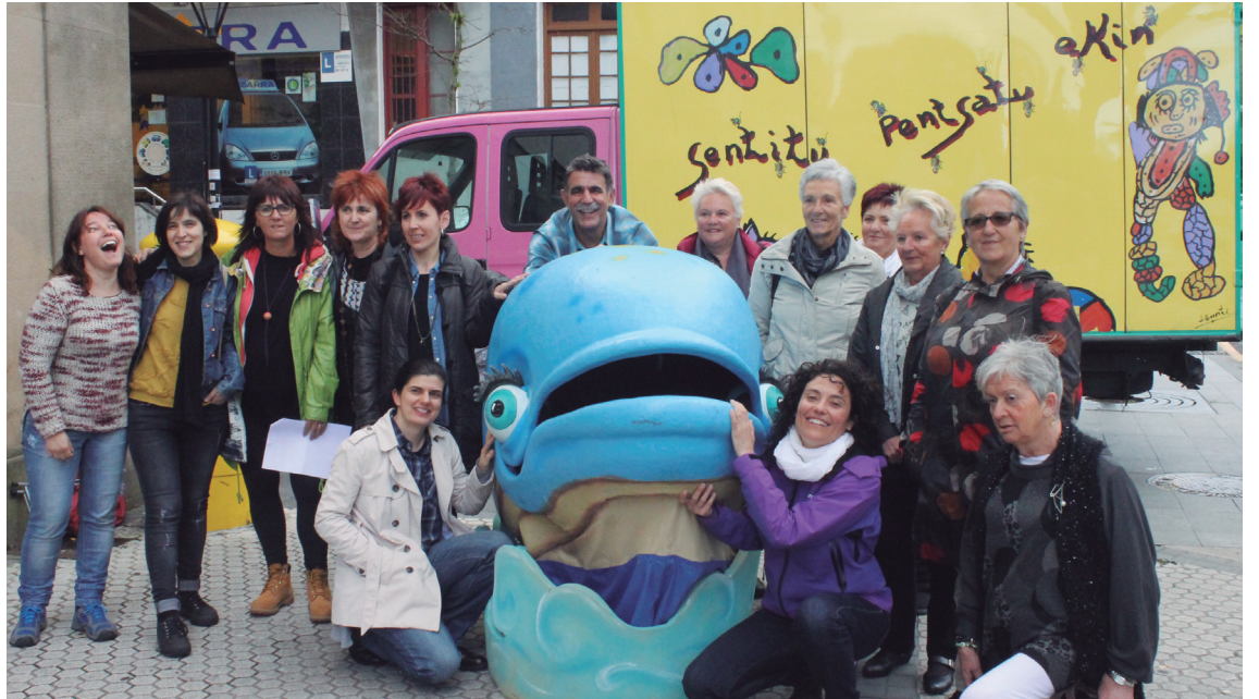
Joan den astean aurkeztu zituzten Irakurle Txokoaren ikasturte amaierako ekitaldiak.

"Laguntza emateko prest agertu ziren herriko pailazoak eta guk, esker onez, onartu egin genuen eskaintza", diote Irakurle Txokoko kideek.