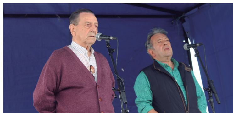
Musikak girotu zuen jaia eta bertsolariek amaiera borobila eman zioten.