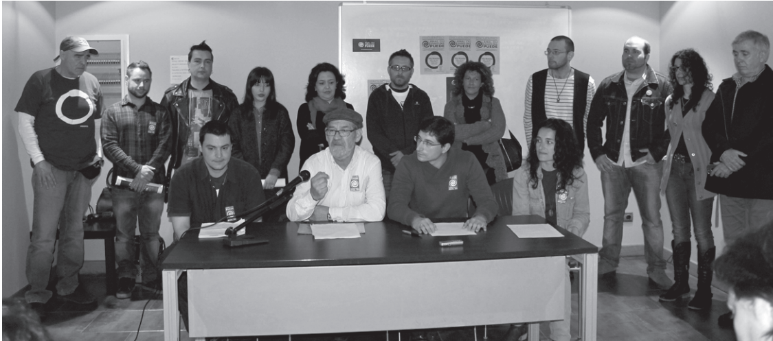
Lasarte-Oriak Ahal du hautesle-elkarteak udal hauteskundeetarako zerrenda aurkeztu eta bere programa azaldu zuen.

Maiatzaren 24ko hauteskundeetan Lasarte-Oriak hautesle elkarte berria egon daiteke. Lasarte-Oriak Ahal du elkarteak bere hautagaitza aurkeztu zuen larunbatean Villa Mirentxu egoitzan. Gardentasun eta aldaketa politikoaren alde agertu zen taldea eta programa herritar eta elkartearen proposamenekin osatu dute. Hauteskundetan egoteko herritarren laguntza behar dutela jakitera eman zuten ere, 500 sinadura.