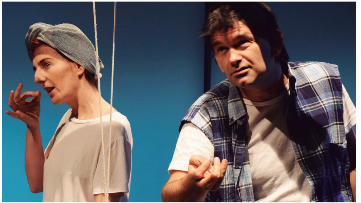
Martxorako iragarritako saioa ezin izan zen egin baina asteazkeneko hitzordua ziurtatuta dago.

Bat-bateko iradokizunak izango dira eta nahi duenak, praktikan jarri ahal izango ditu aldaketa horiek, taula