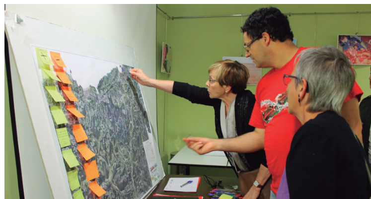
Aldundiak autobus zerbitzua hobetzeko saioak egin zituen gurean.

Herritarrek martxoan, Gipuzkoa Berria aldizkariarekin batera etxetara bidalitako eskuorria beteta egin dezake-