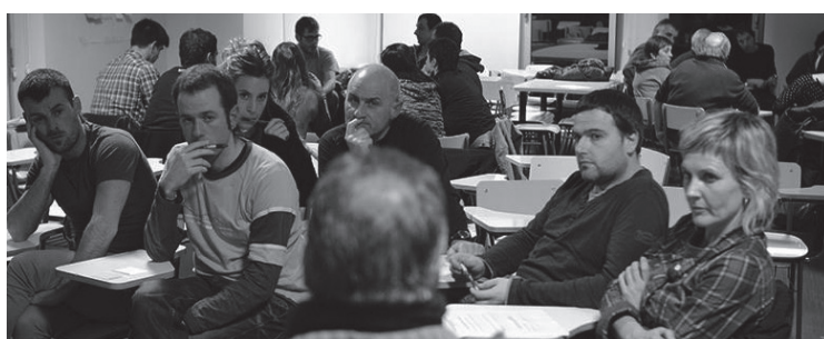
Hainbat bilera egin zituzten EHBilduk zerrenda eta programa osatzeko.

Lanketa fase honetan ere herritarren parte hartzea nahi