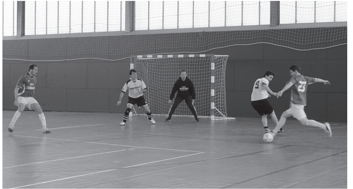
Larunbatean Txindoki tabernako jokalariek nagusi izan ziren Indaux taldearen aurka.

Trumoi eta Indaux taldeek txapeldunen fasean egoteko ahaleginak egingo dituzte, baina ez dute lan erraza izango. Jardunaldi hau jokatu aurretik, sei puntutara Reformas Lagunak taldea eta zazpira Viña del Mar taldea zituzten. Hala ere, Trumoi tal-