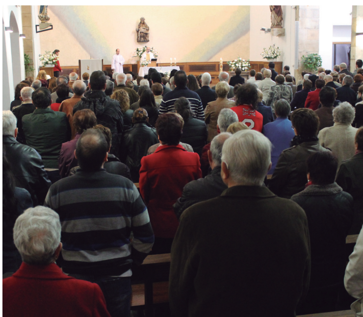
Igandeko meza nagusian eliza goraino beteta, Jesusen berpizkundea ospatzeko.