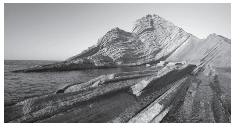
Zumaia flysch-a ezagutzeko Oinatzeneko lagunek. ALGORRI INTERPRETATIO ZENTROA

Talde sozialistak ez du baztertzeko Hauteskunde Batzordearen aurrean salaketa jartzea, behin zerrenda guztiak ofizialki osatzen direnean.