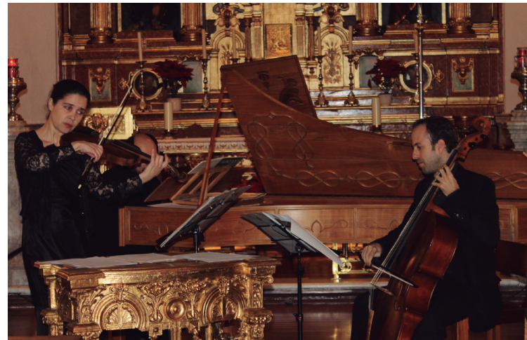
Ars Combinatoria taldea herrian izango da bigarren aldiz.

Larunbatean, apirilaren 18an berriz, Ars Combinatoria taldearen emanaldia izango da San Pedro elizan. Talde madrildarra herrian egon zen urtarrilean Danok Kideren eskutik Brigitarren komentuan. Ibilbide luzeko taldea da. 1991n jaio zen Ars Combinatoria. XVI. mendeko polifonia espainiarra abesteko, J.S. Bach konpositore ezagu-