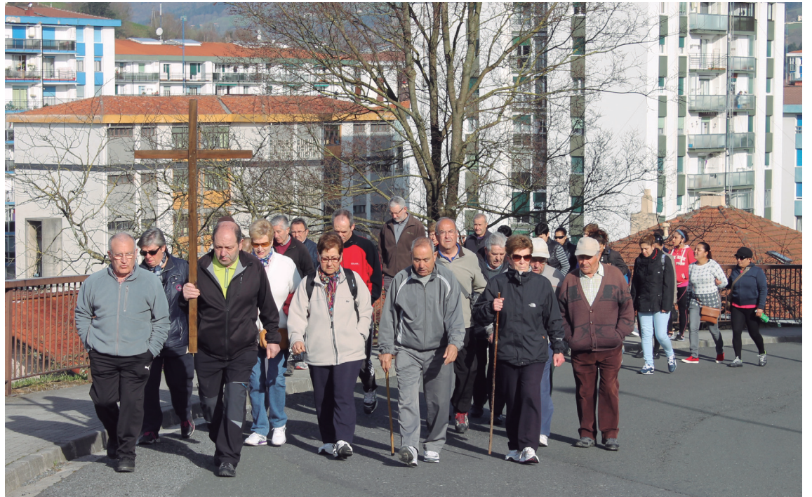
Eguraldi zoragarria lagun, Zumaburuko elizatik Azkorterera egin zuten Gurutze Bidea hainbat herritarrek.