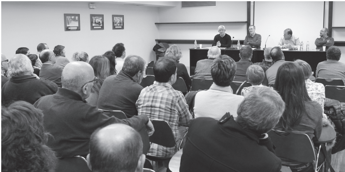
Manuel Lekuona kultur etxeko hitzaldi aretoan 40 lagun bildu ziren, Elkarbizi plataformaren saioan.

'Bakerantza-Al final del túnel' dokumentala ikusi eta eskal jendartearen elkarbizitzari buruzko solasaldia egin zuten Manuel Lekuonan joan den astean. Ia bi orduko dokumentalean, sufrimenduaren hainbat aurpegi eta ertz ikusteko aukera izan zuten Elkarbizi plataformak antolatutako saiora bertaratu ziren 40 lagunek.