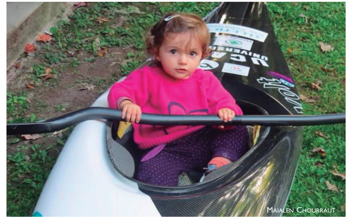
Chourrautek judoa, igeriketa eta atletismoa probatu zituen goi-mailako piraguista izan aurretik, kirolari sena du alabak ere.

Hala ere, 2017an Paun Munduko Txapelketa da, gainera Frantziatik antolatzen dituen lehiaketak sekulako txapelketak izaten dira, hori