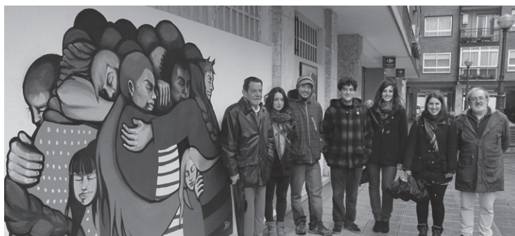
Lehenengo saria eskuratu duen muralaren ondoan atera zuten talde argazkia.

Alkateak guztien lana baloratu, eskertu eta "udaberriaren etorrerarekin" alderatu zituen lanak. "Helburu hirukoitza zuen lehiaketa