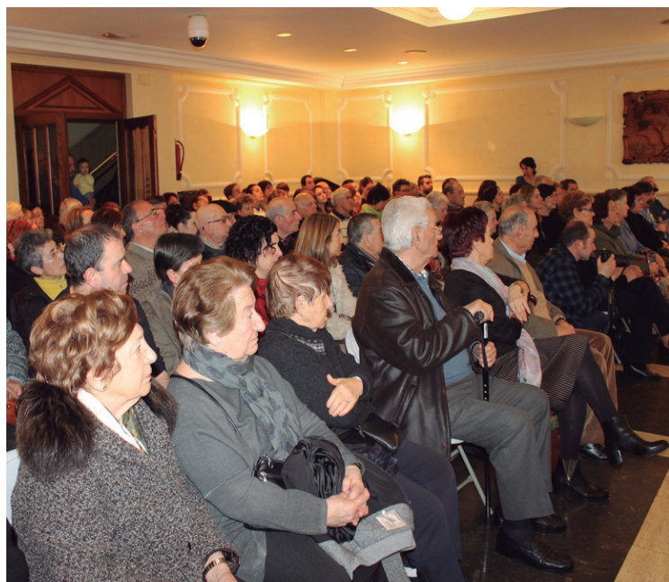
Jendetza hurbildu zen pleno aretoan ospatutako omenaldira.

Aspaldi ikusi gabeko bizilagunekin hitz egiteko parada izan zuten batzuek eta guztiek, iragan hartako gertaerak gogora ekarri ahal izan zituzten.