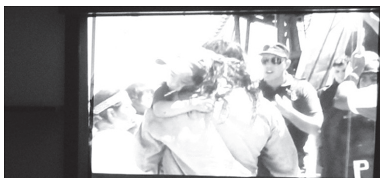
Haustura hidraulikoak eragindako kalteak islatu zituzten hitzaldi aretoan.

Petrolio-erazketa mota bat da frackinga. Haustura hidrauliko bezala itzuli liteke euskarara. Fracking-a, zentzu zabalean, presio hidraulikoaren bidez arroka apurtu, arrokan harrapatutako gasa edo petrolio askatu, lurrazalera bideratu eta merkaturatzeko asmoa duen teknikari ematen zaion izena da. Ekozinemaldiaren bidez, instituzioen eta petrolio-enpresen arteko "harreman ilunak" salatu nahi izan dituzte Ekologistak Martxan taldeko kideak. Azken urteotan garatu