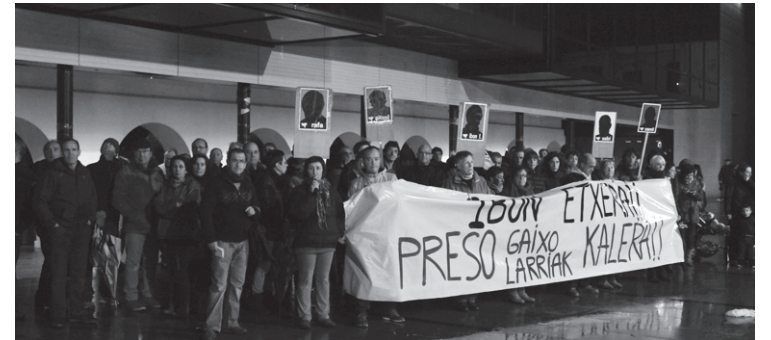
Okendon ostiralean burutu zen elkarretaratzea presoaren egoera salatzeko.