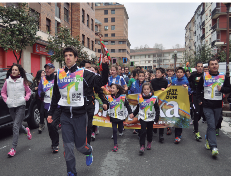
Elkarte gastronomikoetako ordezkariak eskutik eskura pasa zuten lekukoa.