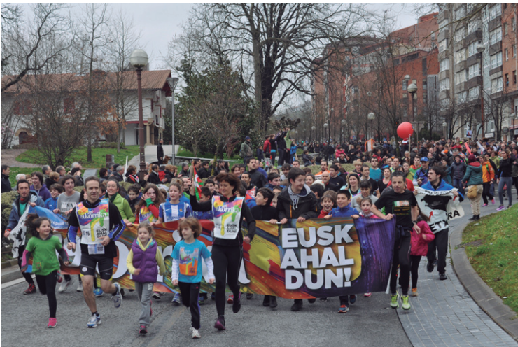
Landaberri guraso elkartekoen atzetik jendetza.