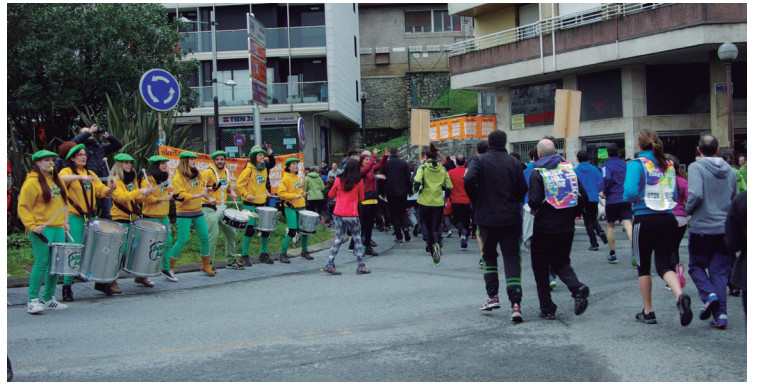
Txistulariek diana jo zuten eta Kantu Jiran parte hartu, Dinbi Banda Korrika girotzen.