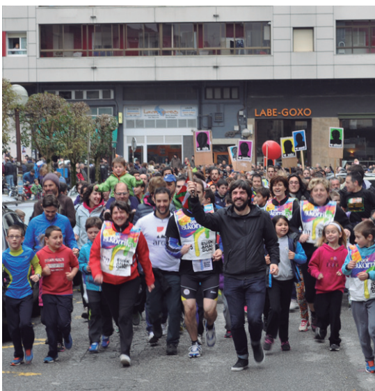
Antza eta Argiako langileak lekukoa hartzen aurreratu ziren. Ttakuneko kideek aldapan gora eraman zuten lekukoa.

Korrikak ordu betean osatu zuen 9 kilometroko ibilbidea, herritar askorentzat "bixiegi" aukeran. Herritar ugarik parte hartu zuen 19. edizio honetan eta beste behin, une hunkigarriak bizi ahal izan ziren jendez betetako kaleetan.