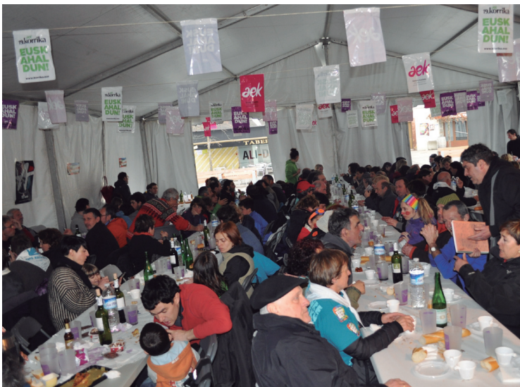
Bazkari herrikoa egin zen Korrikaren ostean Okendon jarritako karpan.