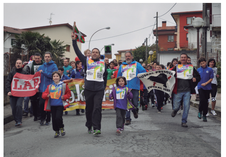
Herriko LABeko kideak Buenos Airesetik behera.