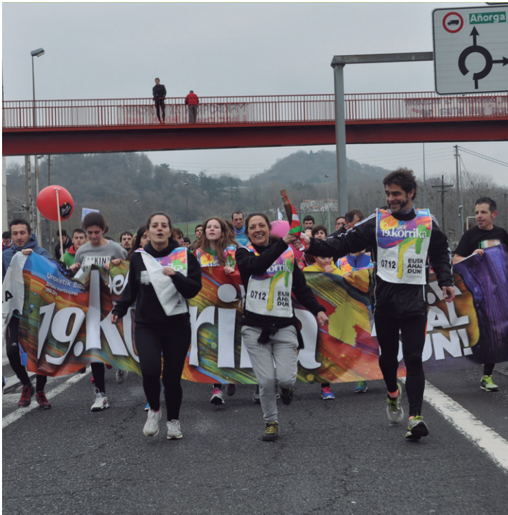
AEK-Muntteriko ikasleak izan ziren Errekalden lekukoa hartzen lehenak.