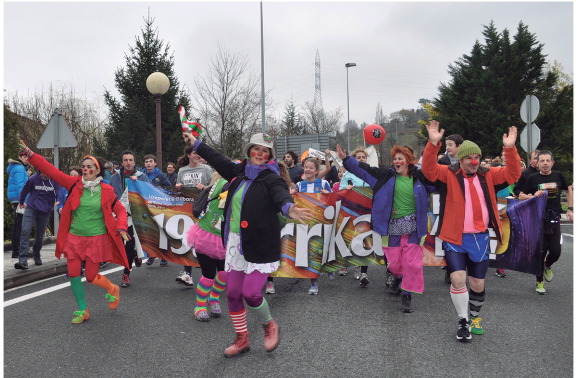
Kukuka antzerki eta dantza eskolako ikasleek kolorea jarri zioten euskararen aldeko lasterketari.