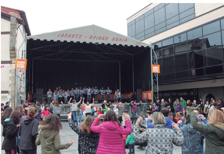
Jolasak eta erromeriarekin amaitutzat eman zen jai egun berezia.