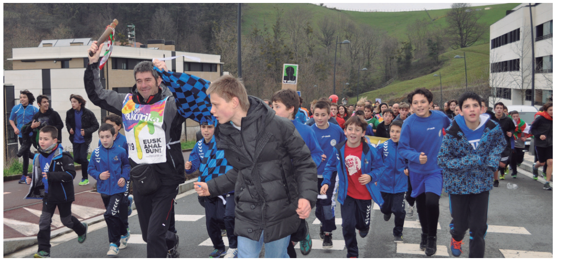
Ostadarren ordezkariak tenis eskolako lagunak izan ziren aurtengoan, kirol elkarteko bandera ederki astindu zuten.