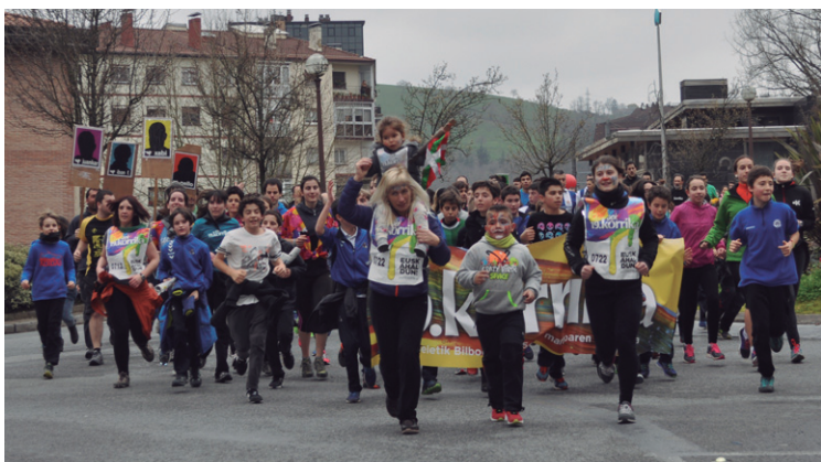
TSSTko langileen ibilbide zatian txikienak protagonistak.