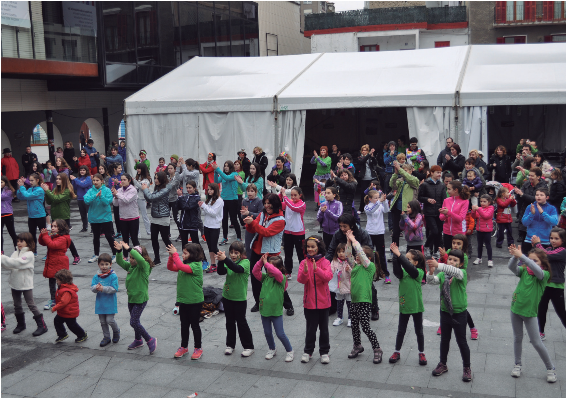
Beroketa saio jendetsua egin zen Okendon Enara Yeregik gaztetxo talde baten laguntzarekin gidatuta.