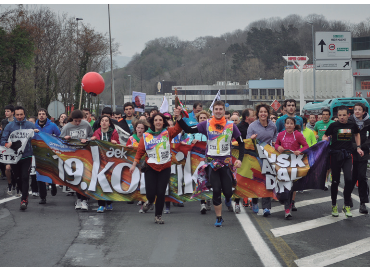
Ernai eta Sorgin Jaikoek ekarri zuten Korrika Lasarte-Oriara.