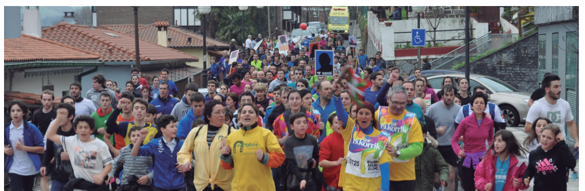
Udalan dauden alderdi guezietako ordezkariak izan ziren euskararen alde korrika, behean Aterpeako kideak.