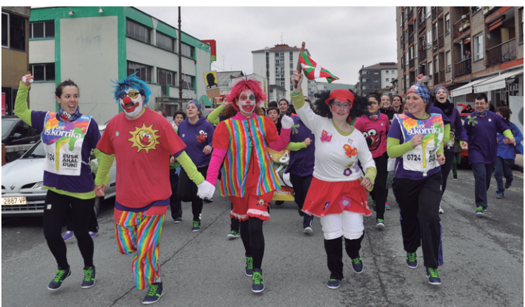
Jalguneko lagunak izan ziren Pirritx, Porrotx eta Marimotots.