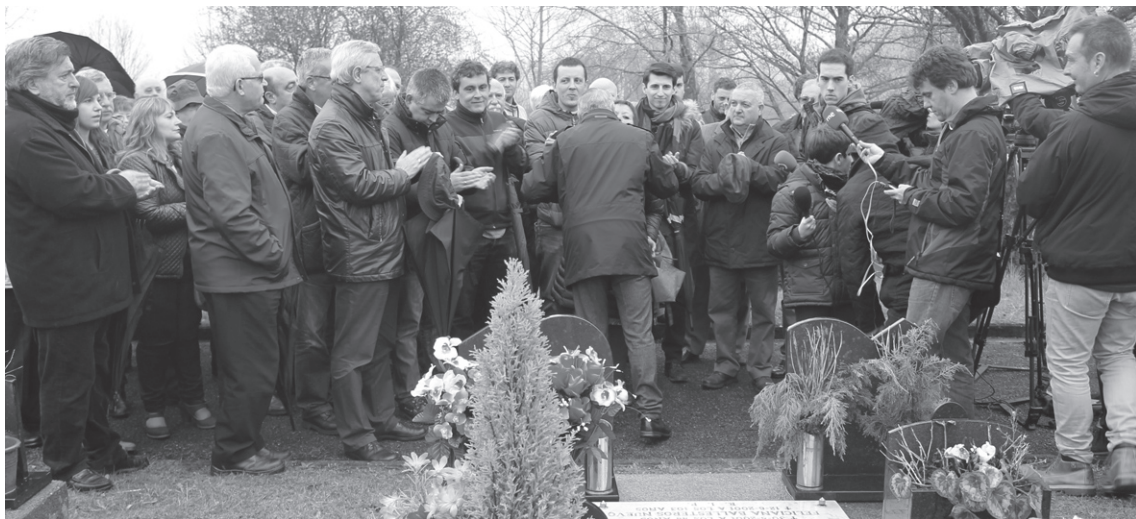
Hilerrian lore eskaintza egin zuten familiako kideek PSE-EEko hainbat ordezkarien babesarekin.