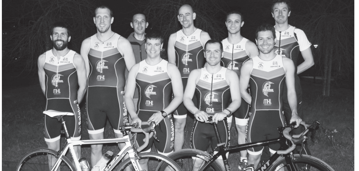
Saiatuz Triatloi Taldeko kide batzuen talde-argazkia, taldearen denboraldiaren aurkezpenean.

Maiatza aldera hasiko dira probak, eta nahi duenak denboraldia irailera arte luzatzeko aukera izango du. Tartean Euskal Herriko Zirkuituko lasterketak lehiatuko dituzte gehienbat, baten batek Iruñeako Iron Man Erdia, Bartzee-