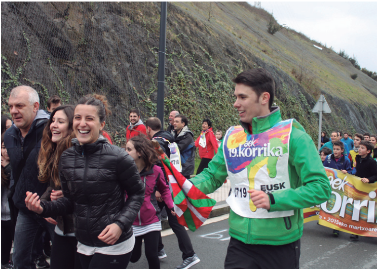
Erketz dantza taldekoak umoretsu Pinutegi kaletik gora.