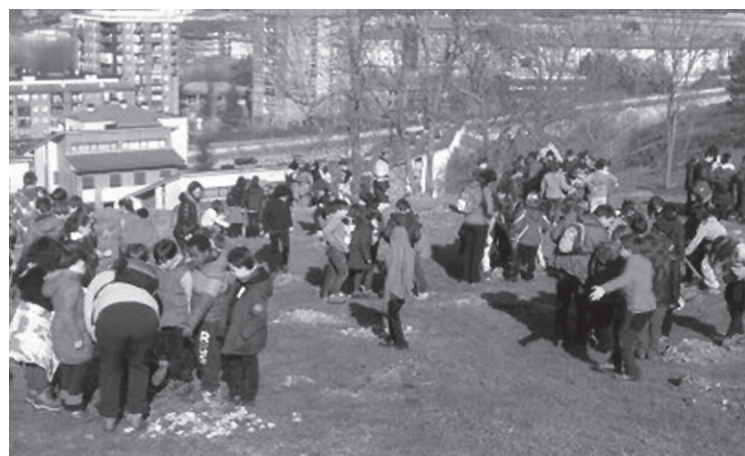
Kimuak landatuz, ikastetxeetako haurrek ederki igaro zuten goiza.

Informazio gehiago eskuratu nahi duenak Ttakun Kultur elkartera hurbildu edo aisia@ttakun.com helbidera mezu bat bidali besterik ez du. Begirale poltsan izena emateko azken eguna apirilaren 17a izango da.