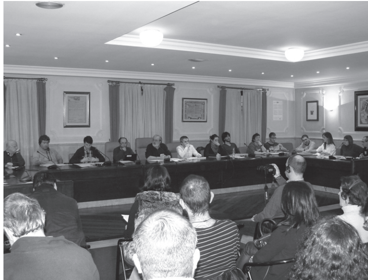
Herritar andana hurbildu zen astearteko plenora.

Gaineratu zuen, "zuzenbidean ezagutzak edukita, esango nuke hobe dela inputatu bezala joatea, lekuko bezala deitua izatea baino. Aldi berean, esan behar da