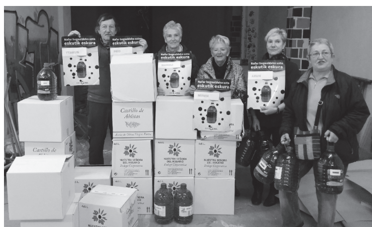
Herritar batzuk Nafarroa hegoaldeko olioak hartzerako joatean ateratako argazkia.

"Denbora gutxian Errigoraren sarea nabarmen sendotu da, baita Lasarte-Orian ere. Aurten gainera eskaerak online egiteko aukera zabaldu