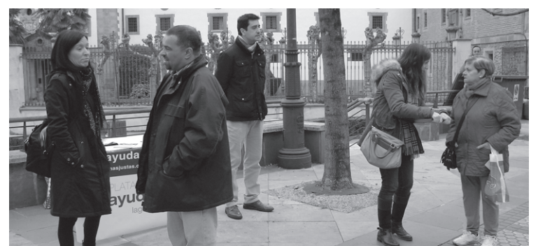
Ayudas más justas-Bidezko laguntzak plataformako kideak merkatuan izan ziren.

Krisi egoera dela eta, oinarriko errenta (OE) jasotzen duten herritar ugari dago. Hauetan iruzurra edo gehiegizko esleipena ekidin eta oinarriko errentaren legeak dituen hutsuneak osatu nahian, Ayudas más justas-Bidezko laguntzak herritar plataformak, legearen aldaketa eskatu nahi du.