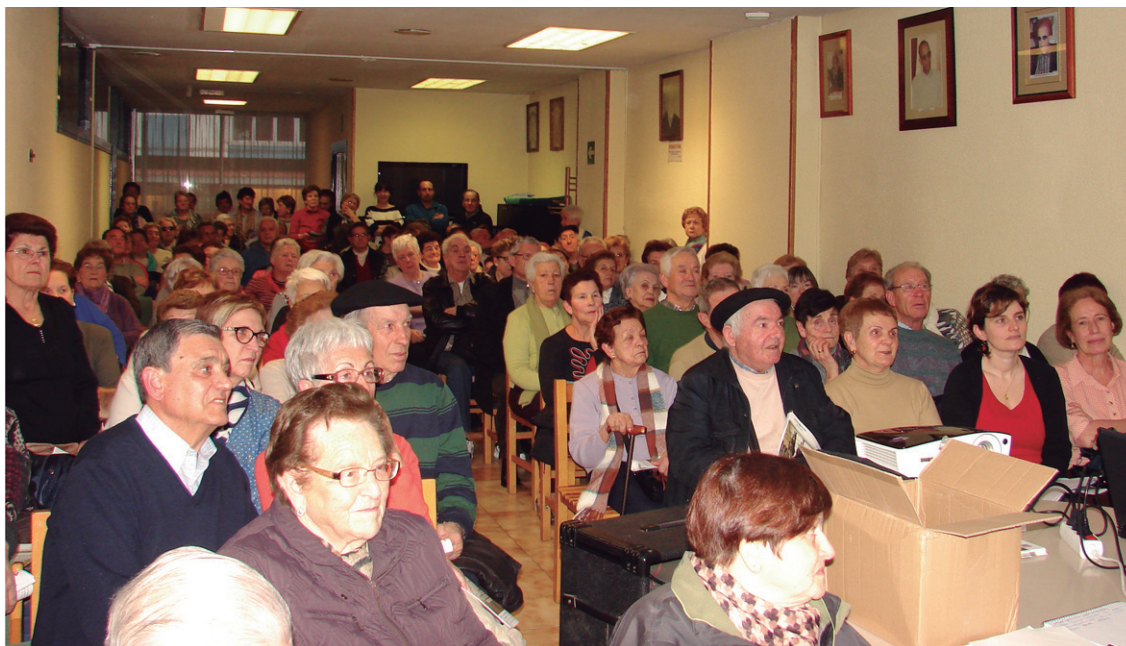
Biyak Bat elkarteko aretoa lepo bete zen eta lekurik gabe geratu zirentzat, beste saio bat antolatuko dute.

eta trasteak kendu baita alfonbrak eta oin-zatarrak, edo sistema irristagaitzekin katigatuta edukitzea gomendatzen da.