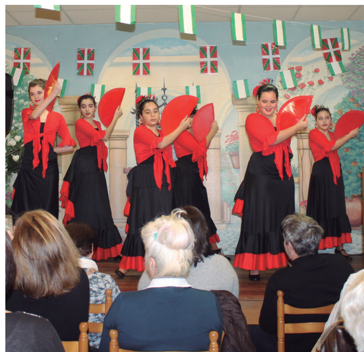
Gitanillos del Alba taldeko gaztetxoak larunbateko emanaldian.