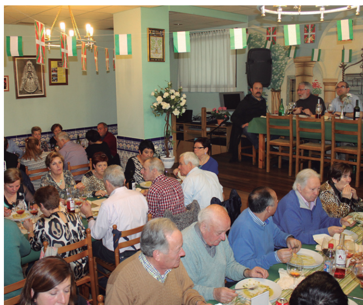
Bazkari ederra egin zuten atzo elkarteak.