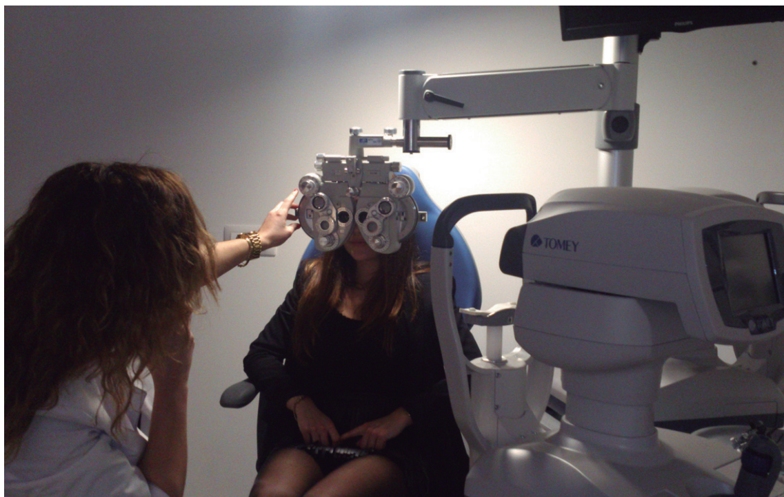
Ikusmenaren azterketak egiteko puntako teknologiako tresnak jarri dituzte.

Hori dela eta, dendara gerturatu eta eskaintzen duten zerbitzu profesionalaz gozatzera gonbidatzen dituzte lasarteoriatarrek.