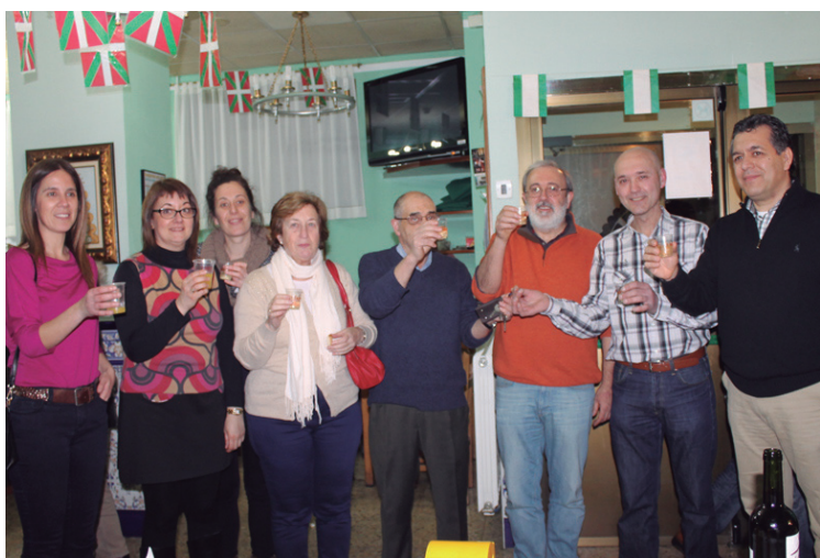
Udal ordezkariekin Aldundiko Itziar Pildain egon zen ostiralean.