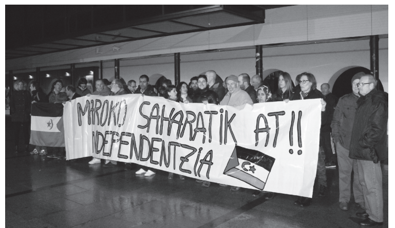
Ostiral iluntzean elkarretaratzea egin zuten hainbat herritarrek Okendon.

Maroko Saharatik at!! Independentzia' lelopean 40 bat lagun bildu ziren ostiralean Okendon. Tartean ziren PSE-EE, EAJ, EH Bildu edota Podemoseko kideak, hainbat herritarrekin batera.