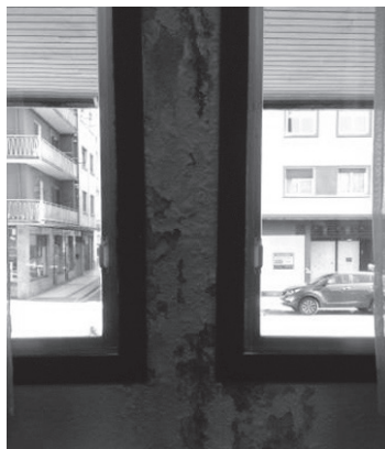
Hezetanunak Biyak Baten.

Azkenik, "Bilduk korrika eta presaka Antonio Mercero Museoko gunea txukuntzeko 19.000 euro gastatuko ditu, hauteskundeak baino lehen eta Udaleko gainontzeko