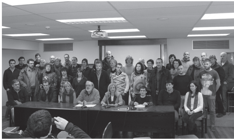
Alkateek Manuel Lekuonan egin zuten agerraldia.

Gipuzkoako EHBilduko 40 alkate eta zinegotzik agerraldia egin zuten Manuel Lekuonan azken hilabete luzeetan eurek kudeatutako udalek Espainiako Gobernu Delegazioa zuzentzen duen Carlos Urquijoren eskutik pairatutako erasoak salatzen, erantzun instituzionala, politikoa eta soziala emateko deia egin zuten.