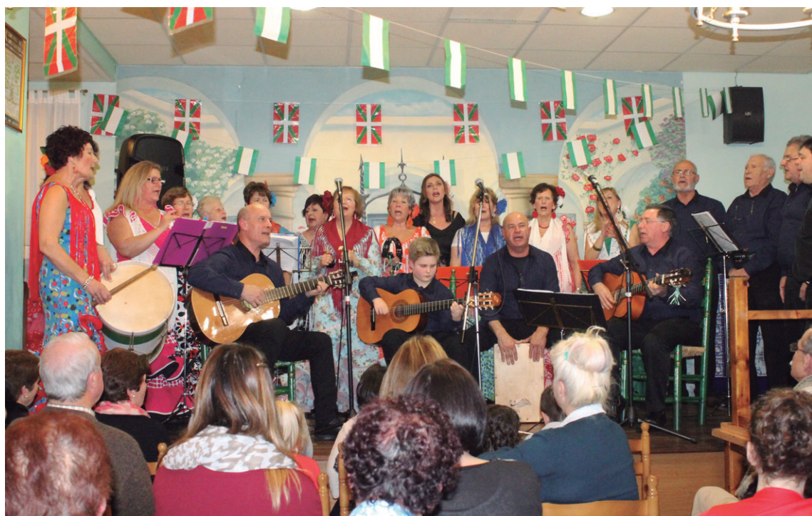
Semblante Rociero koruak emanaldia eskaini zuen dantza erakustaldien artean.