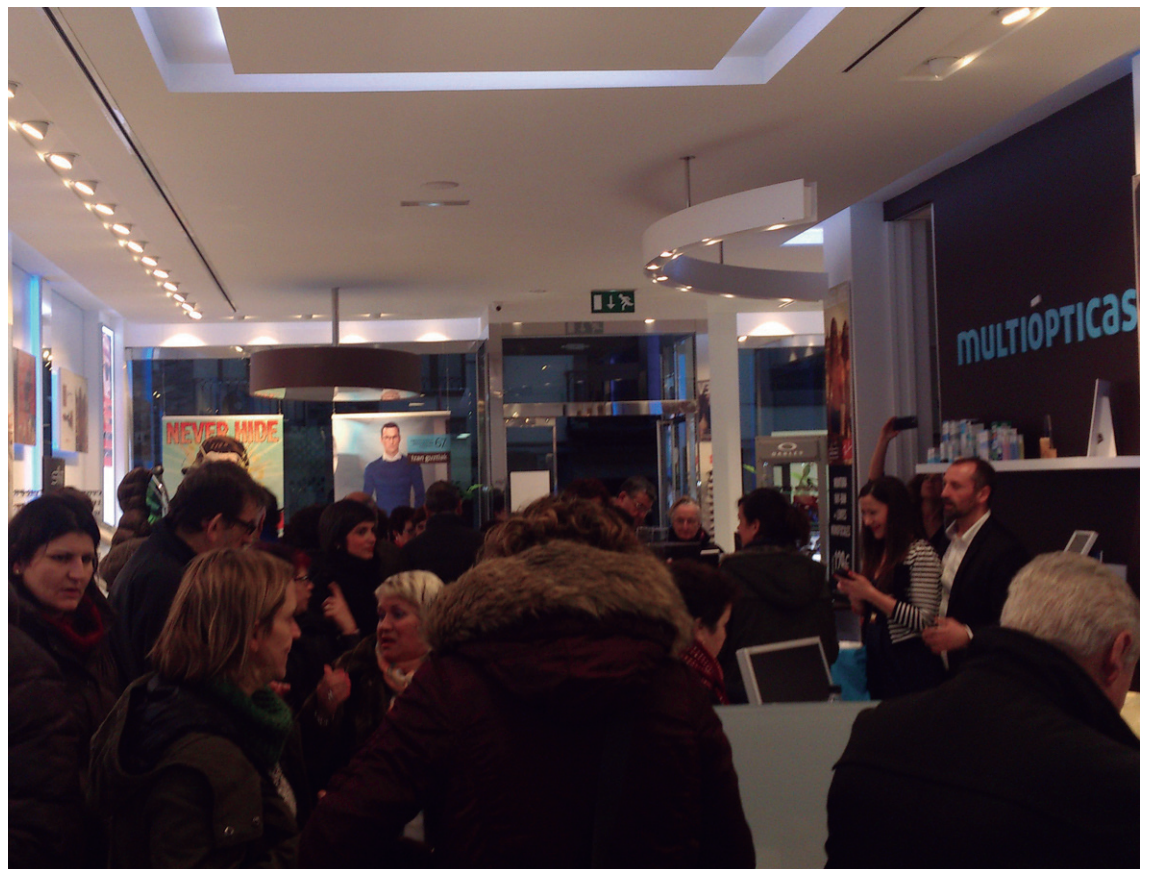
Herritar asko hurbildu zen ostegun arratsaldean egindako irekiera festara.

bere tartea denda honetan, 5 eta 12 urte arteko haurrentzako 'School Visual Test' ize-neko azterketa egiten dute.