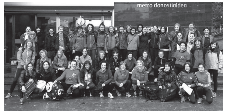
Herriko korrikalariak argazkia egin zuten Euskotrenen.

Fisikoki sentsazioa ez zen guztiz ona izan baina berdindio, lasterketa festa giroan bizitzeko aukera izan genuen