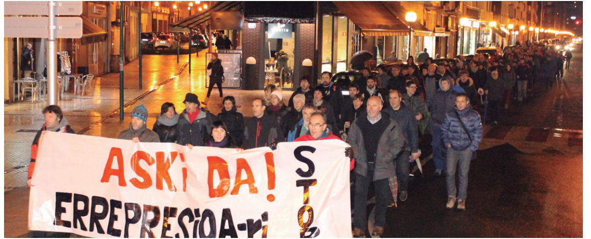
Astelehenean manifestazioa egin zen herriko kaleetan barrena.