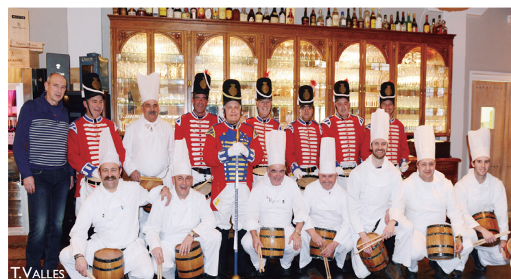
Lasarte-Oriako danborradako hainbat kide ordubetez aritu ziren Araetan.

Araetara bertaratutakoek ikuskizunaz ederki gozatu zuten, giro ederrean, San Sebastian bezperako gauean.