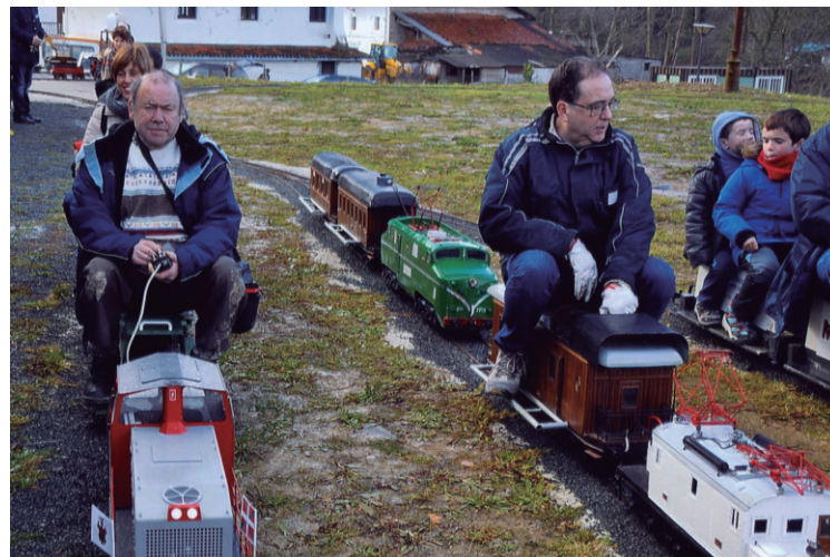
5 pulgadako tren hauetan bidaiak egiteko aukera dute haur zein helduek.

"Zaletasun hau dugunontzat aukera polita da Iraetan sortutako zirkuitua, orain arte leku askotara eraman izan dut