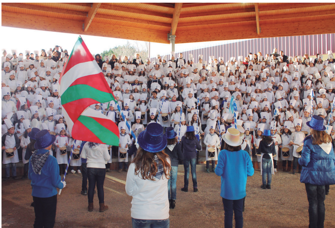
Zuzendariak markatutako erritmoa primeran jarraitu zuten Sasoeta eta Landaberri ikastetxeetako gaztetxoek.