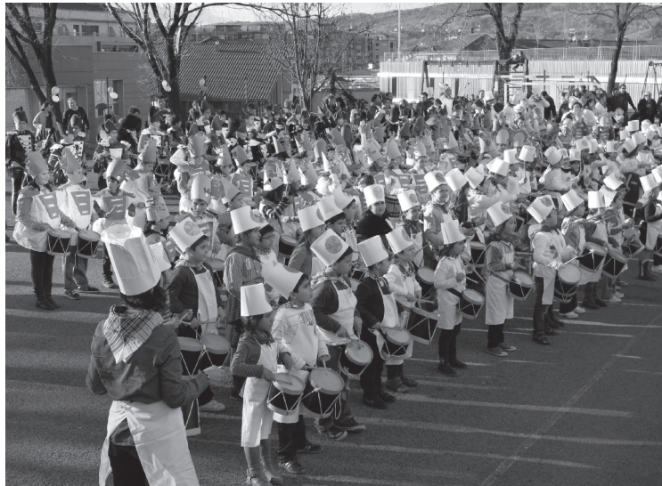
Sasoeta-Zumaburu ikastetxea izango da hasten lehena, arratsaldeko 15:00etan.

Gogor entsegatu dute Lasarte-Oriako ikastetxeetako umeez azken asteetan eta gaurko egunean zehar erakutsiko dute danbor-jole trebeak direla. Bihar da San Sebastian eguna, hilaren 20a, baina herriko ikastetxeek bezperan astinduko dituzte danborrak. Danbor hotsak entzun ahalko dira beraz Zumaburu, Sasoeta, Garaikoetxea eta Landaberri ikastetxeetan.