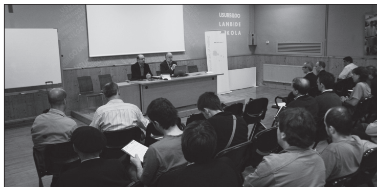
Usurbilgo Lanbide Eskolak ikastaro ugari eskaintza prestatu du.

Honako hauek dira kategoriak: 'Fabrikazio mekanikoa' (10 ikastaro guztira), 'Elektrizitatea eta elektronikoa' (5), 'Energia eta ura' (3), 'Instalazioa eta mantentzea' (5) eta 'Administrazioa eta kudeaketa' (4).