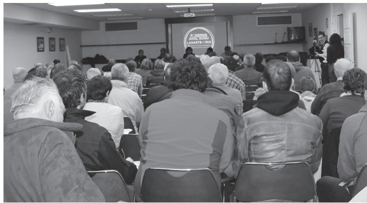
Adin guztietako jendea elkartu zen Manuel Lekuonan Ahal Dugu ezagutzeko.

Herriak egun duen %18 langabetu tasa oso larria dela aipatu zuten eta lehentasunezko gaia izan beharko luke hau euren programan. "Hala ere, hau osatu gabe dago, jende gehiago nahi dugu gurekin gai ezberdinen inguruan eztabaidatu eta programa osatzeko". Prozesu parte hartzaile eta irekia da Podemosek herrian burutu nahi duena, "zerrendak ere hala osatuko dira, hauetan