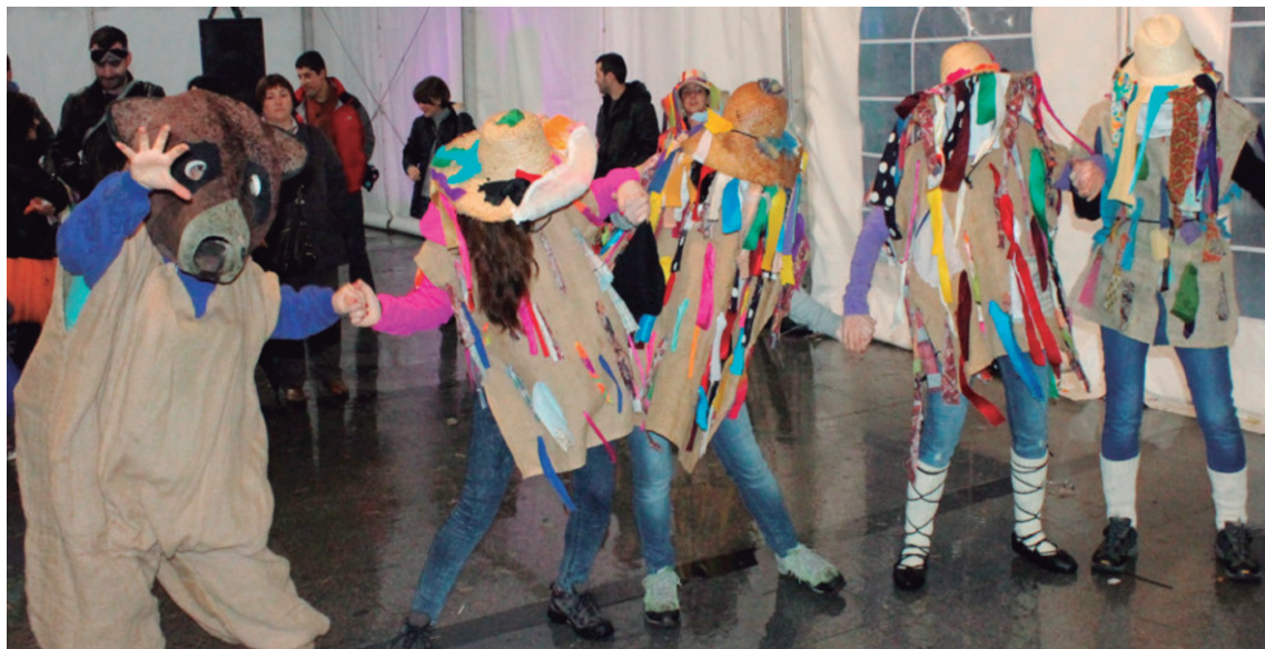
Horrelako txantxo jantziak egitea da Ttakunek antolatutako ikastaroaren helburua.

dagoen bigarren solairuko geletako batean egingo da eta honetan, birziklapena ere landu nahi denez, parte hartzaileei oihal zaharrak eramateko eskatzen zaie.