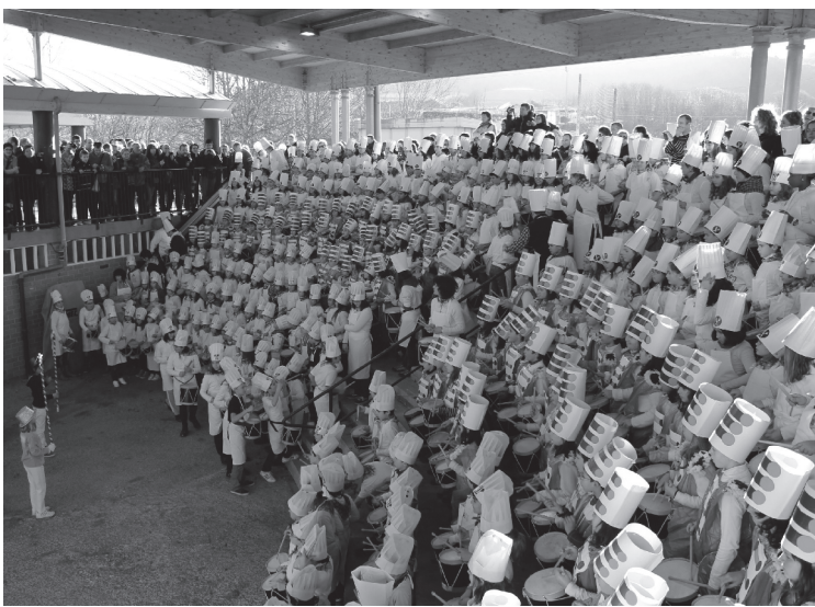
Landaberri-Garaikoetxea ikastetxeetakoak 15:45ean hasiko dira danborrak astintzen.

Zumaburu eta Sasoeta ikastetxeetako gaztetxoak izango dira entsegatutakoa erakusten lehenak. Zumaburukoak 15:00etan hasiko dira danborrak astintzen, eta Sasoeta ikastetxeetako txanda ordu