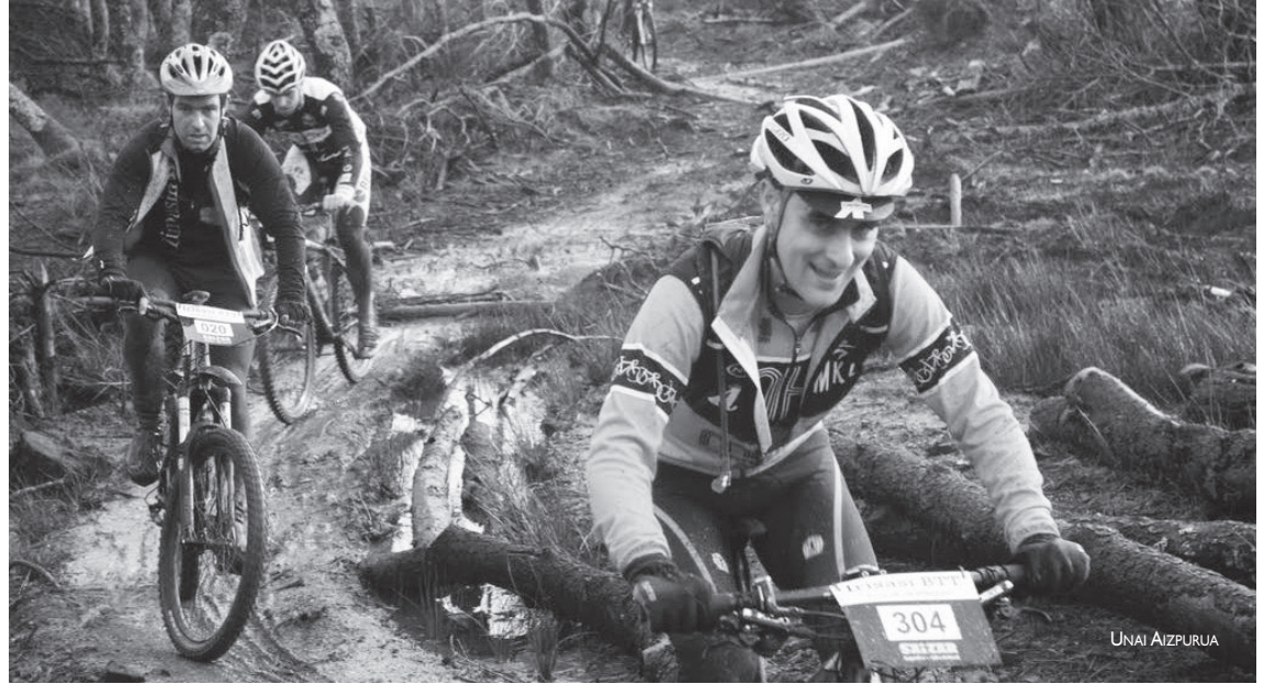
Lasarte-Oriako BTT zaleentzat ezinbesteko hitzordua da Irisasi martxa.

Indarrak berreskuratzeko aukera ere izango da proban zehar. Ibilbideko postuetan janaria eta edari beroa izango dituzte eta proba amaitzean hamaiketako banatuko da txirrindulari guztien artean. Ibilbidean asistentzia-laguntza izango da eta dutxa beroa hartzeko aukera Oiardo kirolde-