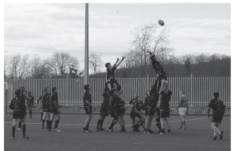
16 urte azpikoak erraz aurreratu ziren markagailuan Gaztediren aurka.

Larunbatean Michelinen errugbi partida ederrez gozatzeko aukera izan zen. Goizean 14 urte azpikoen mailako bi taldeak erraz gailendu ziren Riojaren aurka. A taldeak 28-0eko emaitzarekin amaitu zuen eta B taldeak berriz, 42-0ekoa egin zuen. Arratsaldean, 16 urte azpikoen taldea oso erraz aurreratu zen markagailuan Gasteizko Gaztedi taldearen aurkakoan, partida 61-5eko emaitzarekin bukatu zen etxekeontzat. Eguna ordea ezin izan zuten borobildu izan ere, 18 urte azpikoen mailan, 10-48 galdu zuten etxekeok. Hauek ere Gaztediren aurka neurtu zituzten indarrak.