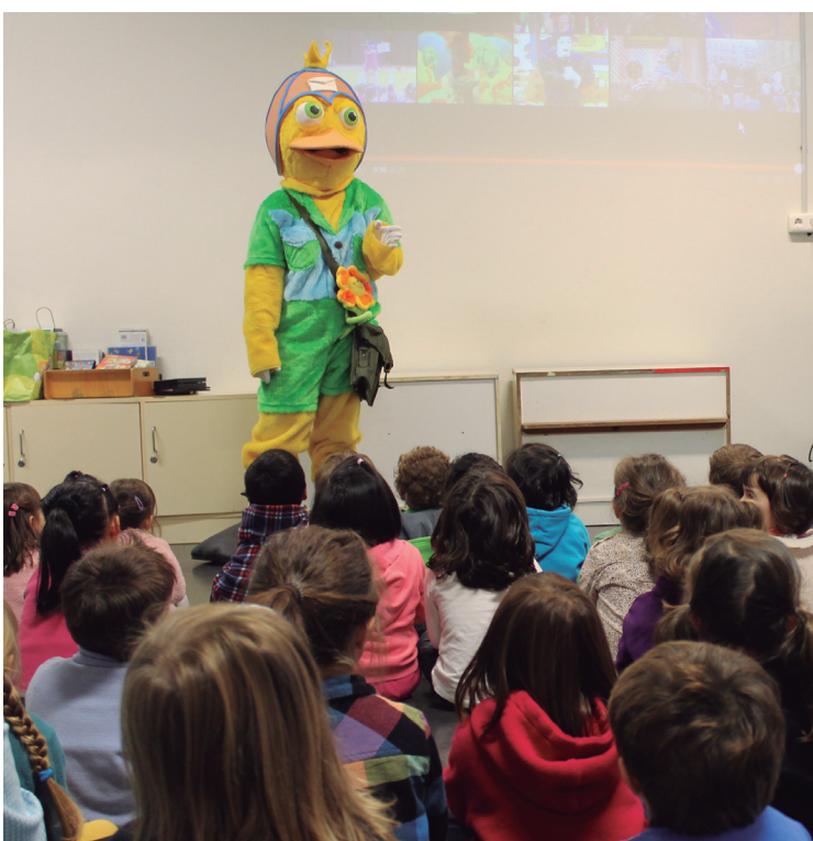
Herriko ikastetxeetako gaztetxoak bisitatu ditu aste honetan Xixuko ahateak.