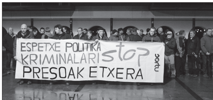
"Espetxe politika kriminalari Stop. Presoak etxera" lelopean bildu ziren hainbat herritar.

Zentzu horretan, Sortuk Alderdi Popularraren jarrera salatu du: "PPren gobernua presoak sortu du egoera hau. PPren gobernua prest dago Europatik datozen