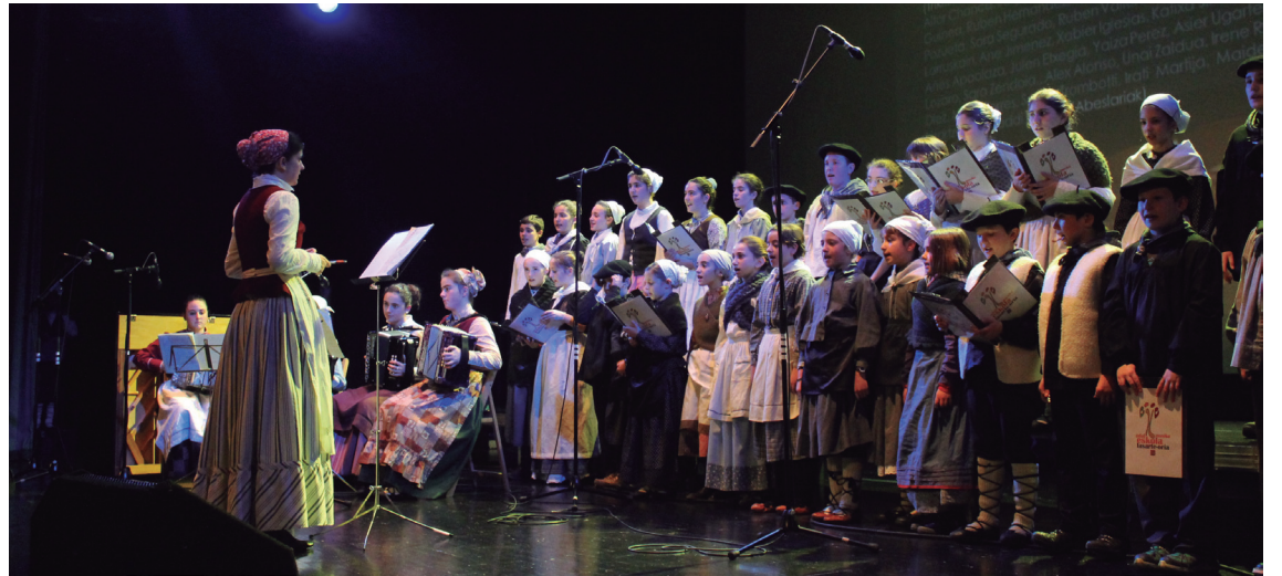
Udal Musika eskolako ikasleek Gabonetako kanta bilduma batekin eman zioten hasiera asteazkeneko kontzertuari.