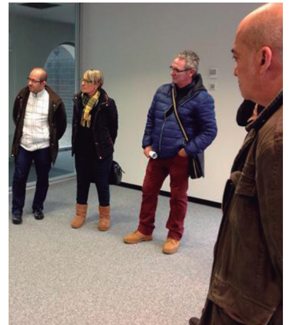
Ezkerrean Barrio eta Garitano KOOPeratzeko zentrora egindako bisitan eta eskuinean Aterpekoekin bildu den unea.