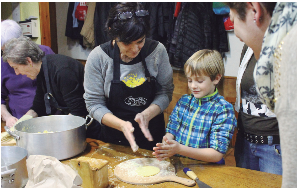
Belaunaldi guztietako herritarrak bildu ziren Xirimiri Elkarteak taloak nola egin ikasteko.

Eta gogoratu, talo ona mehea eta txapa gainean jartzean harrotu egiten dena da. Ziur halako asko egingo dituztela igandean talogileek Okendo plazan.