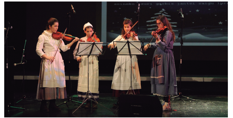
Hainbat instrumentu izan ziren protagonista asteazkenean, biolina horien artean.

Asteazkeneko emanaldi bereziari amaiera emateko, Udal Musika eskolako ikasleek beste eguberrietako kanta sorta bat abestu zuten: 'Din dan don' eta 'Gauko izar', besteak beste. Kontzertua ikustera joan ziren herritarrek gogotik gozatu zuten ikasleen emanaldiekin, eta txalo artean agurtu zituzten artista guztiak.