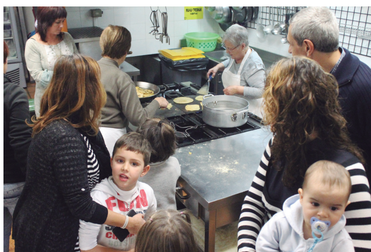
Kolpeka gaztetxoek, eta palan talogile trebatuak.