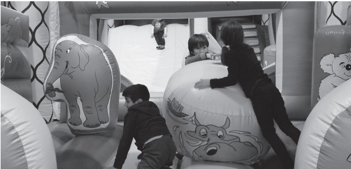
Adinka gune eta joko ezberdinak daude Eguberrietako Haur Parkean.

Bihar hasi eta 31 bitartean izango da Michelinen