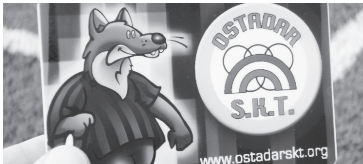
Bazkide txartel berria atera du Ostadarrek.

Abenduaren 23ra arte luzatuko da Ostadarren kanpaina: "Zure laguntza bihotzez eskertzen dugu eta gurekin jarraitzea animatzen zaitugu, kirol egitasmo hau gauzatu ahal izateko zure diru-laguntza ezinbestekoa baita", adierazi du klubak.