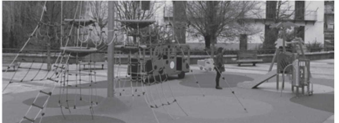
Dorre Parkea, Ahateen Parkea izenez ere ezagutua izan da Udalak berritu duen parkeetako bat.

Herriko beste parke batzuk ere berritu ditu Udalak, Brunet eta Tximistarreta kasu.