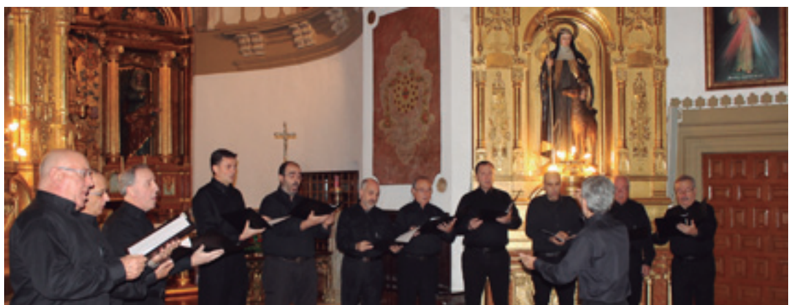
Emanaldiak eskaini dituzte asteburuan herriko Alboka abesbatzak (goian) eta Añorgako Ertizka otxoteak (behean).