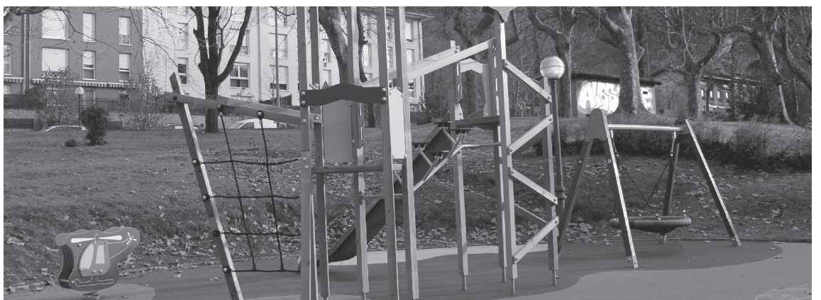
Brunet Parkeak itxura eta haur jolas berriak ditu orain.