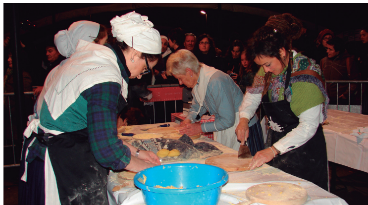
Taloak ez dira faltako igande honetan.

Uztaro kooperatibak ere jarriko du bere postua, lehenengo urtean bezala. Egitasmoari buruz informatu ahalko dira herritarrak, eta salda hartzeko aukera ere edukiko dute.