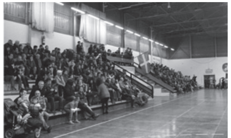
Herritar ugari hurbildu ziren Michelingo frontoira.

Maisu nafarrak Lasarte-Oriako ikaslearekin neurtu zituen indarrak. Nota onak ateratzen dituen horietako batekin. Arteaga ez zen inola ere kikildu, eta Michelinen beste behin erakutsi zuen urrutira iristeko gaitasuna baduela. Tanto ederrak egin zituen hark ere, ikusleak eserlekuetatik behin baino gehiagotan altzaraziz.