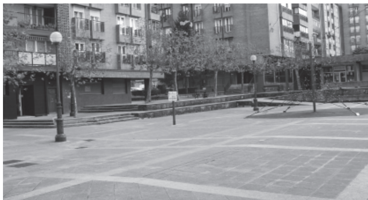
Sasoeta auzoko Uzturre plaza.

PSE-EEK "helburu elektoral" ikusten du obra hauen lizitazioan: "Konturatu dira denbora gehiago behar izate-