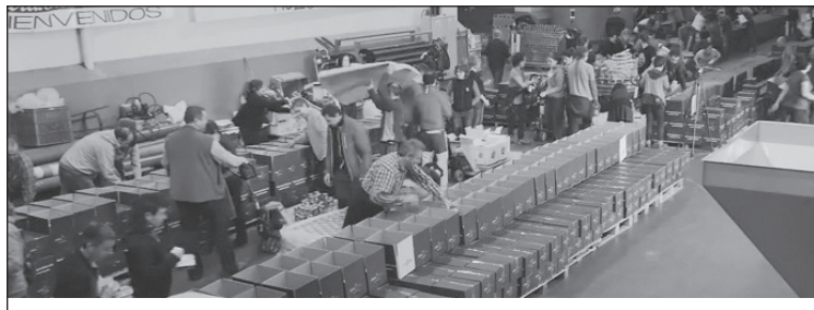
Hainbat herritarrek lagundu zuten Nafarroako produktuak kaxetan sartzeko.

2012an egin zen lehenengo kanpainan 1.500 saski banatu ziren, 2013an 8.000 izan ziren. "Aurtengoan, koxka bat harago heldu gara: 12.000 saski! Iaz 500 banaketa-gune izatetik, aurten Euskal Herriko lurralde guztian zehar 700 banaketa-gune izatera heldu gara. Guztira, ia 200 herri ingurutan egon da presente kanpaina, eta herri gehiagotara heltzen ari den heinean, emaitzak ere haziz doaz. Eskerrik asko, banaketa-gune-