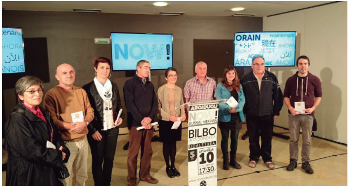
SAREk agerraldia egin zuen ostiralean Donostian, urtarilaren 10eko manifestazioari buruz xehetasunak emateko.

Hilabete batzuk badaramatzate lanean beraz SARE egitasmoa osatzen dutenek. Erronka nagusia "euskal presoak Euskal Herrian izatea" da, Todak azpimarratu duenez. Horrez gain, egitasmoak baditu berehalako beste bi: urtarilaren 10ean Bilbon egingo den manifestazioa antolatzea eta 'Dispersioaren