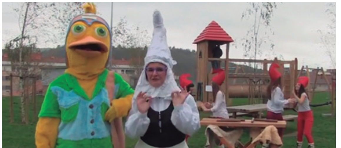
Galtzagorriak, Basajaun, Basandere izango dira besteak beste desfilean Olentzero, Mari Domingi, Xixuko eta Porrotx laguntzen.

Ohi bezala desfilea herriko erdigunetik egingo da eta haurrek aukera izango dute Olentzero, Mari Domingi edo Xixukori eskutitzak emateko.