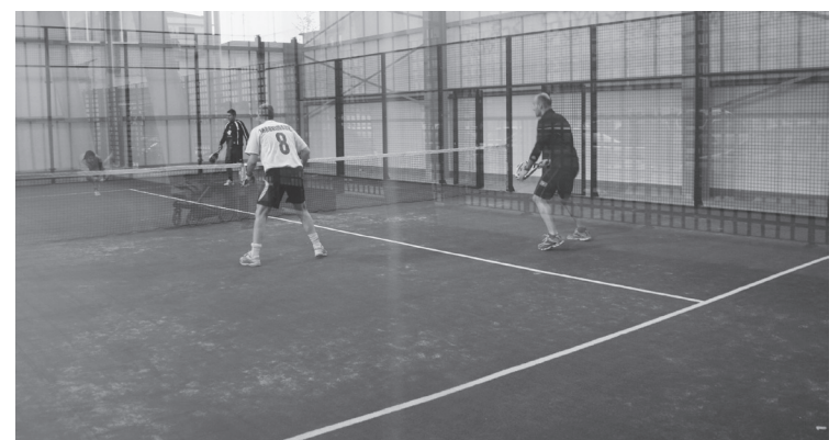
Padel eta tenis pistak, pista balioaniztuna eta pilotalekua alokatu ahalko dira.

Orduen banaketa zozketa bidez egingo da ostiralean, 18:00etan, Udal Kiroldegian.