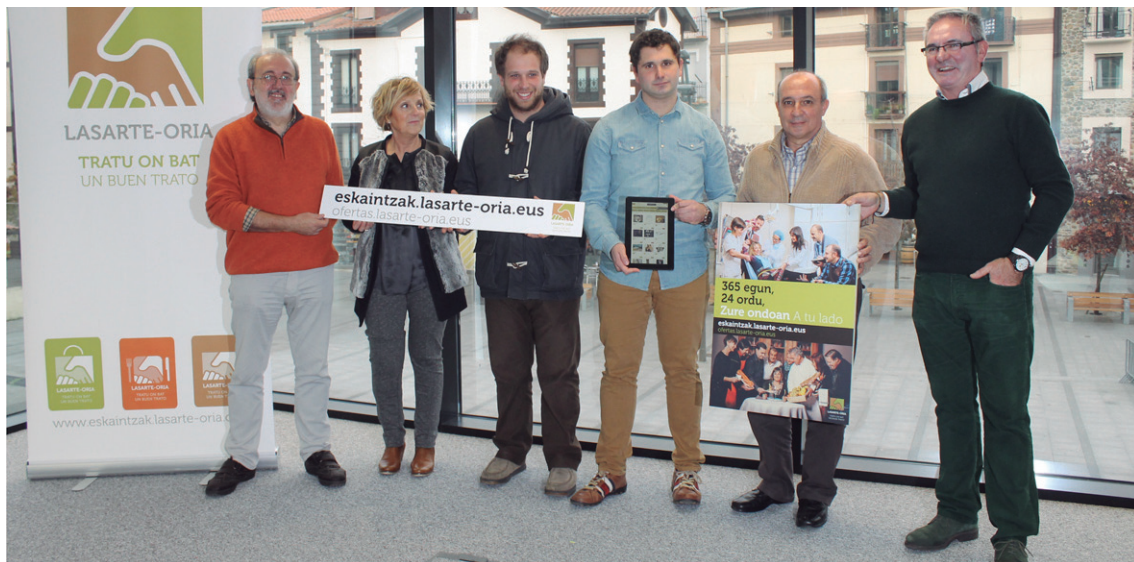
Ostiralean Udaletxean egin zuten udal ordezkari eta Aterpekoek webgune berriaren aurkezpena.

Udalak lasarte-oria.eus ataria martxan jarri du herriko merkatariek sarean erakusleiho berri bat izan dezaten. Momentuz Aterpeako denda eta tabernen eskaintzekin osatu da eta dagoeneko herriko gainontzeko merkatariek aukera dute bertan euren eskaintzak ere txertatzeko. Ostiralean egin zuten Udaletxe berrian atari berriaren aurkezpena.