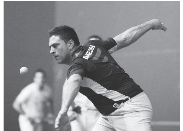
Partidan bildutako dirua Xirimiri Elkartearentzat izango da.

Profesional maila utzita, halako egunetan jokatzeko du Goñi II.ak. Oronozko mutila motibatuta dago eta erreparorik gabe erantzun ditu galdera guztiak.