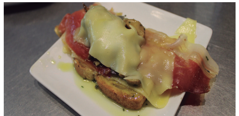
Aterpeak antolatutako II. Pintxo Lehiaketako sariduna argazkian.

Arkupe tabernari lekukoa Ahartu dio Trumoi, Aterpearen II. Pintxo Lehiaketa irabazi baitu herritarren bozkek zenbatu eta gero. Urdaiazpikoa, perretxikoak, piper berdeak, oliba olioia eta gazta urtua biltzen zituen ogi txigortu xerra bat prestatu zuen Trumoi aurtengo lehiaketarako. Denera zortzi tabernak hartu zuten parte: Yolandak, Galiziak, Abendek, Trumoi, Arkupek, Sanchok, Txanpak eta Buenetxeak.