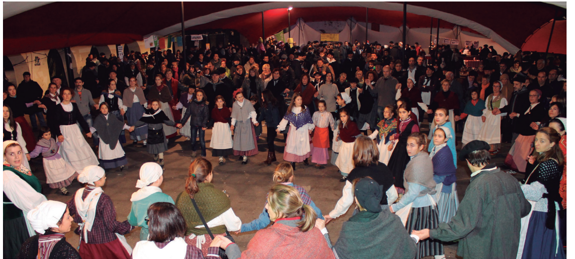
Erromeria jendetsua egin zuten lehengo urteko Santo Tomas jaietan, Okendo plazan.

Aurtengo Santo Tomas jaiko egitarauaren lehenengo ekintzan ere etxeko gaztetxoek izango dira protagonista;