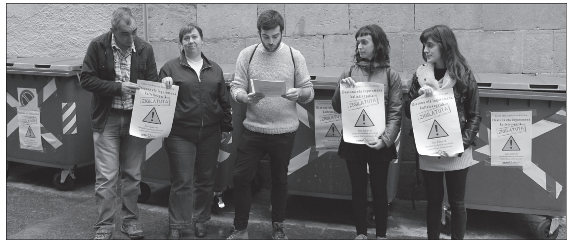
Agerraldian edukiontzia zigitatuak erakutsi zituzten.

"Gizon-emakumeon eskubi-deak bermatzeko betebeharrak dute agintariei. Ezin dute diru publikoa zaborra sortzeko bitartekoetan xahutu", adierazi zuen Lasarte-Oria Zero Zabor taldeak. "Materia orga-