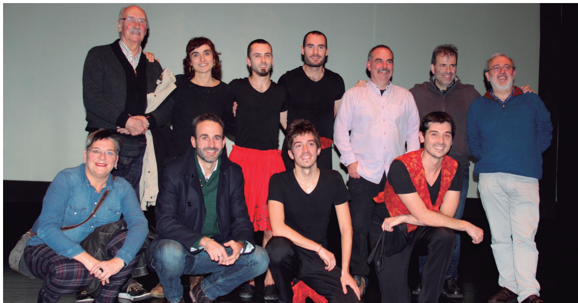
Herenegungo ekitaldiko partaideek argazkia atera zuten denek elkarrekin, amaieran.