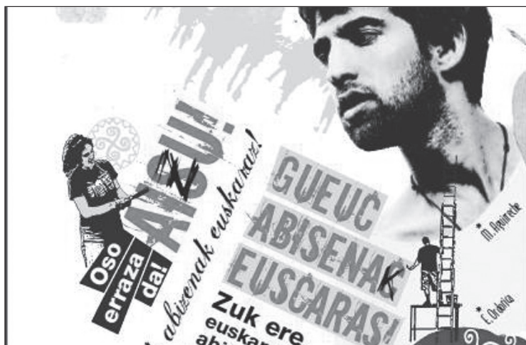
Bake epaitegian eska daitezke informazioa.

Jatorriz euskarazkoak diren abizen asko gaztelaniazko grafiarekin idazten dira oraindik. Euskaraz jarri nahi dituztenek nola egin dezaketen ezagutzera emateko ekimena jarri dute martxan aurtan ere Buruntzaldeko Udalek. Azpilicueta, Zalacain, Eizaguirre, Aguirreche, Echeverría, Arregui, Lecuona, Aguirre, eta horiek bezalakoak deitura euskaldun euskarazko grafiaz idatzita nahi dituenak oso modu errazean egin dezake. Bi tokitara joan beharko du herritarrek: Udaletxera eta Bake Epaitegira. Donostian jaiotakoak baldin bada, gainera, Donostiako Erregistro Zibilera ere joan beharko du. Aldaketa egin ahal izateko, hiru agiri eskuratu behar dira: errolda-agiria, Udaletxean eskatu behar dena; jaiotagiri