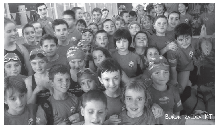
Buruntzaldea IKTko gazteak pozarren, Tolosako jardunaldiaren ostean.