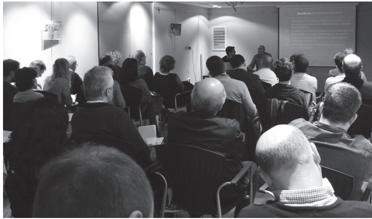
Villa Mirentxun egin zen lehenengo Innoforo saioa, ostegun arratsaldean.

Innoforo lehenengo saioa egin zuten ostegunean Villa Mirentxun. Saio hauek Donostia-Berriko garapenerako ardatz estrategikoak identifikatzeko eskualdeko eragile sozioekonomikoen arteko espazio parte-hartzailea dela azaldu zuten.