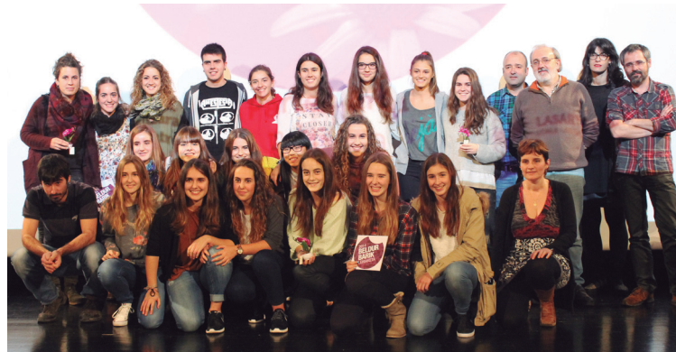
Lasarte-Oriako Beldur Barik lehiaketako saridunen familia-argazkia.

Altxa emakumea, hautsi aurre kateak’ lana izan da 12 eta 17 urte bitarteko mailan lehenengo saria eskuratu duen obra eta ‘(Hel)mugak’ berriz, 18-30 urte bitartekoetan gailendu dena.