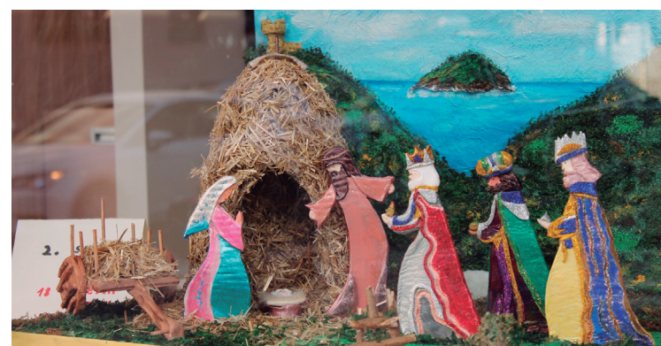
Lan politak egiten dituzte herritarrek urtero, Jaiotzen lehiaketan.

Hilabete eskas falta da Gabonak iristeko. Festa horien adierazgarrietako bat da Danok Kide elkarrekin urtero antolatzen duen Jaiotzen lehiaketa. Jaiotzak abenduaren 19an eta 20an entregatu beharko dira Blas de Lezo kaleko 11. zenbakian; sari banaketa handik astebetara izango da, abenduaren 28an, 12:00etan.