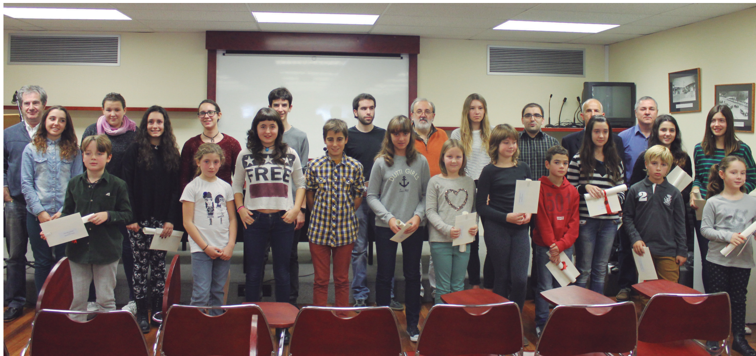
Larunbatean egindako Literatur Lehiaketaren sari banaketa amaitu ostean, familia argazkia atera zuten saritu, kolaboratzaile eta udal ordezkariak.

753 lan aurkeztu dira aurten, kategoria desberdinetan