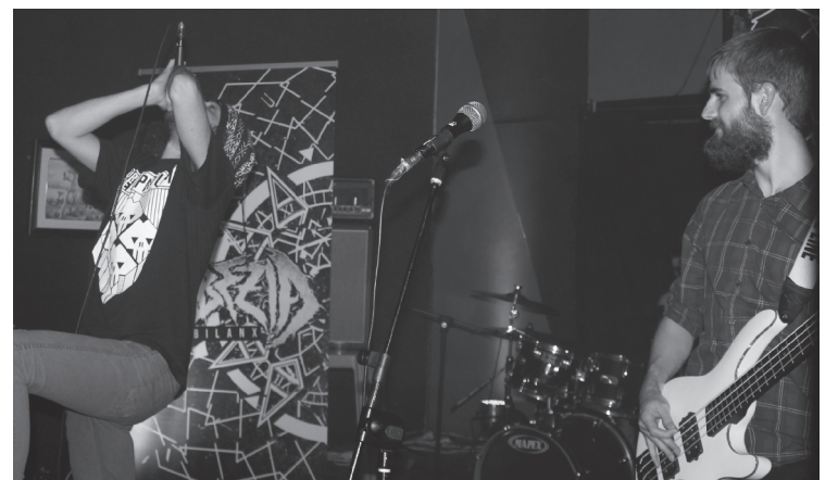
'Bilanx' diskoa aurkeztu zuen herriko Gabezia taldeak larunbat gauean.

Zumaiako Izu Nauk taldeak eman zuten gaueko azken kontzertua; 'Herri baten oihua' disko berria aurkeztu zuen ikusleen aurrean.