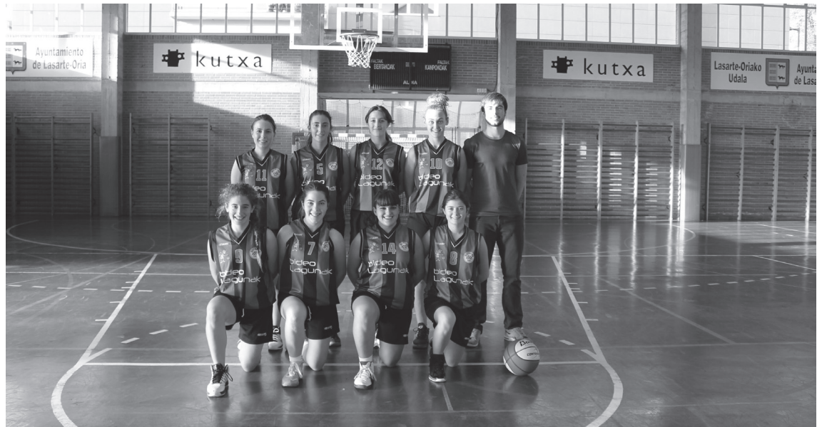
Seitik sei norgehiagoka irabazi dituzte Ostadar SKTko saskibaloia junior neskek.