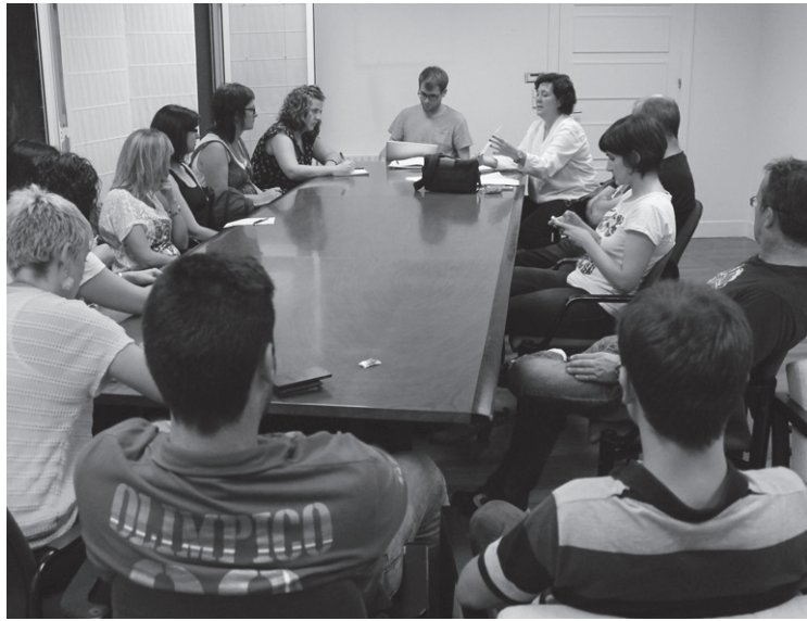
Ostegunean bildu ziren konpartsa ezberdinetako kideak Udal ordezkariekin.

Iaz Musika izan bazen Inauterietako gaia, 2015ekoa Ipuinak izango da. Denera 45 proposamen jaso dituzte eraikin publikoetako postontzietan, mota guztietakoak. Ostegun iluntzean kultur-etxean egindako bileran erabaki zuten konpartsek otsailaren 14an, larunbatean, izango den festa handiko gaia Ipuinak izango dela. Hori bai, Ipuinak izena jarri badiote ere, argi utzi dute komikiak edo marrazki bizidunek ere lekua badutela.