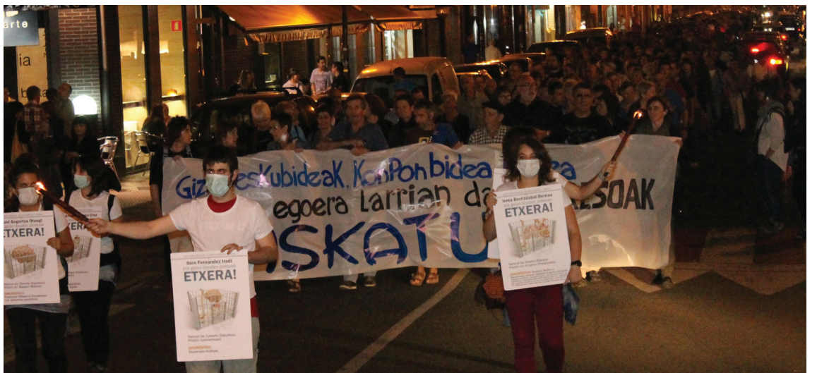
Okendotik abiatu zen manifestazioa ostiral iluntzean; deialdiak bat egin zuen hilabeteko azken ostiraleko mobilizazioarekin.