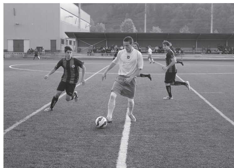
Gogotik borrokatu zuten bi taldeek Michelinen jokatuako norgehiagokan.

Denboraldiko lehen garaipena eskuratu zuten lurralde mailako erregional neskek. 0-2 irabazi zuten Antigua Luberriren zelaian, hiru puntuak poltsikoratuz horrela.