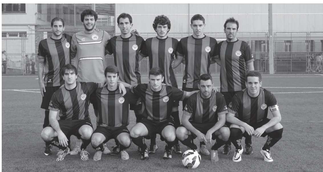
Irudian, Ohorezko erregionalen larunbateko hasierako hamaikakoa.

Indartsuago irten ziren Ostadar SKTko jokalariek bigarren zatian, emaitza bere horretan