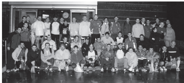
Iazko talde-argazkia. Garraio publikoa erabiltzeko eskatu du antolakuntzak.

Denak prest daude dagoeneko eta azken entrenamenduak egiteko garaia da.