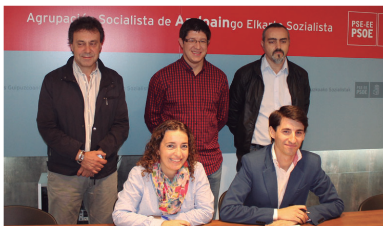
Buruntzaldeako PSE-EEK; EH Bilduren proposamena kritikatu zuten.

B uruntzaldeako alkateek asteartean aurkeztutako proposamenari erantzun zion PSE-EEK asteazkenean, Andoaingo PSEren egoitzan egindako agerraldian.