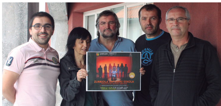
Atzo egin zuten agerraldia eta antzerkira gerturatzera animatu zituzten herritarrek.