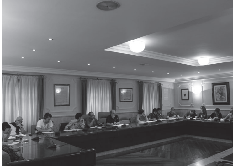
Asteartean burutu zen ohiko udal bilkura.