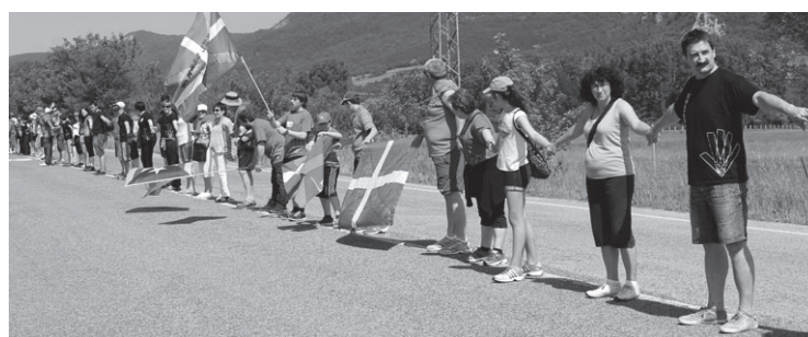
950 bat herritar joan ziren Uharte Arakilera ekainaren 8an.

2014ko urtarrilean aurkeztu zen herriko Gure Esku Dago taldea. Hainbat ekimen