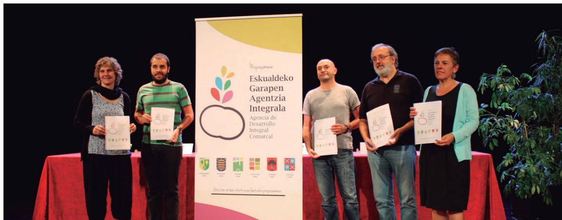
Garapen Agentziaren proiektua aurkeztu zuten asteartean Buruntzaldeako udalerrietako alkateek (Urnietakoa ez zen joan).

Eskualdeko Lankidetzeta Protokolo Orokorra izeneko agiria sinatu zuten eskualdeko sei udalek 2012ko maiatzean. Hori izan zen garapen agentziaren proiektuaren "lehen hazia", agerraldian nabarmendu zuten. Agiria sina-