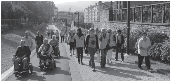
Ostiraleko ibilaldian hogeita hamar bat pertsonak hartu zuten parte.

Ibilaldia amaitu zenean, egitasmoaren aurkezpenaren azaldu bezala, ibilaldia burutu zuten adineko pertsonen ziguilu bat jarri zieten erreze-ten liburuxkan.