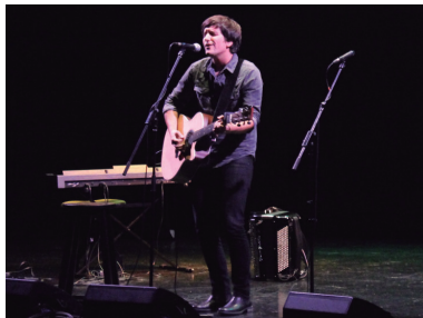
Argia Egun bezperako argazki eta bideoa txintxarri.info webgunean daude ikusgai.