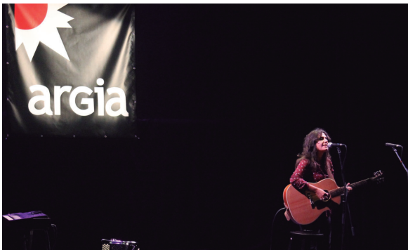
Ilgandean ospatu zen Argia Eguna Usurbilen, bezperan kontzertua eskaini zuten Euskal Herriko musikari ezagunek herrian.