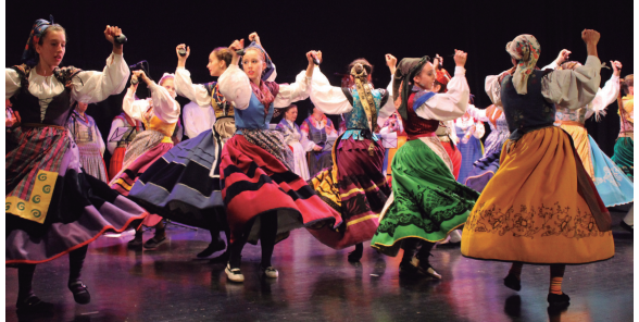
Burgoseko jantzi koloretzuek soinean, bertako dantza tradiziionalak eskaini zituzten El Torrejon taldeak Manuel Lekuonan.

Emanaldi honekin amaitu da honezko Kultur Kale Zikloaren zirkuitua, hainbat estilotako musikak eta leku ezberdinetako jendeak bisitatu Lasarte-Oria hilabete hauetan.