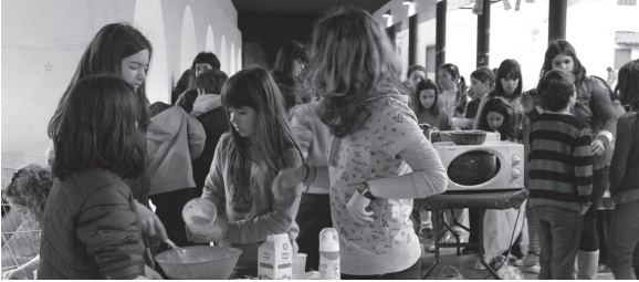
Postre txapelketa izan zen joan den ikasturtean Gazte Klubak antolatuakoko ekintzetako bat. Okendo plazan egin zuten.

Ostiral honetan izango da lehenengo saioa, 17:30ean