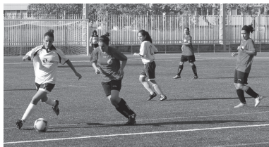
Ligako lehen partidua 0-2 galdu zuten Michelineen Antigua Luberriren aurka.

Beroak eta aukituzko aldaketarik ez edukitzeak min eman zion gorri kolorez jokatua zuen Ostadarri. Gainera, lehen