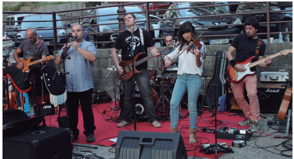
Adunia taldearen rock eta zeltiar doinuek girotu zuten Basaundin auzoa larunbat arratsaldean.