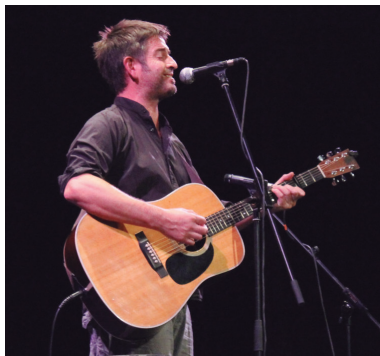
Mikel Urdangarin, Anari, Petti, Alboka, Berzaitz... Musikari handiak oholizatatu ziren.