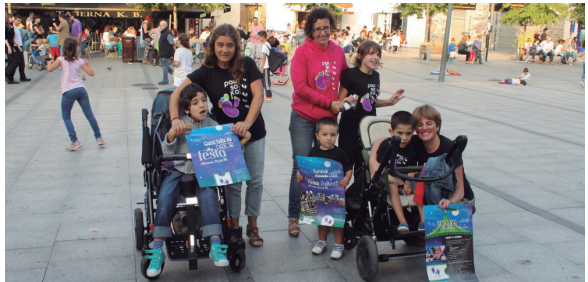
Pausoka elkartearen dauden Lasarte-Oriako familietako kideak, ostriral arratsaldean Okendo plazan egindako agerraldian.

Goizeko hamarretan hasiko dira ekintzak; aurrekoa dantza irekiko dute Pausoka Eguna, Gudariaren plazan. 10:30ean kalejira egingo dute txustalderen laguntzaz Atseginge plazazina eta 11:30ean tallerak hasiko dira: kirolak, janari osasungarriak, puzgarriak... 13:00ak arte.