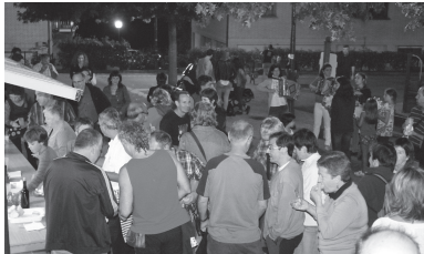
Zabaletarek urteroko sardina-jana egin zuten Antonio Blas Plazan Udal Musika Eskolako trikitilari gaztetoek girotuta.

Denera 30 bat lagun batu ziren sardinak afaldera ardo on baten edo sagardo freskoaren konpainian eta batzuek afalostean Argia Egunaren bezperako kontzertuetara joateko aprobetxatu