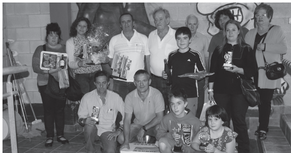
Lehiaketa amaitu ostean talde-argazkia atera zuten Michelingo bolatokia saridun guztiek.

Hogei bat jokalarri giro ederrean ibili ziren bolotara jokatzen goiz osoan zehar eta bolatokia bertaratutakoek goiz pasa polita egin zuten hiru orduko jardunaldia osatuta. Hurrengo urtean XII. edizioa egingo da.