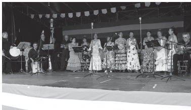
Ekainean Rocioko erromeria egin zuten Semblante Andaluzek Atsokabarran.

Goizeko 11:00etan topaketari hasiera emango zaio meza rozioerarekin. Jarraian, Semblante Rociero abesbatzaren emanaldia, Gasteizko "Raices del Sur" dantza taldearena eta Valen-