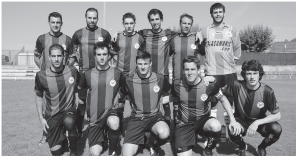
Ostadarren Ohorezko Erregionalak. 2014/2015 denboraldiko lehen hamaikakoa.

Bigarren zatian beheara egin zuten lasarteriatariek bero handia tarteko, baina baita hondarribiarren eginahaleraren eraginez ere. Etxekoan gola penalti jaurtiketa bidez jaso zuten Ostadarrek bigarren zatian. Dena den, denboraldiko lehen hiru puntuek Lasarte-Oriarako bidea hartu zuten.