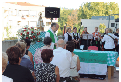
Guadalupeko Ama Birjinaren irudia bertan zela, meza eman zuten larunbatean.

Afaloosten berri, "Cafe Irlandés" musika-taldearen eskutik gau-festa izan eta kanta ezagunen erritimora dantzan egiteko aprobetxatu zuten herritar askok. Goizal-