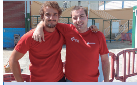
“Gero eta gehiagotan egiten da kirola euskaraz, ez dago arazorik”

raillaren hasiera gauza askoren hasiera da. Beteak beste, kirol ikastoi ematen zaie hasiera. Izan emateak, ordutegiak, egutegi...a, ehunka herritar bere herriko kiroldegian informazio eske edota izena ematen dabilen lanean ari dira Buruntzaldeko Udalek. Euskaraz eta sufituzko sesioak.