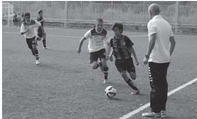
Kadeteen partida fisikoki gogorra, baina polita eta aukera askokoa izan zen.

Aurten etxeko lanak lehenago egiten saiatuko dira Ostadarreko bi talde nagusiak. Ez dira batere gaizki hasi.