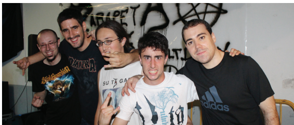
Debon talde beasaindarrak eskaini zuen lehen kontzertua. Behean, Parapetasonik metal jaialdiaren antolatzaileak.