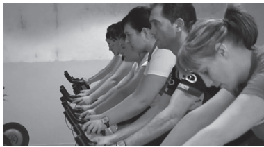
Ikastaroetan izen-emateko epea irekita dago plazak bete bitartean.

Aurtengo nobedadeak bat baino gehiago izango dira.