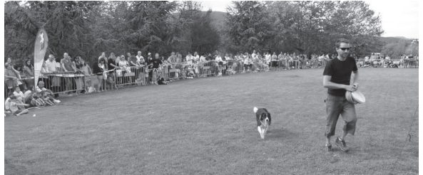
Jende ugari bildu zen iaz Atsoabakarreko parkean, Maskotaren lehenengo egunean.

Animali desberdinekin lan egiten duten hainbat elkarte joango dira igandean Atsoabakar parkera. Txakurrekin aritzen diren Galgoleku, Etxauri eta Adopta Boj eta