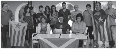
Ostiralean agerraldia egin zuten Okendon herriko EH Bilduko kideek.

EH Bilduko kideek eskoziar herria zoriondu nahi izan zuten, "bere etorkizuna erabakitze eskubidea aplikatuko duela" modu demokratikoan. Aldi berean,