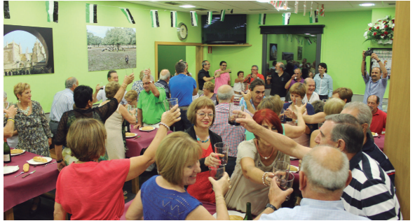
Denera 80 lagun bildu ziren larunbat gauean Extremadura Etxean egindako afarian, eta "lasarteartar guztiengatik" egin zuten topa.

Extremadura Etxeko lasarteartarrek hiru eguneko egitarau oparoa izan dute asteburuan herrian eta eguraldi ona lagun, Jaizkibel plazan eta Adarra Kaleko Extremadura Etxean bertan denetarioko kultur-ekintzak antolatu dituzte. Besteak beste, bazkari eta afari herrikoikiak, banderaren goratzea, meza, haur-jokoak, musika kontzertuak, bolo txapelketa, karta-jokoa... Ez dute aukera faltarik izan hiru egunez.