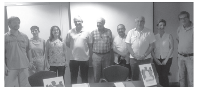
Villa Mirentxun egin zuten aurkezpena osteguneko.

Baina, aurreko hori ahaztu gabe ere, "urteetan zabaldu den indarkeriak utzitako izua deserritzen lagundu behar duen 'zoru etikoa' prestatu nahi dugunok ez daukagu