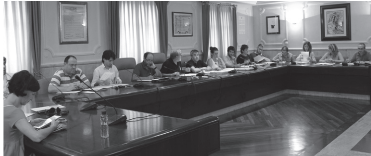
Asteartean egin zuten ikasturte honetako lehenengo udalbatzarra.