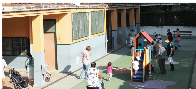
Gurasoekin egin dituzte lehenengo eskola egunak txikiak.