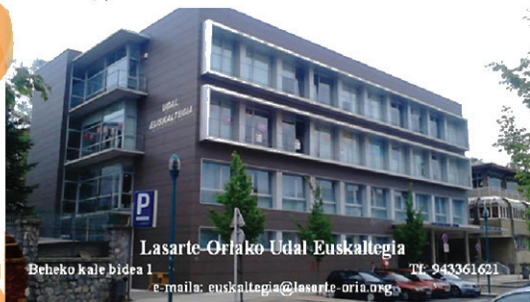
Lasarte-Oriako Udal Euskaltegia Beheko kale bidea 1 | Tf. 943361621 e-mails: euskaltegia@lasarte-oria.org