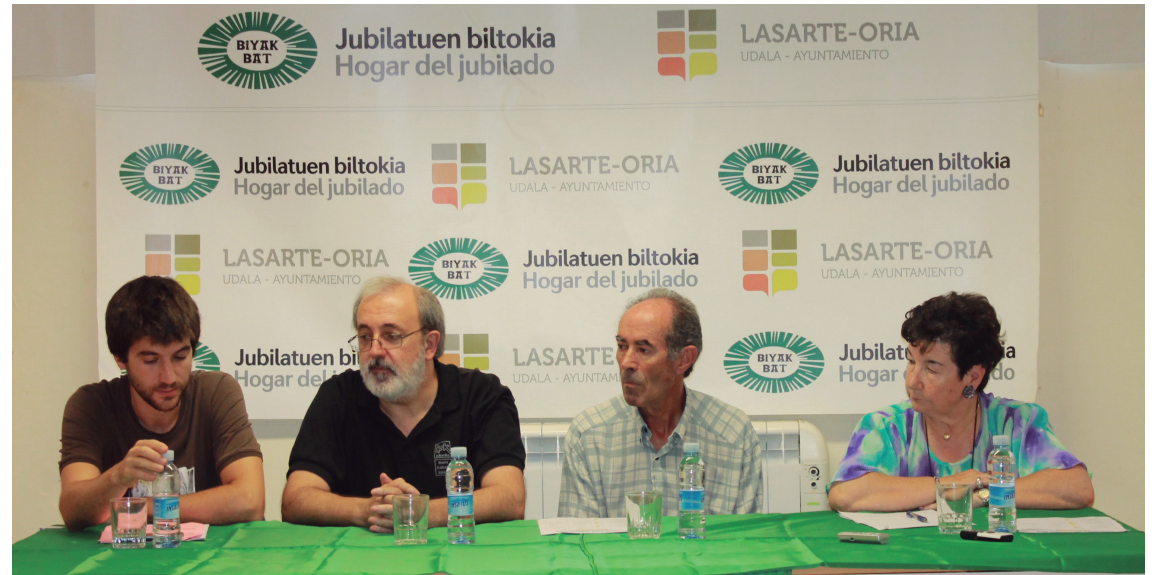
Biyak Baten aurkeztu zuten udaleko eta egoitzako ordezkariak Nagusien Omenaldiko egitaraua.

Urriaren 2an, Biyak Bateko abesbatzarekin batera emanaldia eskainiko du Ordizia abesbatzak Brigitarren komentuan. Urriaren 3an, ostirala, Okendon kalejira