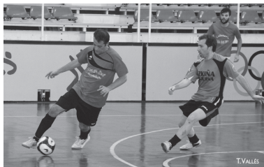
Viña del Marrek aukera bat edo beste sortu arren, Izkiña izan zen nagusi.