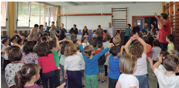
Xumelako kideekin dantzan aritu ziren txokoteko txikiak ostegunean.

Era berean, gaur eguerdian Saharatik herriko fami-