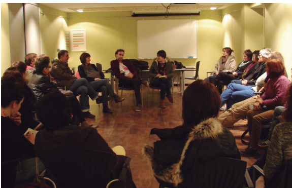
Harkaitz Canorekin Twist nobelaz hitz egiteko aukera izan zuten herritarrek Villa Mirentxun aberdun egindako saioan.

Zerrendan hainbat aldaketa egon daitezkeen arren, irakurgaiak zeintzuk izango diren zabaldu nahi izan dute. Izan ere, jakin baitira literatura-azalek oporretan hainbat irakurgai izango dituztela esku artean, euskarazko eleberririk ere egotea sustatu nahi dute taldeko kideek.