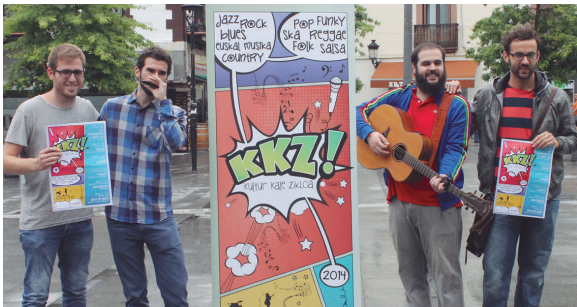
XpressionK elkarteak eta Udal ordezkariak Howdy taldeko kideen laguntzarekin arkezteko zuten Udako Kultur Kale Zikloa.

Hiru lagun sukaldari lanean jarritako dira eta hainbat gertakizun izango dira. Antzerki taldeko kideen hitze-