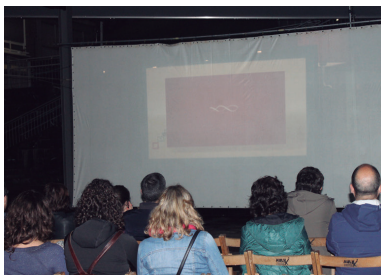
Herritar talde bat bildu zen Elizatze plazako estalpean "Her" filma ikustera

Kultur Kale Zikloaren kasuan gainera, "plan ezberdina egitera gonbidatzen ditugun herritarrik. Kontzertu egunetan, plaza eta parke ezberdinetara hurbildu eta adibidez, afari merienda batekin familian, lagunekin... musika goza dezaten," adierazi dute.