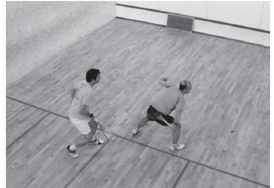
Squash txapelketako txapelundun faseko azken partidak aste honetan jokatu dira.

Hilabete honetan zehar, itzuli bakarrek ligaxka jokatu dute eta sailkapeneko lehen biak izango dira finala jokatu dutenak.