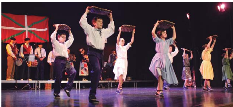
Erketz, Erketz Txiki eta Erketzeko lagunak dantza taldeek bihar eskainiko dute ikasturte amaierako ekitaldia Okendo plazan.

Era honetara, Gipuzkoa, Bizkaia, Araba, Nafarroa eta Behe Nafarroko dantza eta ohituretan barrena ibilbide bat egingo du dantza taldeak.