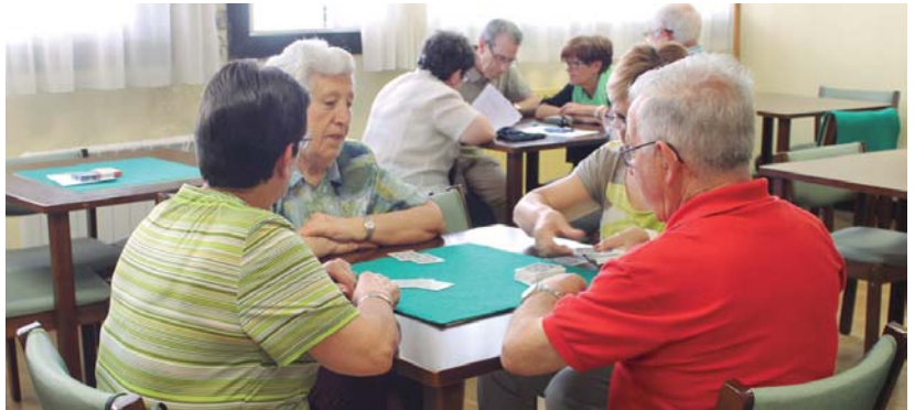
Ekainean zehar Biyak Bat elkarteko kide eta lagunak mahai inguruan bildu dira mahai-joko eta karta txapelketetan.

nak gonbidatzen ditu antolatutako ekintzetan parte hartu eta jaietaz gozatzera.