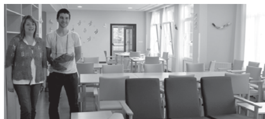
Udal ordezkariak Atsobakar zentroan izan den itxura aldatzea aurkeztu zuten.

Hau guztiaz gain, udal ordezkariak jakinarazi zuten eguneko zentroa 25 plazara eta zaharren egoitza 57 plazara homologatu eta egokitu dela.