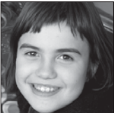
Alazne Zorionak poxpolina eta disfrutatu zure egunean. 10 Muxu potolo guztion partetik.