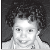
Lorea Zorionak printzeza zure hirugarren urtebetetzean!! Txokolatetzko hiru muxu familiaren partez. Maite zaitugu!