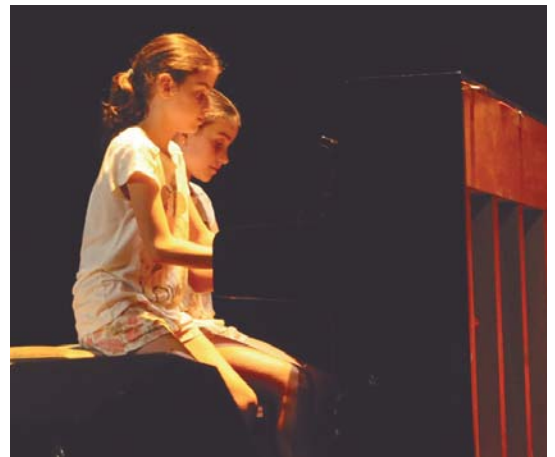
Udal musika eskolako ikasleek ikasturte amaierako kontzertuak eskaini zituzten.

Sarrerak internet bidez, 3,24 euro balio du; leihatilan, 3,50 euro.