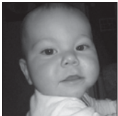
Doryan Eskerrik asko urte bete zoragarri hau eskaintzeagatik. Zorionak txapel-dun. Gurasoen partetik asko maite zaitugu.

Zorion agurrak bidaltzeko 943 36 68 58, txintxarri@txintxarri.info edo txintxarri.info web orrialdeko formularioa erabili dezakezue.