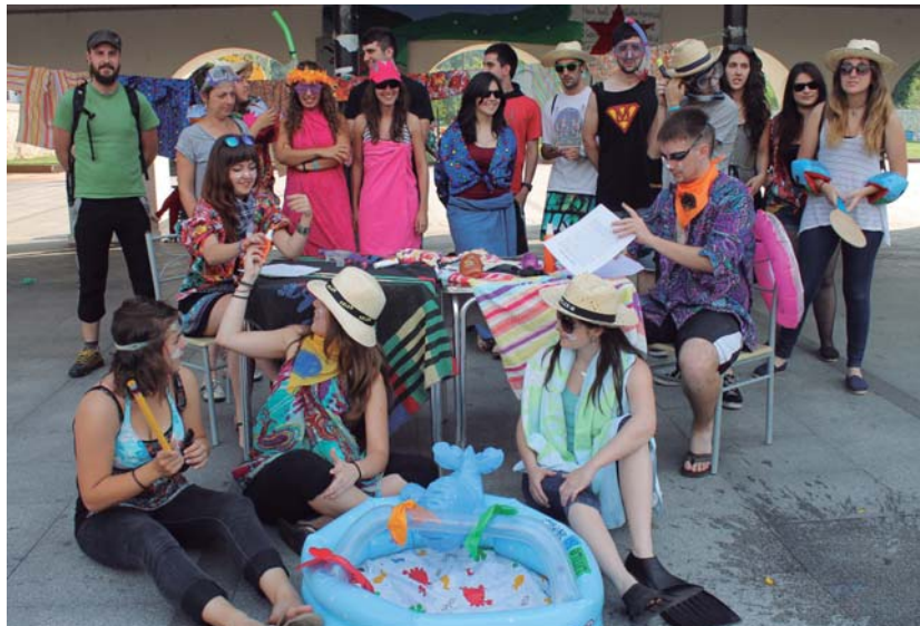
Okendo plazan hondartza muntatu zuten Sorgin Jaietako ekintza egitaraua aurkeztzeko.

Aurtengoan Sorgin Jaiak Ostadar eta Xirimiri omendu nahi dute. "Norbaitek jaietara hasiera eman beharko diela eta aurtengo Ostadar S.K.T eta Xirimiri elkarteak batera zoriontzeko aukera aproposa da. Batak 30 urte eta besteak 25, gazte-gazte biak eta oraindik ere