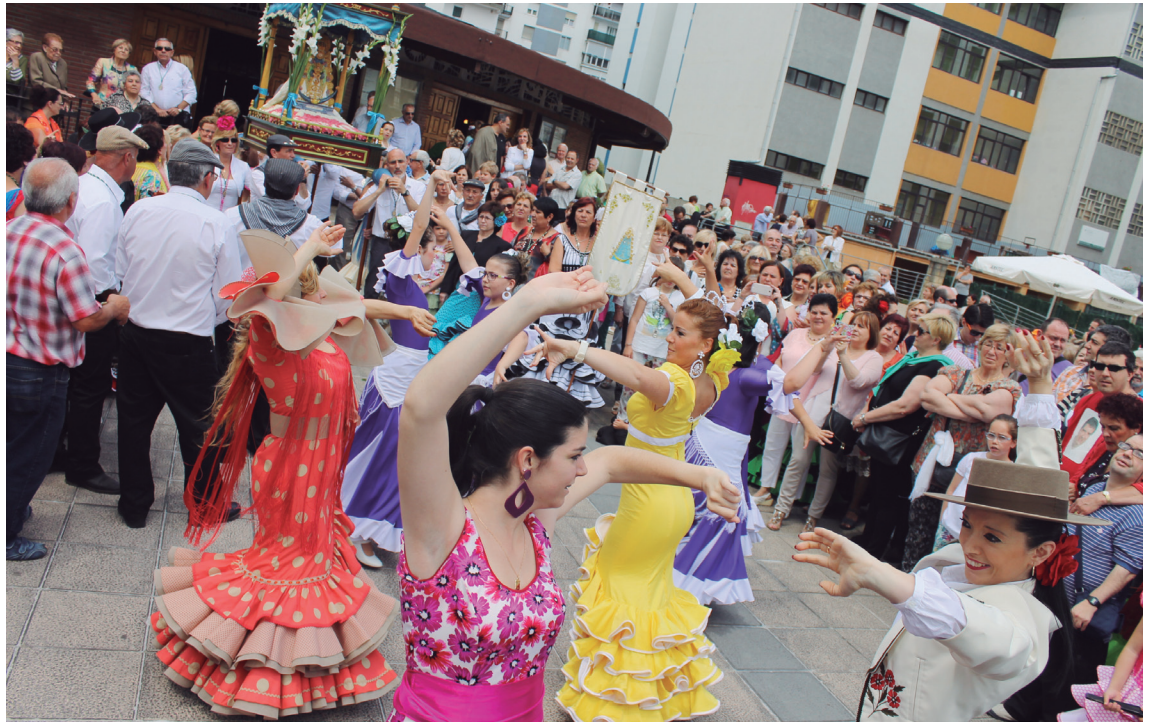
Rocioko amabirjinari dantzan eta kantuan egin zioten Zumaburuko eliza kanpoaldean, Atsobakarrerainoko prozesioa hasi aurretik.