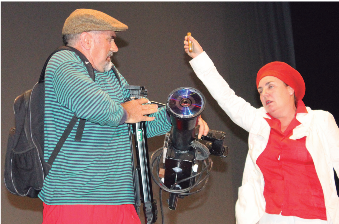
Helduen Klaketak Klak antzerkiak ikusleen barre algarak eragin zituen larunbat iluntzean.