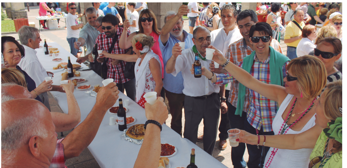
Autoritate eta gonbidatuei ongi-etorria emateko, ohorezko ardoarekin topa egin zuten Semblanteko kideek.

Ilunabarrean berriz, Alegria de la Sierra taldearen emanaldia izan zen birjinari azken agurra eman aurretik. "Salve Rociera" kantatuz, emozio handiko momentuak bizi izan zituzten Semblanteko kideek.