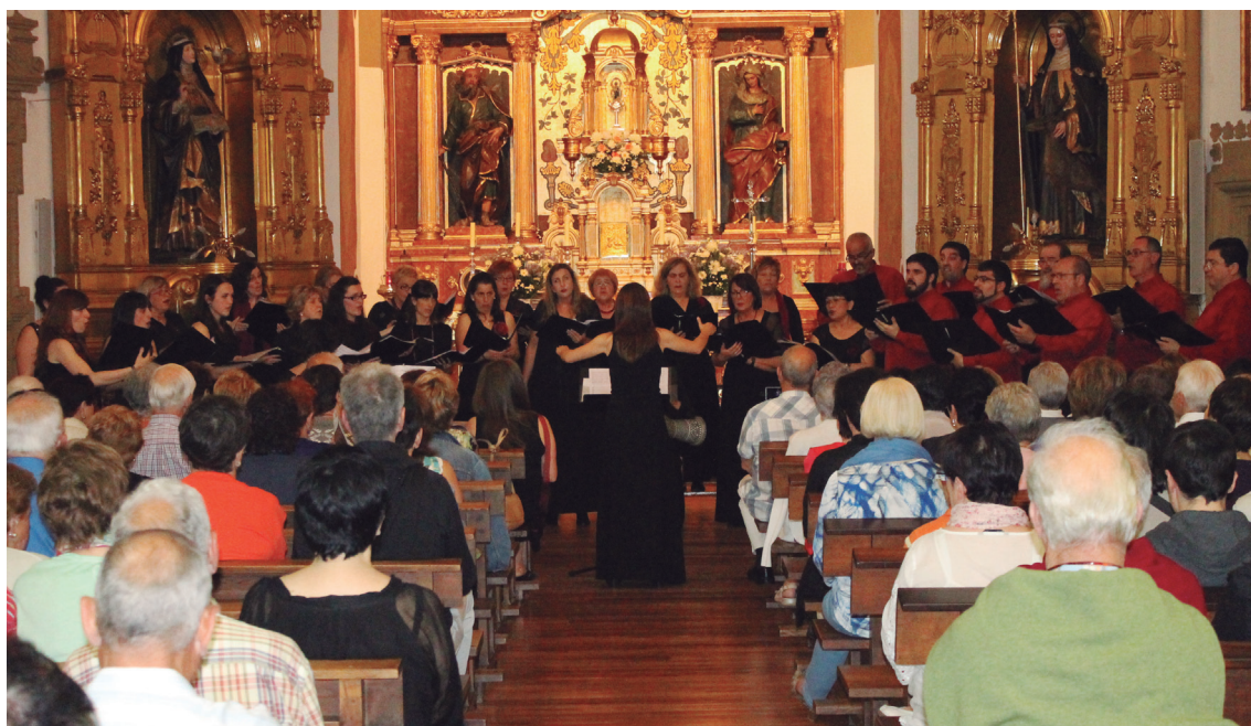
Eserleku guztiak beteta Brigitarren komentuan Albokaren kontzertua ikusteko.