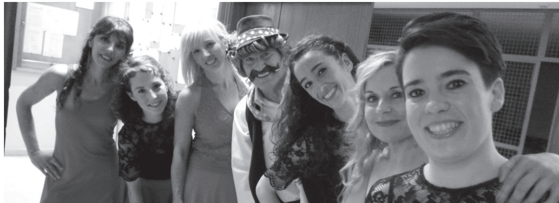
Kukuka Antzerki eta Dantza eskola eta Zambra dantza taldeko kideak Anakletorekin.

Ostegunetan, EOSein egoitzan entsegu orokorra izan zuten orkestrarekin eta Orfeoi Txikiarekin. FEVAS Euskal Herriko urritasun psikikoa duten pertsonen elkarte