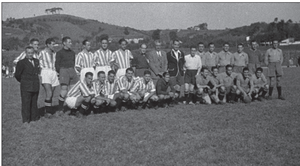
1944. urtean inauguratu zen futbol zelaiaren herria.