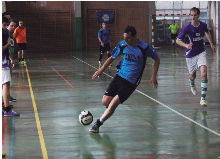
Herriko txapelketari ez zaio abiadura, kalitate eta intentsitaterik falta izan.