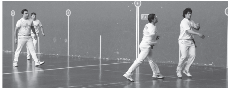
Lehen fasea zen aurten helburua baina dagoeneko Lasarte-Oria finalerdietan da.

Hala ere, bidea egina zuen taldeak. Joaneko jardunaldian, Lasarte-Oriak 2 eta 1