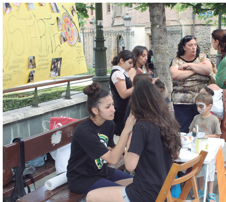
"Irriak elkarbanatzen" lelopean Brigitarren plazan pintxoak, haurrentzako pultserak egiteko tailerra, txapa tailerra, aurpegiak margotzekoak etab. izan ziren festa giroan.

Gazteek gainera, bertan ikastaro eta taller desberdinak