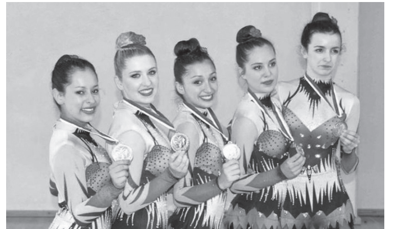
Kadete mailako taldea lortutako urrezko dominarekin. LOKE GIMNASTIKA

Bestalde, ekainaren 7an, Durangon jubentile eta senior