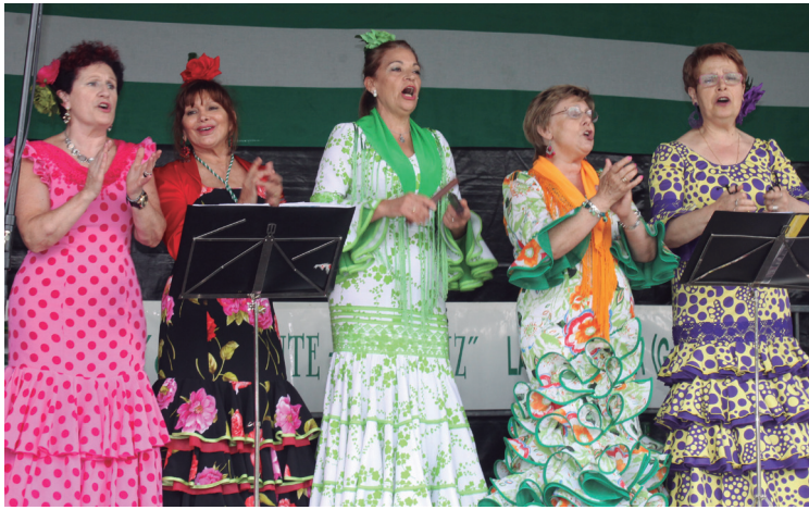
Kanpotik gonbidatuta etorritako etxeek ere primeran pasa zuten.