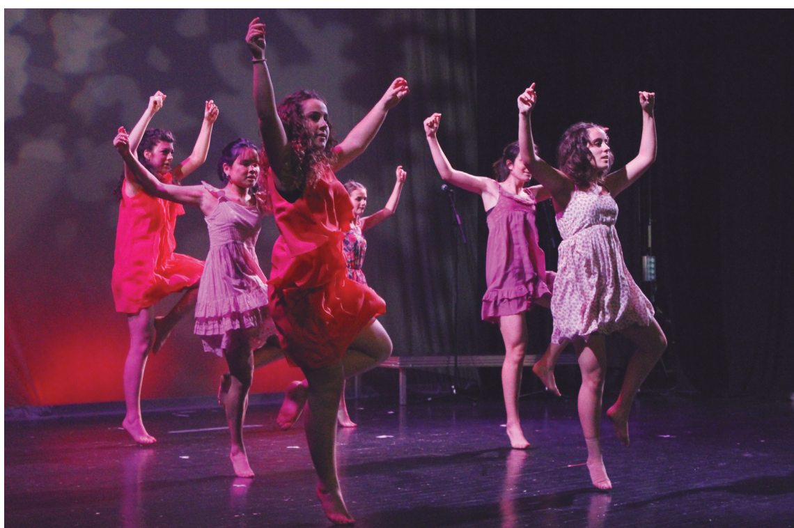
Igandean Dantzaz Blai eguna izan zen, euskal sorkuntza emanaldiek txalo zaparrada handiak jaso zituzten.