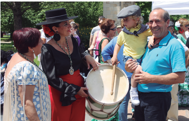
Festaren bi gune nagusiak Zumaburu eta Atsobakar izan ziren.