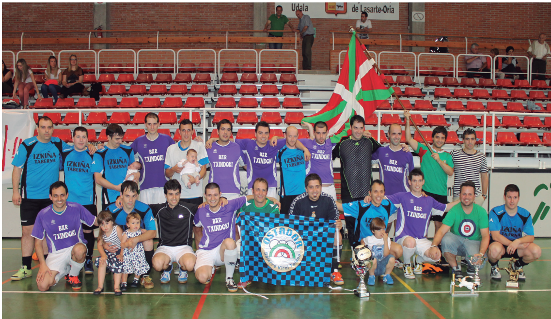
Ohi bezala, irabazle eta galtzaileek talde-argazkia atera zuten ikurrina eta trofeoekin, kiroltasunez.

Txindoki iazko garailea mendean hartu du 5 eta 2ko emaitzaz