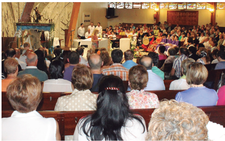
Urtero bezala, jendetza bildu zen meza rozieroan.