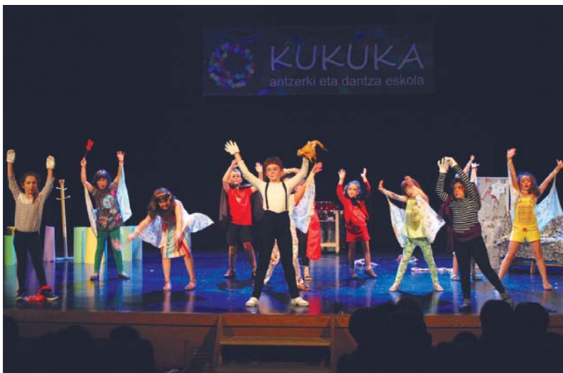
Sasoeta-Zumaburuko tximeleta eta mimoek ederki egin zuten dantzan haien antzerkian.