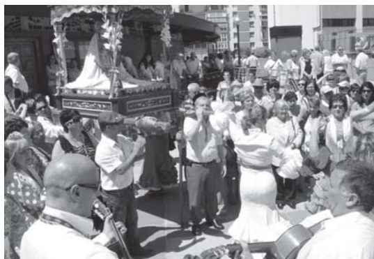
Aurten ere erromerian eramango da Rocio Ama Birgina Atsobakarreraino.