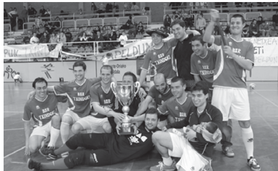
Txindoki tabernak iaz irabazi zuen txapela. Izkiña tabernak titulua kendu nahi dio.

Arratsaldeko 17:00etan hasiko da areto-futbolaren jaia kiroldegian kontsolazio finalarekin. Honetan Balardi