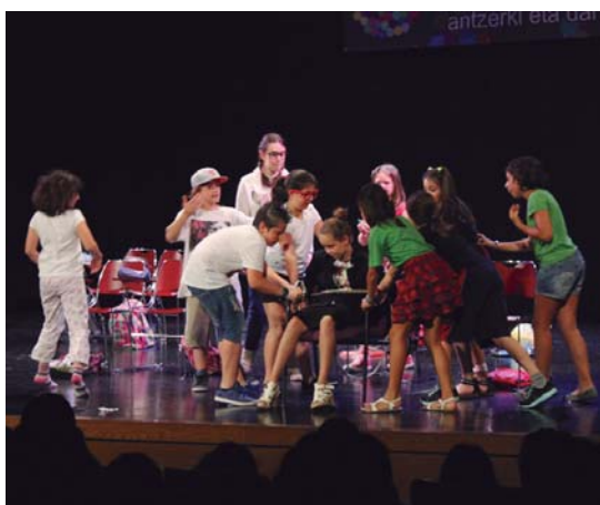
Zubieta edo Landaberriko taldeak ere izan dira aste honetan Manuel Lekuonako oholtzan.