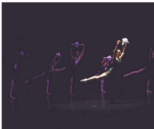
Udal dantza eskolako kideek haien trebezia erakutsi zuten asteazkenean.