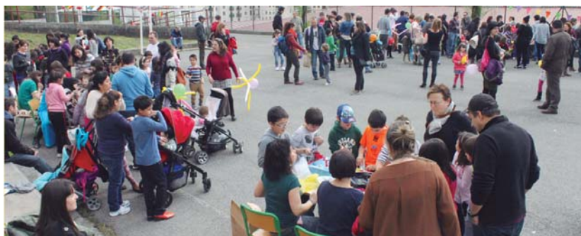
Kulturartekotasuna lantzeko Kulturartekotasun astea eta beste hainbat ekintza izan dira Sasoeta-Zumaburu ikastetxean.

Horregatik, Sasoeta-Zumaburu ikastetxeko bertako, zein atzerriko gurasoei dei egiten diete. "Guztiak animatzen ditugu parte hartzera eta ideiak ematera. Hurrengo ikasturtea, indarrez hasi eta ekintzak betetzeko".