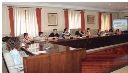
Udalbatzar aretoa ikasleek hartu zuten asteazkenean.