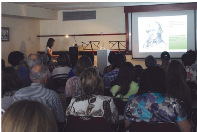
Musika eskolako ikasleek piano eta kamara entzunaldia eskaini zuten atzo. Musikaren historian barreneko ibilaldia izan zen.

Hala nola, untxiak, piratak, deabrutxoak, New York-New York, izeneko