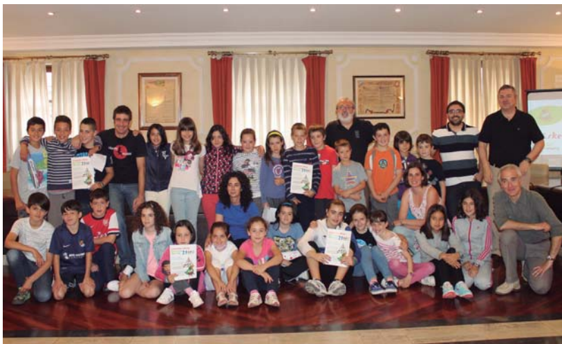
Saioaren amaieran ikasle, irakasle eta udal ordezkariak argazkia atera zuten.

Ikasitako zabaltzeko konpromisoa hartu dute denek eta udal ordezkariak ikasleei egindako lan ona eskertu zieten.