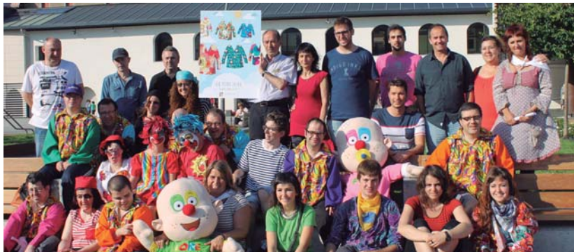
Festetako egitaraua osatzen lagundu duten elkarteetako kideak izan ziren atzo aurkezpenean.