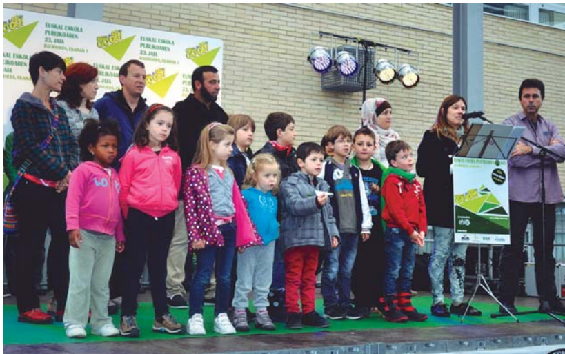
Burunzpe Guraso elkarteko kide eta Sasoeta-Zumaburu ikastetxeko haurrek saria jaso zuten Balmasedan. BURUNZPE GURASO ELKARTEA

Azken ekintza bat ere antolatu zuten, ekainaren 7an, Altxorraren bila Santa Klara uhartearen eta 200 pertsonen parte hartu zuten honetan.