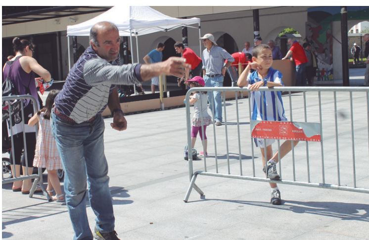
Euskadiko toka jokalaririk onenak Okendon izan ziren lehian.