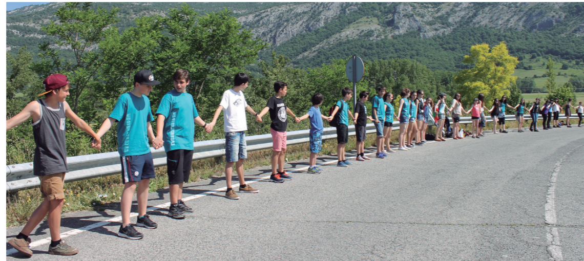
Eskutik helduta adin guztietako herritarrak ikusi ahak izan ziren giza katean parte hartzen.