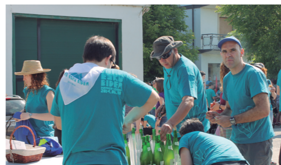
Autobuserako deia egin zuten herriko kaleetan barrena txistulariek, antolakuntzako kideek gogotik egin zuten lan.