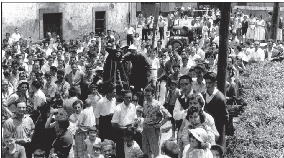
1955.urteko jaietako argazkia Tomas Fernandezen bildumatik aterata.