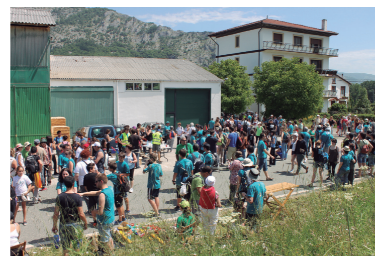
Herritarrek adi jarraitu zituzten antolakuntzako azalpenak.