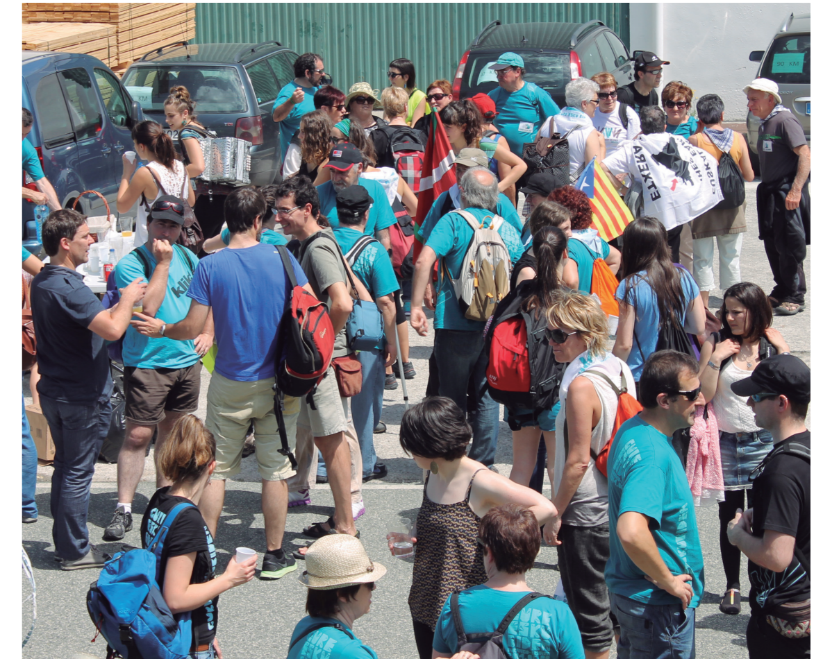
Uharte-Arakilera iritsi eta hamaiketako egiteko aukera izan zen giza katea osatu baino lehen.

EMAKUMEEN BIZITZA HOBETZEAREN GAINEAN ENTITATE PRIBATUEK EZ DUTE ERANTZUKIZUNA BEREGANATU BEHARKO DUTE.