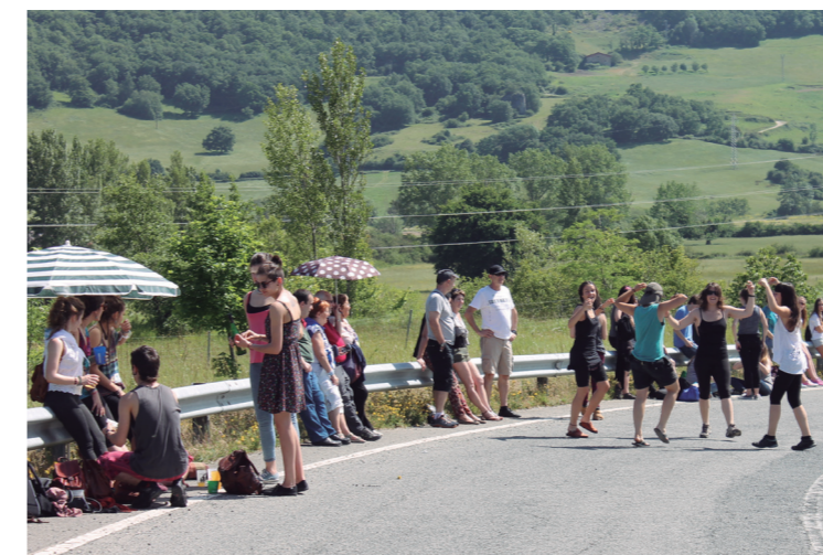
Lekua hartuta, ordua iritsi bitartean dantzan aritu ziren gazteak.