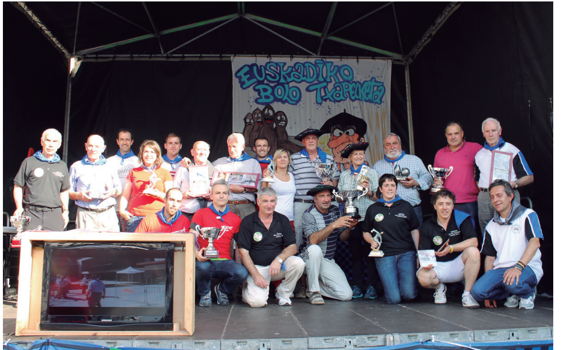
Amaitzean saria eta oroigarria jaso zuten bola eta toka jokalariek taldeko argazkia atera zuten.