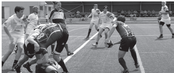
Gipuzkoako selektzio eta Stade Hendayais taldeko mutilak ederki ibili ziren.