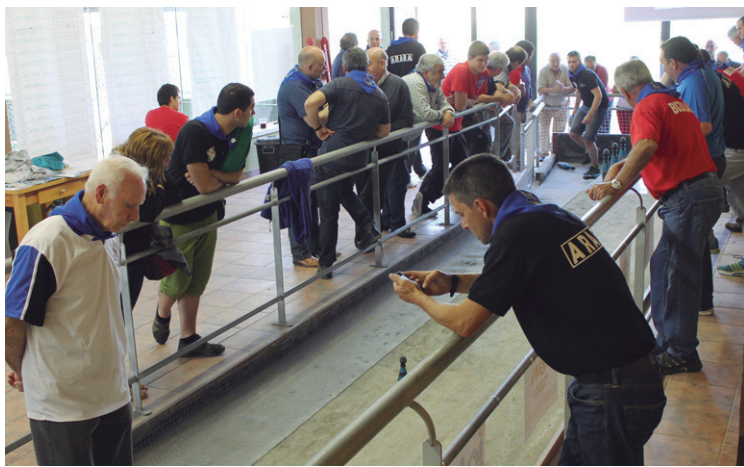
Giro ederra izan zen goizean zehar kirol guneko bolatokian.